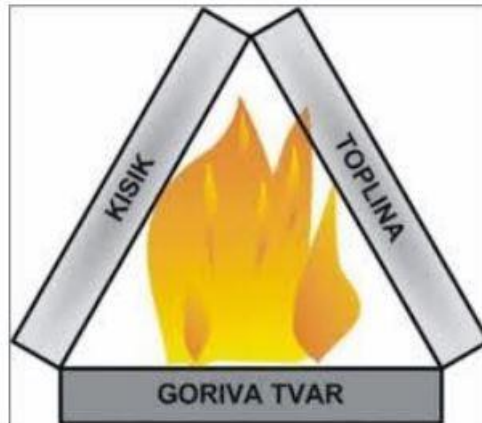
Slika 1. Komponente gorenja (požarni trokut).[2]