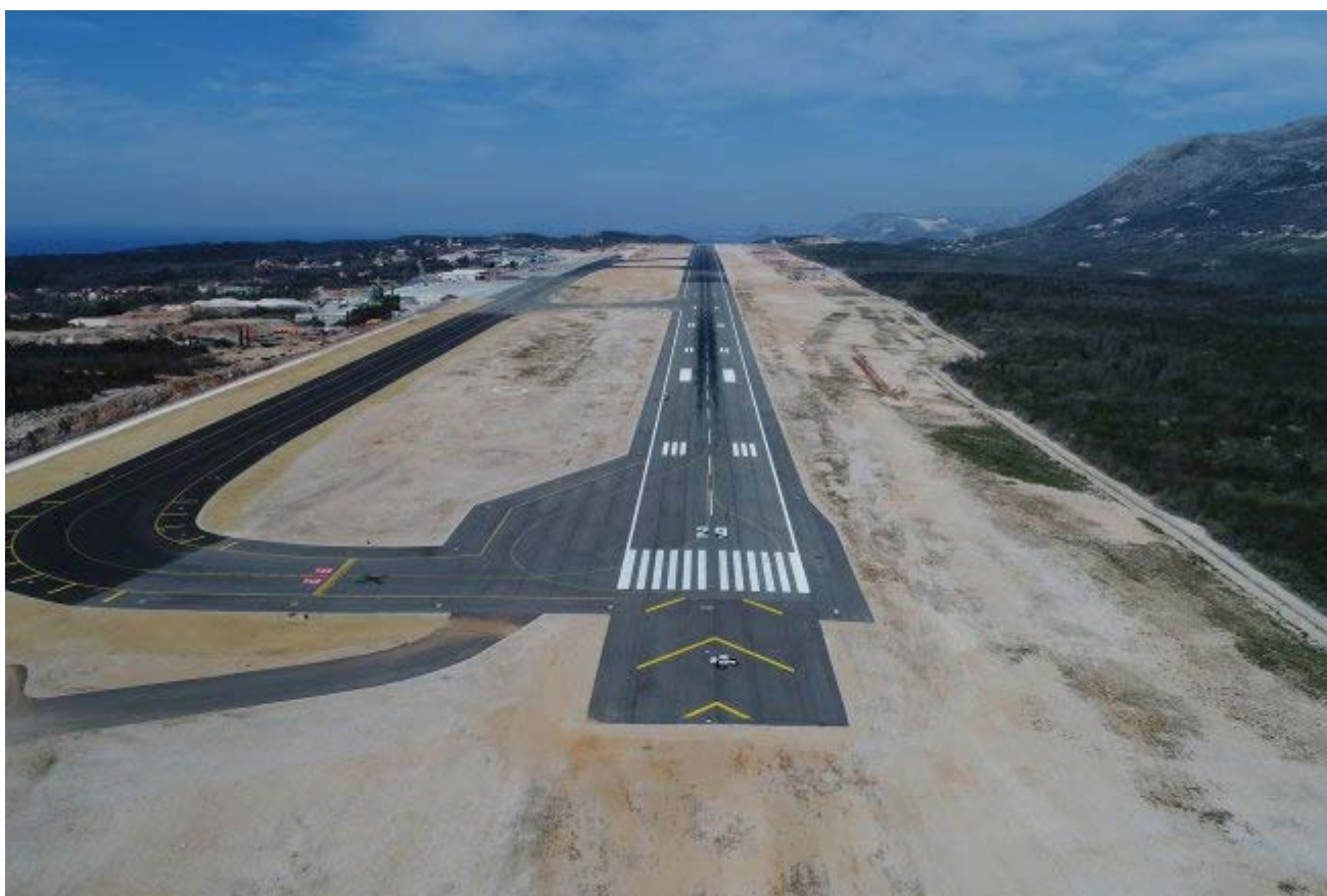
Slika 2. Infrastruktura građenja Zračne luke Dubrovnik [2]

Dio obuhvata 5: Izgradnja solarnog sustava