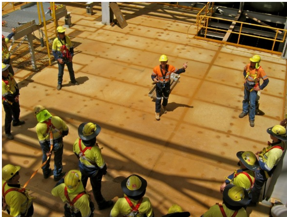
Slika 4. Prikaz standardnog praktičnog osposobljavanja radnika za rad na siguran način [4]

Koraci do učinkovitog programa osposobljavanja radnika za rad na siguran način: