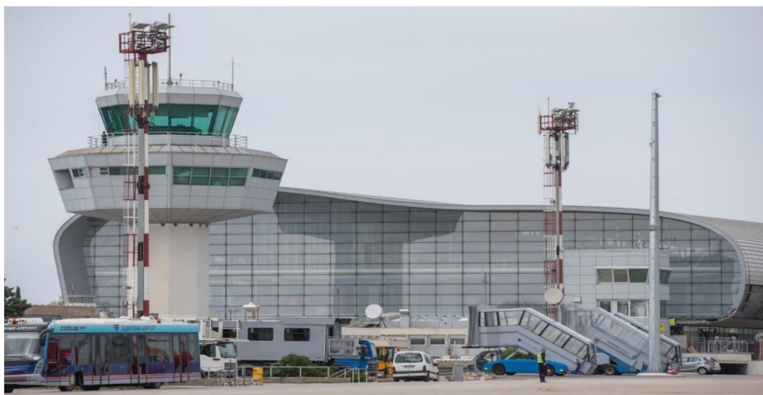
Slika 1. Zračna Luka Dubrovnik [1]

Zračna luka Dubrovnik jedna je od devet zračnih luka u Hrvatskoj. Nalazi se u Čilipima, 22 kilometra od Dubrovnika. Prvotno je izgrađena 1936. u naselju Gruda u Konavlima. Promet je zbog Drugog svjetskog rata jedno vrijeme bio zaustavljen, a 1960. zračna je luka premještena na današnje mjesto, pored mjesta Čilipi. Tijekom srpske agresije na Hrvatsku zračna je luka u potpunosti razorena, a imovina (oprema i signalizacija) opljačkana i odvezena u Crnu Goru te postavljena u zračne luke Tivat i Podgorica. Šteta na zračnoj luci bila je procijenjena na 180 milijuna kuna.