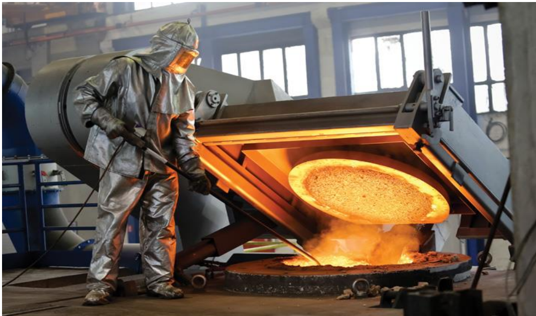
Slika 1. Radnik na peći za taljenje metala [1]

Metalna industrija ima globalnu važnost zbog njezine široke primjene u različitim industrijama, kao što su automobilska, zrakoplovna, građevinska, energetska, obrambena i druge. Ova industrija proizvodi i obrađuje razne metale, uključujući čelik, aluminij, bakar, željezo i druge. Međutim, metalna industrija također nosi brojne opasnosti za radnike i okoliš. Procesi proizvodnje i obrade metala mogu biti opasni zbog izloženosti kemikalijama, toplini, buci, vibracijama i drugim rizicima. Radnici u ovoj industriji često se suočavaju s ozljedama kao što su opekline, porezotine, lomovi, ozljede kralježnice i druge. Osim toga, metalna industrija može utjecati na okoliš zbog emisije štetnih plinova, onečišćenja zraka i vode te stvaranja otpada. Stoga je važno osigurati da tvrtke u metalnoj industriji pridržavaju sigurnosnih propisa i standarda za zaštitu radnika i okoliša. Također, kontinuirana inovacija i usavršavanje procesa mogu pomoći u smanjenju rizika i poboljšanju sigurnosti u ovoj industriji. Slika 1 prikazuje taljenje metala.