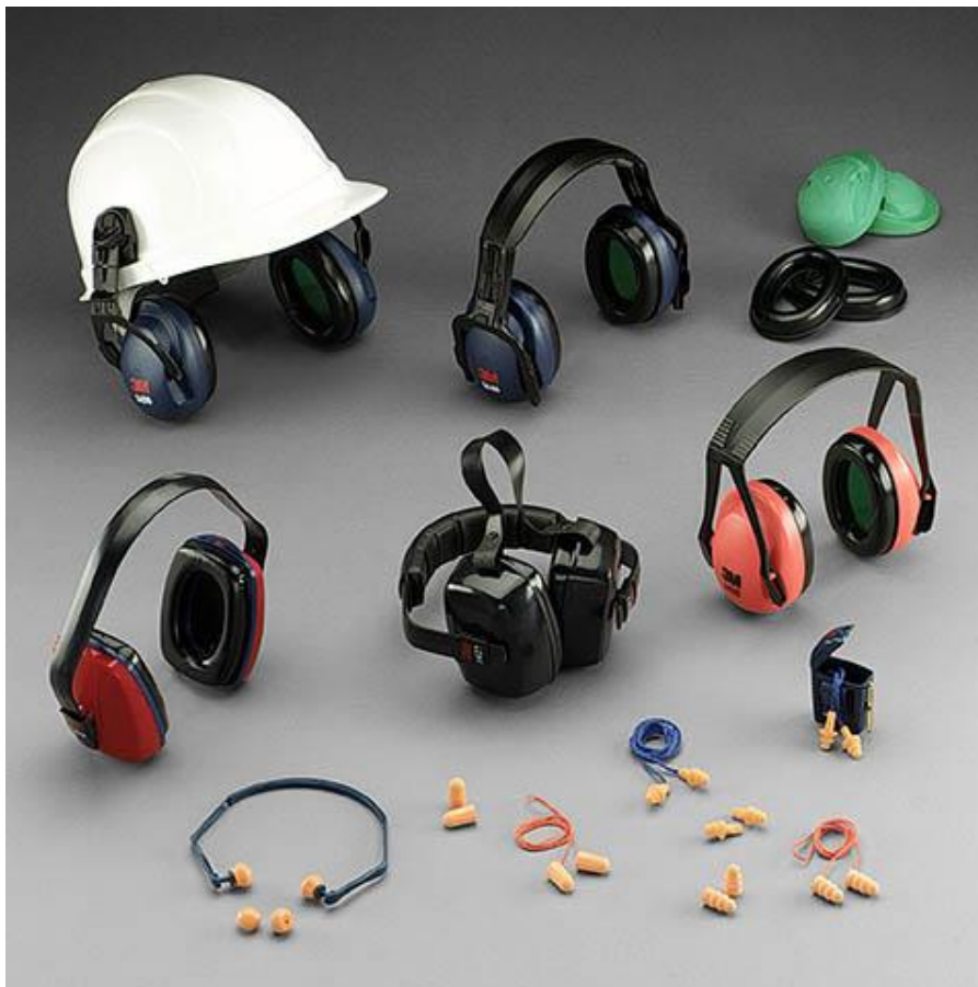
Slika 5. OZO za zaštitu sluha [10]

Oni koriste posebnu tehnologiju kako bi smanjili buku. Buka su neželjeni zvukovi koji otežavaju rad, te mogu biti štetni za zdravlje radnika. Buka može nastati na radnom mjestu (strojevi, uređaji, klima, ventilacija) i u okolišu (promet, industrija, ulična buka).