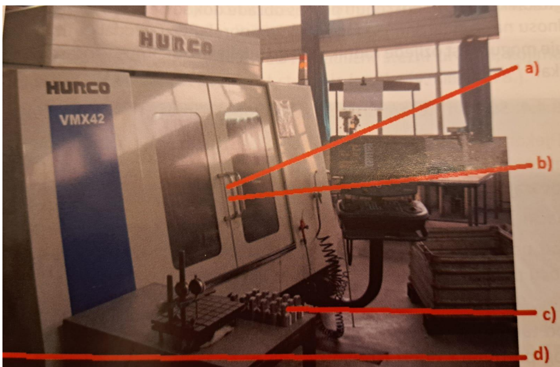
Slika 15. Mjesta opasnosti kod CNC tokarilice [5]

U radu s CNC glodalicama radnici moraju paziti kod stavljanja materijala, stezanja, zatvaranja i uključivanja radnog stroja. Opasnosti rada na CNC glodalici uključuju opasnosti od uklještenja prsta kod stezanja obradka. Kod čišćenja obradka postoji opasnost kada se to radi s komprimiranim zrakom i tada čestice mogu odletjeti u oči. Postoji i opasnost od pada predmeta kada radnik nosi obradak. Te opasnost od neispravnih električnih instalacija (slika 15), Zbog toga na CNC glodalici postoji preventivna zaštita koja počinje obukom radnika za stroj, te ugrađenim zaštitnim dijelovima na stroju [5].