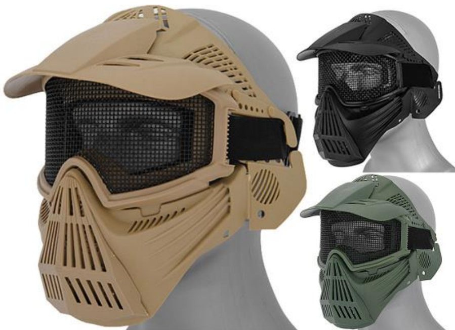
Slika 6. Zaštitni vizir [11]