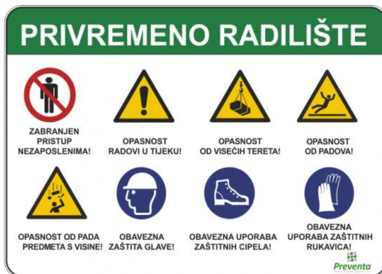
Slika 9. Znakovi sigurnosti na radu [11]