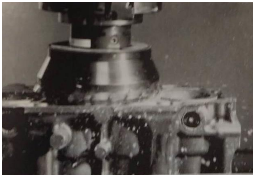
Slika 14. Opasnost letećih čestica [5]

Slika 13. Opasnosti rada na vertikalnoj glodalici uključuju zahvaćanje odijela radnika s vretenom, pucanje alata uslijed greše alata ili u radu, izmicanje ili odlijetanje obratka, opasnosti od prijenosnih elemanta, zakrčenosti radnog mjesta, poskliznuća, letećih strugotina ili neispravnih instalacija [10]