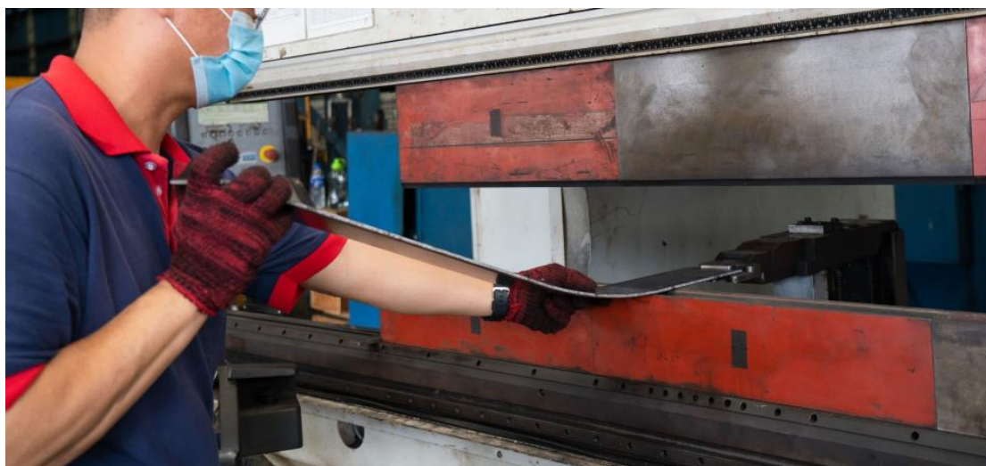
Slika 17. Rad na stroju za savijanje lima [18]

upravljačku jedinicu, uređaj za nožno upravljanje, hidrauliku, vodilicu za škare i opasnosti od dijelova pod naponom [5, 7, 19]. U radu sa strojevima za savijanje lima radnik ne smije zaboraviti nositi zaštitne rukavice. One štite njegove ruke od ozljeda oštrom opremom. Uvijek mora koristiti zaštitne naočale kako bi zaštitio oči od sitnih čestica koje lete tijekom procesa savijanja (slika 17). On mora nositi radne čizme. One će spriječiti da bilo kakav otpad ili šiljasti materijal ozlijedi njegova stopala. Trebao bi izbjegavati prelaziti rukama preko oštre posjekotine, čak i ako nosi rukavice. Trebao bi uvijek provjeriti jesu li sve oštrice pravilno isturpijane. Trebao bi uvijek održavati radnu površinu čistom. Treba očistiti sav otpad jer može predstavljati opasnost od ozljeda. Kada rukuje mokrim limovima, treba biti izuzetno oprezan. Mokre površine sadrže vlagu koja, kada se pomiješa s prljavštinom i uljem, može učiniti površinu plahte skliskom, što otežava držanje [19].