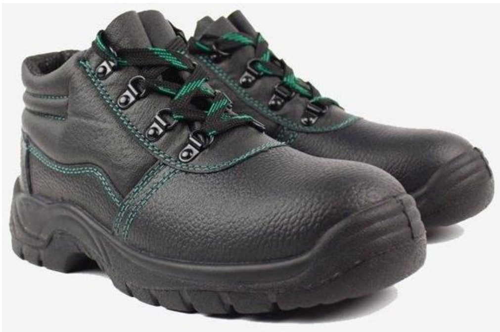
Slika 8. Zaštitne cipele s kapicom [10]