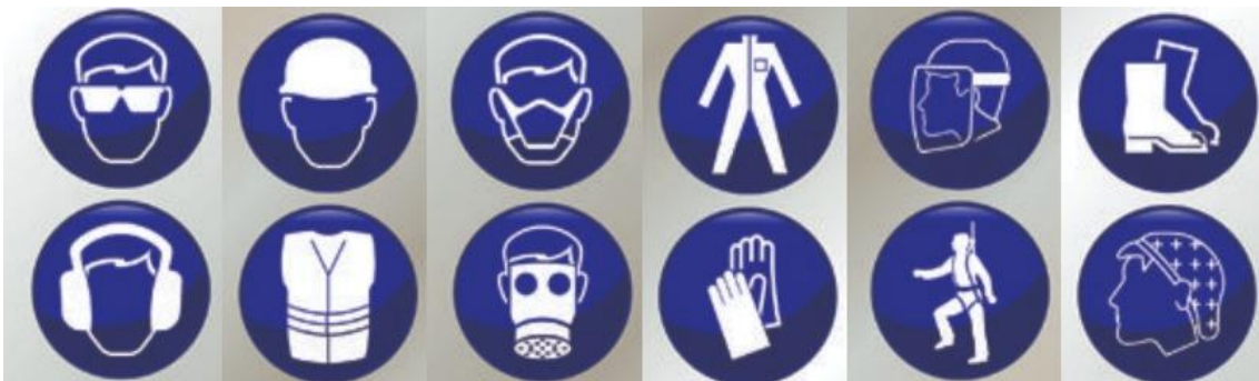
Slika 4. Osobna zaštitna oprema [9]

Osobna zaštitna oprema (OZO) je skup predmeta, pomagala i dodataka koje radnik koristi pri obavljanju posla kako bi se zaštitio od jednog ili više rizika za sigurnost i zdravlje (slika 4). Osobna zaštitna oprema se koristi kada nije moguće ukloniti rizike na radnom mjestu primjenom osnovnih pravila zaštite ili organizacijom rada. Uporaba OZO je posljednje od četiri temeljna načela zaštite na radu. Prvo se primjenjuje načelo uklanjanja rizika, zatim se radnici udaljavaju od rizičnog prostora i ograđuju rizik. Ako se radnik i dalje ne može u dovoljnoj mjeri zaštititi, obvezna je uporaba OZO. Uporaba OZO je najmanje pouzdana od svih mjera jer ovisi o radniku i njegovoj volji i spremnosti da ih koristi i nosi. Zakonom su propisane obveze i odgovornosti radnika i poslodavca u vezi uporabe OZO. Svaki radnik ima pravo na besplatnu OZO, zajedno s tehničkim uputama i uputama za uporabu u skladu sa zakonom. Poslodavac je dužan osigurati odgovarajuću OZO i osposobiti radnika za pravilnu uporabu, kontrolirati njihovu ispravnost, isključiti neispravnu i zamijeniti je novom te neposredno provjeravati da li zaposlenik koristi i nosi OZO na odgovarajući način [9,11].