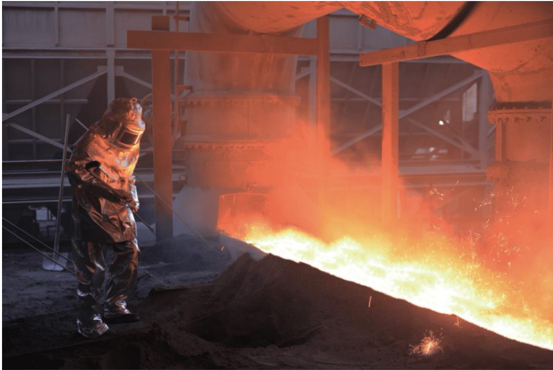
Slika 7. Aluminizirano odijelo [10]