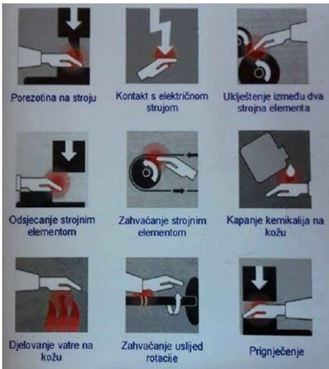
Slika 2. Opasna mjesta [8]

vrsta alata koji se koriste u obradi. Često se u metalnoj industriji koriste dizalice, poput mosnih dizalica, koje također mogu stvoriti opasnu zonu, čak i kada nisu u radnom procesu. Neosigurane kuke i užadi mogu dovesti do nekontroliranog kretanja pojedinih dijelova mosne dizalice, što povećava potencijalnu opasnost. Slika 2 prikazuje opasna mjesta [5,6,7,8].