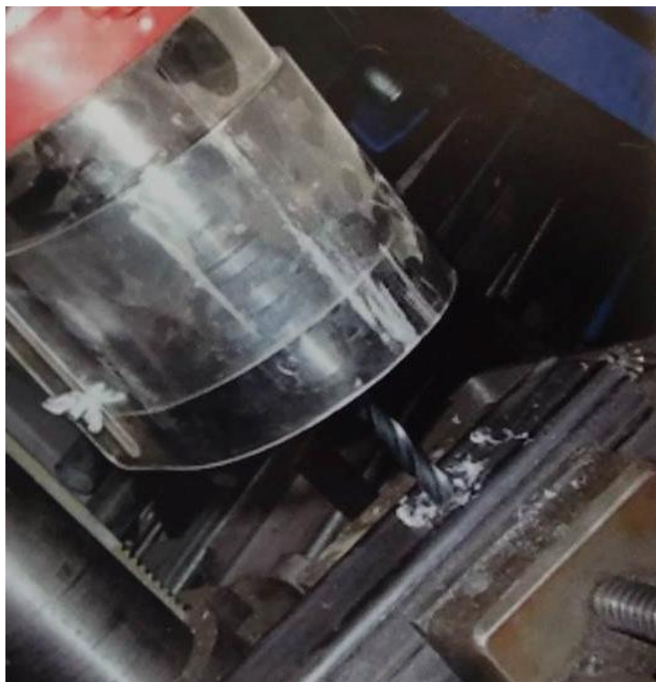
Slika 11. Zaštitni prsten od pleksiglasa oko rotirajućeg dijela bušilice [5]

Mehanički prijenosnici u pogonskom mehanizmu stroja moraju biti zagrađeni ili prekriveni kako radnik ne bi mogao dijelom tijela u opasnu zonu. Poželjno je da su svi poklopci izvedeni s kliznim vodilicama. Glavna opasnost pri radu s bušilicama, bez obzira na vrstu bušilice, proizlazi od same rotacije alata, zbog kojeg dolazi do zahvaćenja ruke, odjela i kose zaposlenika, što bi moglo izazvati njegove teže ozljede. Strugotine također mogu predstavljati opasnost za radnika ukoliko ih radnik rukama uklanja sa radnog stola, pri čemu može doći do ogrebotina, posjekotina dlanova ili prstiju, ili zbog letećih strugotina koje mogu ozlijediti oči i vid radnika. Mjesta opasnosti kod radioničkih bušilica prikazana su na slici 12 [5, 11, 12].