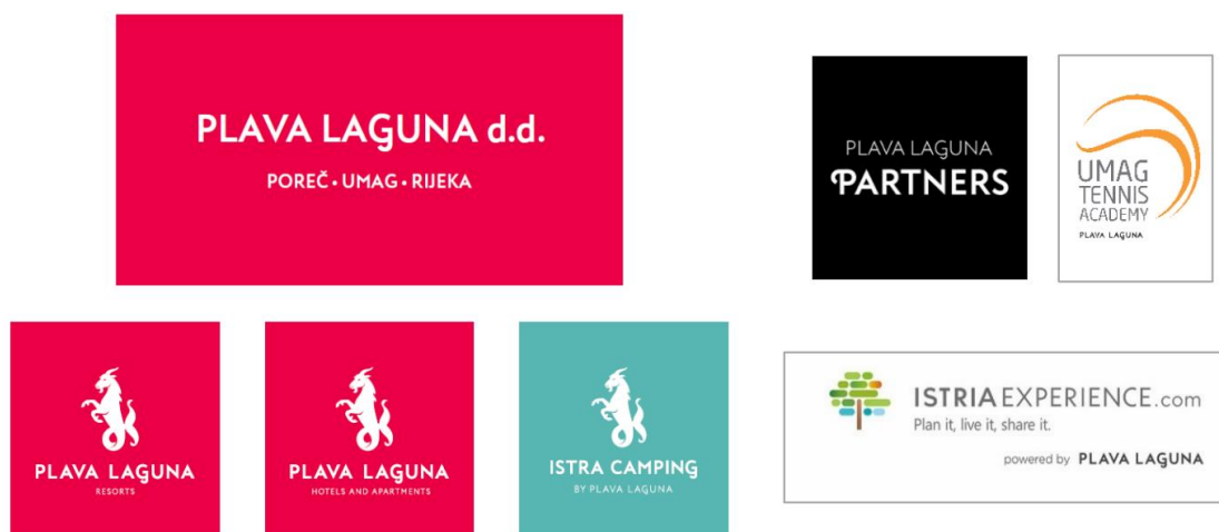
Slika 2. Brendovi Plave Lagune