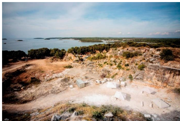
Slika 5. Kamenolom Montraker