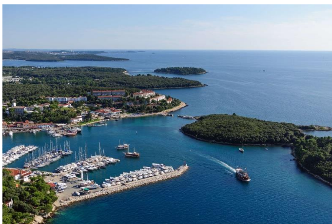
Slika 3. Otok Sveti Juraj