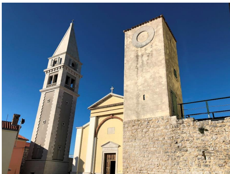
Slika 9. Vrsarski kaštel