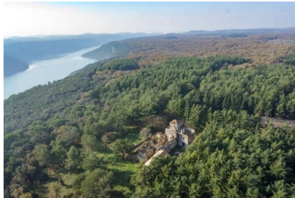
Slika 6. Šuma Kontija i gradina Mukaba