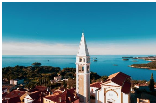
Slika 7. Vrsarski zvonik