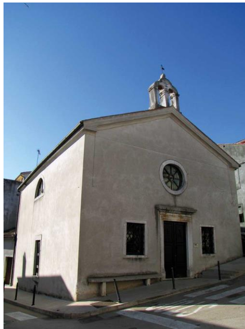
Slika 8. Crkva svete Foške