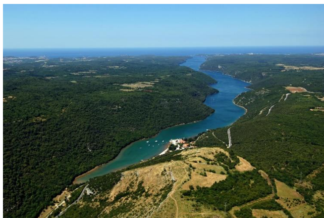
Slika 4. Limski zaljev