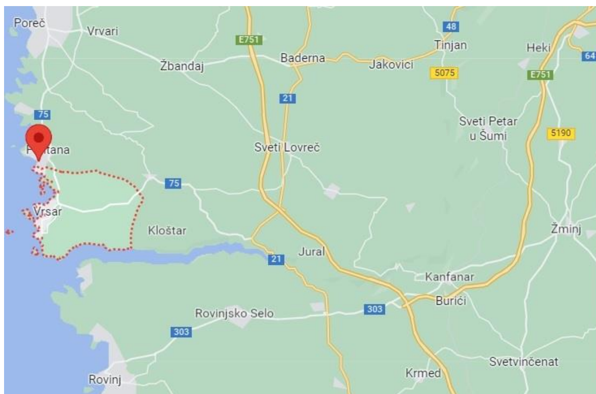
Slika 1. Geografski položaj Općine Vrsar