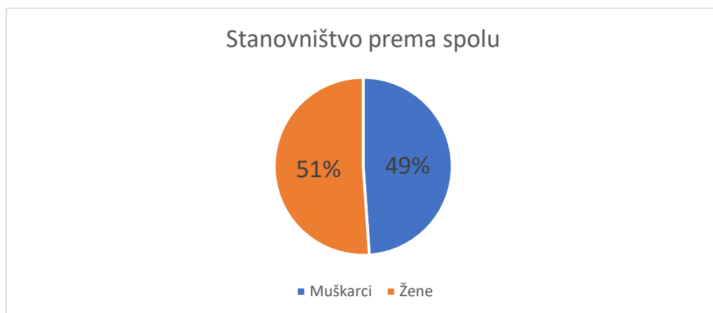
Grafikon 1. Stanovništvo Općine Vrsar prema spolu (2021.)