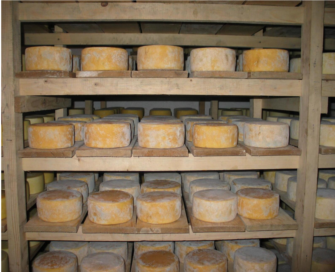
Slika 1. Prikaz površina pogodnih za stvaranje biofilma (Ivanić, 2019).