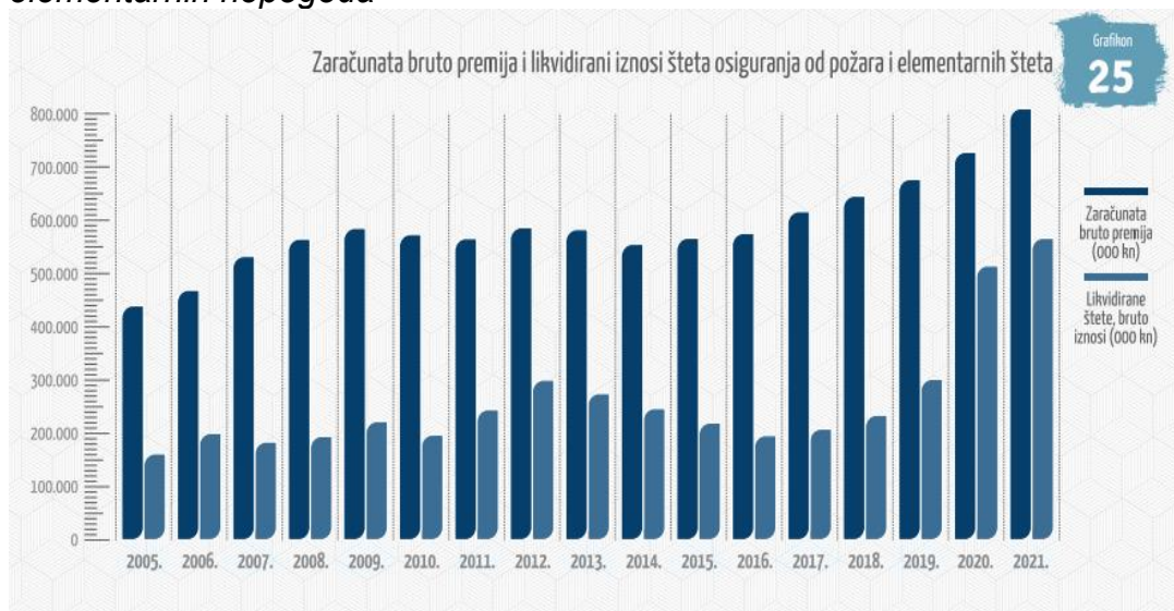
Grafikon 1: Zračunata bruto premija i likvidirani iznosi šteta osiguranja od požara i elementarnih nepogoda