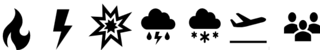
Slika 2: Prikaz osnovnih opasnosti