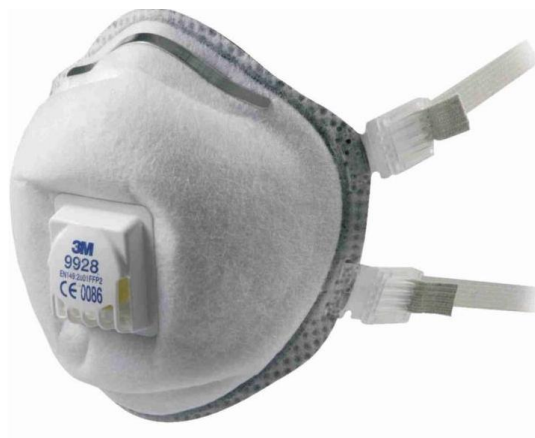
Slika 11. Filtarska polumaska[13]