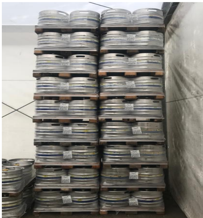
Slika 4. Gotova roba pakirana u bačve od 30 litara

od urušavanja vrijedi isto pravilo kao i za nosiljke. Roba se može skladištiti vani, no za vrijeme zime i niskih temperatura zbog mogućnosti od zaleđivanja obavezno se skladišti unutar skladišta te se drži u posebno kontroliranim uvjetima.