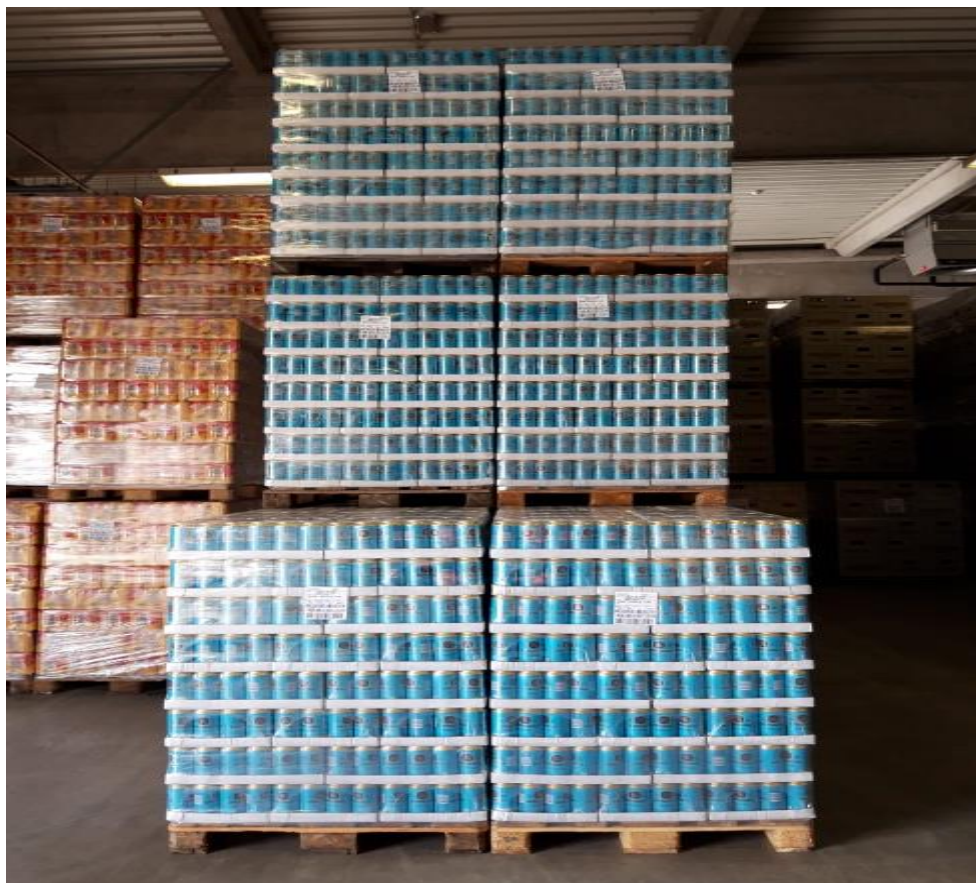
Slika 5. Gotova roba pakirana u limenke

Roba pakirana u Q pack dolazi iz punionice na euro paletama i slažu se na dvije palete u vis. Prilikom skladištenja palete i PET ambalaža moraju biti ispravne, bez oštećenja te ukoliko se mjesto skladištenja nalazi uz pješačku stazu zbog rizika od urušavanja vrijedi isto pravilo. Roba se uvijek skladišti unutar skladišta pod točno određenim uvjetima, specifično kod ovakve vrste robe je kako se izrazito mora paziti na količinu vlage u prostoriji, u protivnom će visoka vlaga uništiti karton između redova na paleti i roba će se jednostavno urušiti.