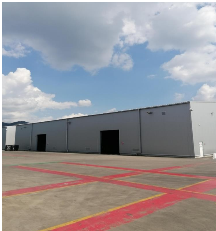
Slika 16. Skladišni objekt i transportni putevi