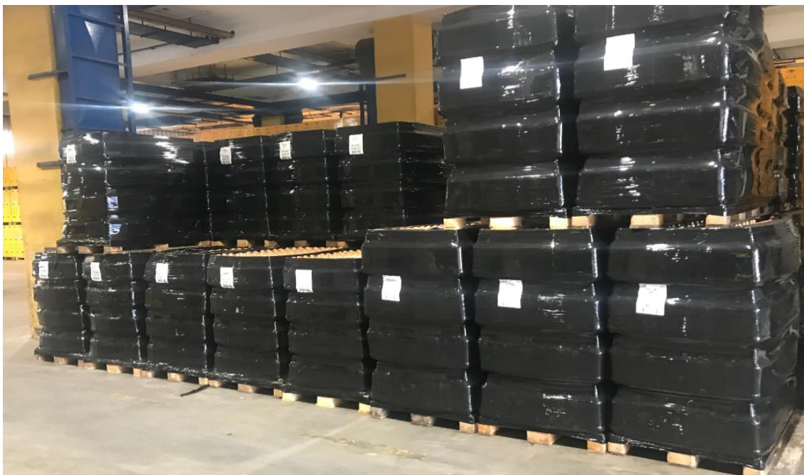
Slika 6. Gotova roba pakirana u Q pack

Roba pakirana u nepovratne boce dolazi iz punione na euro paletama i slažu se na način da na pod idu dvije palete a jedna na vrh po sredini. Prilikom skladištenja palete i nepovratne moraju biti ispravne, vrlo je lako uočljivo da ukoliko boca u kutiji pukne, na kutiji nastane mokra mrlja i time roba nije spremna za prodaju . Roba se uvijek skladišti unutar skladišta pod točno određenim uvjetima kako bi roba bez određenog oštećenja izašla iz skladišta.