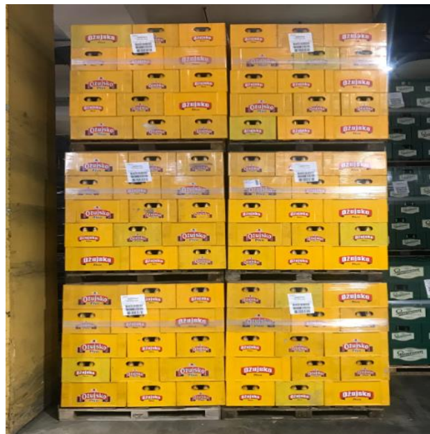
Slika 3. Roba pakirana u povratne nosiljke

Roba u povratnim nosilkama dolazi iz punionice na industrijskim paletama koje je potrebno skladištiti na tri palete u vis. Prilikom skladištenja palete i nosiljke moraju biti ispravne, bez oštećenja te ukoliko se mjesto skladištenja nalazi uz pješačku stazu zbog rizika od urušavanja potrebno je robu slagati u obliku piramide gdje prvi red uz stazu ide jedna paleta u vis, drugi red dvije te od trećeg reda idu normalno po tri palete u vis. Roba se uvijek skladišti unutar skladišta pod točno određenim uvjetima kako bi roba bez određenog oštećenja izašla iz skladišta.