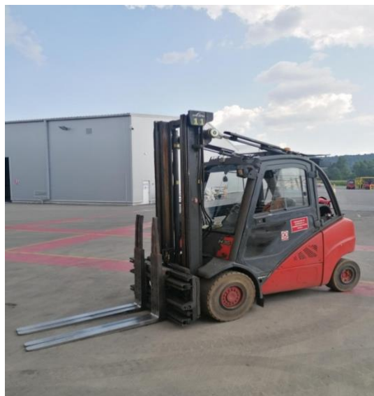
Slika 12. Stari model viličara