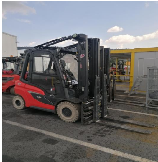
Slika 11. Novi model viličara

Transport na radnom mjestu predstavlja uporabu bilo kojeg vozila ili dijela pokretnih uređaja koji se koristi od strane poslodavca, zaposlenika ili posjetitelja u bilo kojem radnom okruženju (osim putovanja na javnim cestama), te pokriva vrlo širok spektar vozila , od automobila, kombija , kamiona i viličara do manje uobičajenih vozila u pogonima.