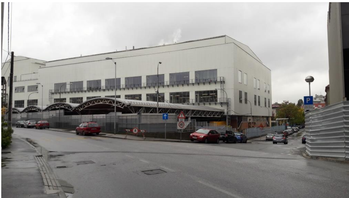
Slika 1. Prikaz tvornice u Ilici