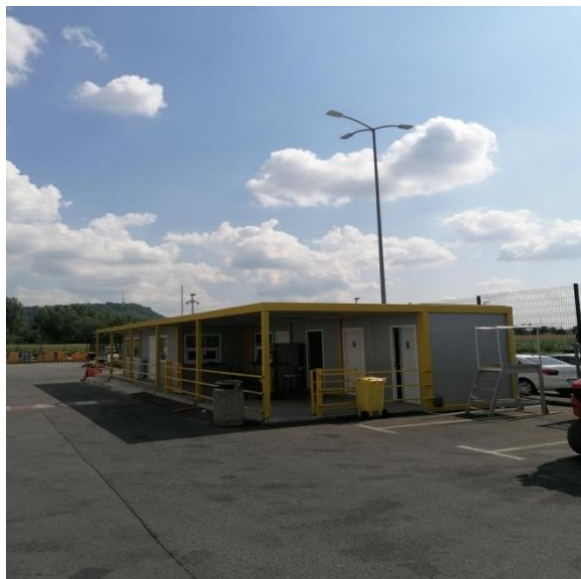
Slika 15. Ulazna porta

predviđenih za izvođače i određene građevinske lokacije. U primarne logističke pogone mogu nesmetano ući svi zaposlenici iz odjela logistike. [4]