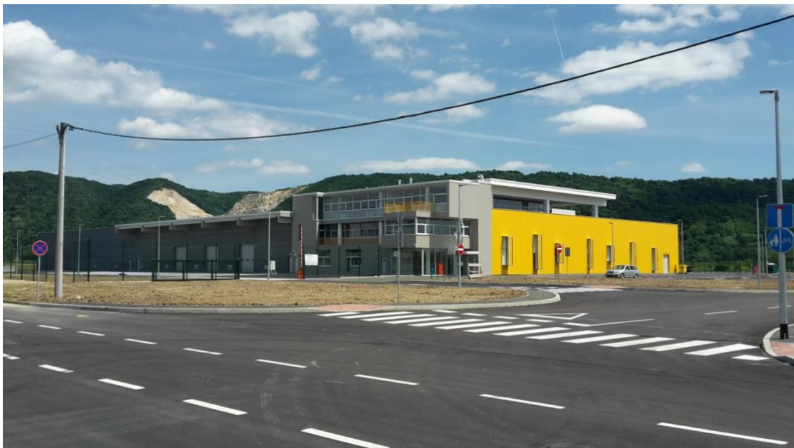
Slika 2. Prikaz LDC-a Zaprešić

Zaprešić šalje nazad ambalažu koja opet ovisi o potražnji punione, odnosno koji se proizvod taj dan, odnosno tjedan toči.