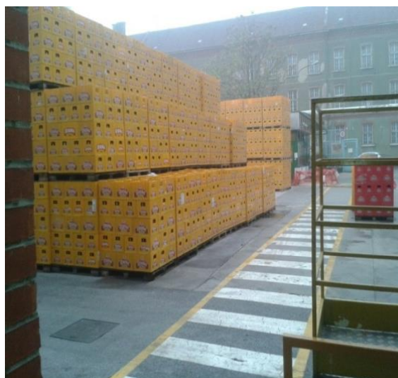
Slika 9. Slaganje pored pješačke zone

Pravila razmaka između proizvoda glasi kako se gotova roba skladišti 0,7 m od zida te se svakih 2 reda paleta ostavlja 25 cm razmaka.