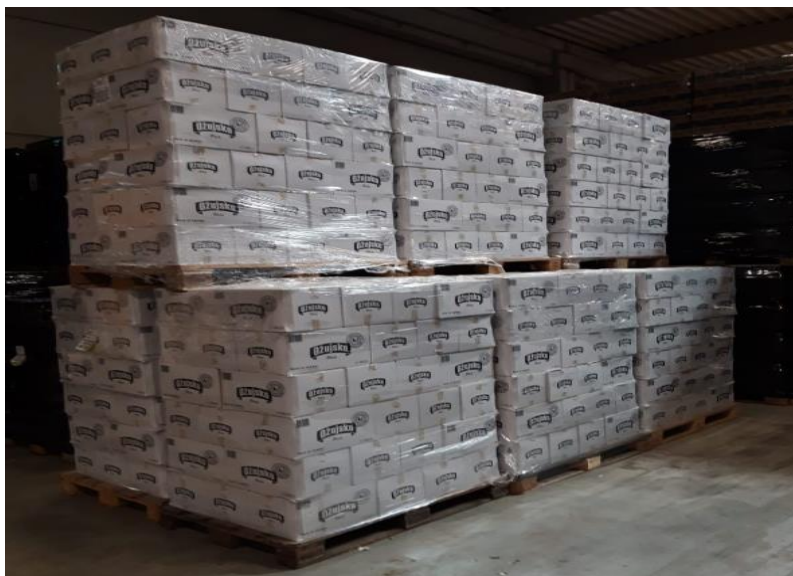
Slika 7. Roba pakirana u nepovratne boce

Ambalaža / nosiljke slaže se četiri palete u vis. Na području oko fermentora, ali i na svim područjima gdje postoji mogućnost pada ambalaže preko ograde slaže se po principu stepenica (1. red uz ogradu - 2 palete u vis, 2. red uz ogradu - 3 palete u vis, 3. red i svaki sljedeći - 4 palete u vis). Skladištenje pored pješačkih staza dozvoljeno je samo po principu stepenica