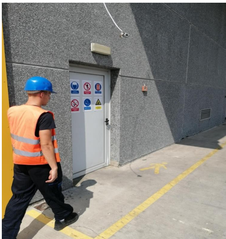
Slika 13. Pješačka staza

(ne izvan nje!) kada radi na stranici vozila. Tada viličar ne smije prići kamionu na utovar sa niti jedne strane. Pješaci moraju, kada god je to moguće, biti odvojeni od prometnica i radnog područja vozila odvajanje pješaka i vozila obavlja se zaštitnim ogradama (prioritetno), te označavanjem i iscrtavanjem korištenje reflektirajućeg prsluka (ili visoko vidljiva odjeća) je obavezno na svim logističkim površinama gdje je te u cijelom krugu kako je naznačeno u Internoj organizaciji prometa, pješaci se moraju kretati označenim pješačkim stazama koje moraju uvijek moraju biti prohodne i osigurane od padajućih predmeta kada se nalaze u blizini mjesta skladištenja, obavezno je nošenje zaštitnih kaciga svugdje gdje se pješak nalazi u blizini – unutar 2 metra robe ili tereta višeg od 2 metra (od poda). Pješacima se mora osigurati siguran ulaz za pješake u skladišta, odvojen od prometnih puteva i ulaza za vozila. Preporuka je implementirati skeniranje gotove robe izravno iz viličara ili kao alternativa sa mjesta koje je potpuno odvojeno. Nije dopušteno kretanje operatera (pješaka) koji obavlja ručno skeniranje u zoni gdje se vrši utovar kamiona. [2]