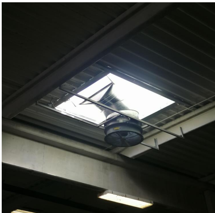
Slika 18. Primjer ventilacijskog sustava

Filteri u ventilacijskom sustavu trebaju redovito održavati kako bi se osigurala njihova učinkovitost. Nečisti ili zapušeni filteri mogu smanjiti protok zraka i smanjiti sposobnost sustava da uklanja štetne tvari. Redovito čišćenje i zamjena filtera su ključne kako bi se osiguralo kvalitetno filtriranje zraka.