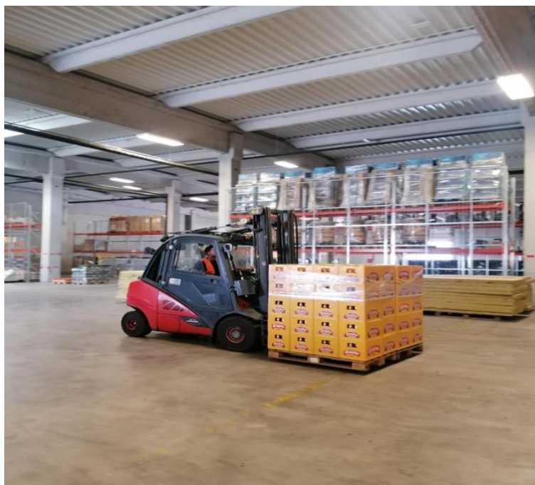
Slika 14. Viličar u radnom okruženju

uputa za kontrolu viličara moraju biti dostupni u viličaru kako bi se omogućilo svakom vozaču viličara da provjeri da li je viličar u dobrom radnom stanju i da li je pravilno održavan prije nego što se počne raditi sa njim. Kontrola viličara putem kontrolne liste obavlja vozač viličara prije svake smjene (prije korištenja, ukoliko se ne koristi svaku smjenu). Nalazi kontrole, u pisanom obliku, se predaju supervizoru koji ima dužnost utvrditi da li je viličar siguran za korištenje odnosno pokrenuti akcije za otklanjanje utvrđenih nedostataka. Minimum zahtjeva za viličare bio bi dijagram opterećenja, retrovizori, siguran način ulaska i izlaska iz viličara, zvučni i vizualni alarm za vožnju unazad, truba, kočnice i ručna kočnica, zaštita iznad glave, pojasevi, odgovarajuće svjetlo (prednje i zadnje), plavo svjetlo za vožnju unazad, sustav detekcije pješaka na svim plinskim viličarima (samo za lokaciju Ilica), kabina koja na prikladan način osigurava zaštitu od loših vremenskih uvjeta, prekidač prisutstva vozača koji osigurava da se ne može uključiti vozilo ključem ukoliko se ne sjedne na sjedalo, žute oznake na jarbolu viličara gdje teret iznad žute oznake se mora voziti unazad. Svi novi viličari, koji se nabavljaju moraju biti na električni pogon ili na plinske boce. [2]