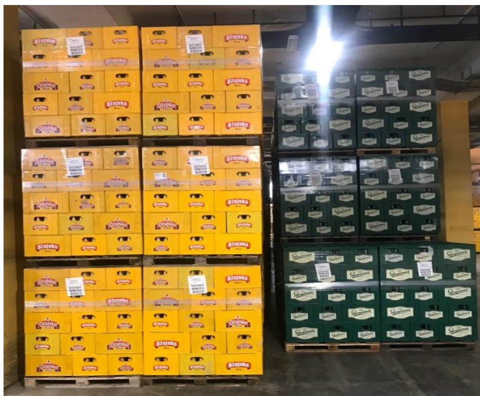
Slika 10. Razmak između paleta

Pravila razmaka između proizvoda glasi kako se gotova roba skladišti 0,7 m od zida te se svakih 2 reda paleta ostavlja 25 cm razmaka.