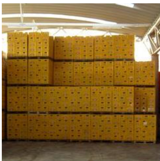
Slika 8. Slaganje ambalaže na 4 u vis

Ambalaža / nosiljke slaže se četiri palete u vis. Na području oko fermentora, ali i na svim područjima gdje postoji mogućnost pada ambalaže preko ograde slaže se po principu stepenica (1. red uz ogradu - 2 palete u vis, 2. red uz ogradu - 3 palete u vis, 3. red i svaki sljedeći - 4 palete u vis). Skladištenje pored pješačkih staza dozvoljeno je samo po principu stepenica