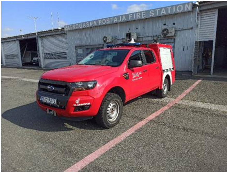
Slika 10. ODRA 1 - Ford Ranger sa vatrogasnom nadogradnjom

Spasilačko vatrogasna služba MZLZ posjeduje ukupno 39000 l vode i 4500 l pjenila sa kapacitetom pražnjenja od 26000 l/min što znači da operator zračne luke može osigurati najvišu spasilačko-vatrogasnu kategoriju aerodroma 10.