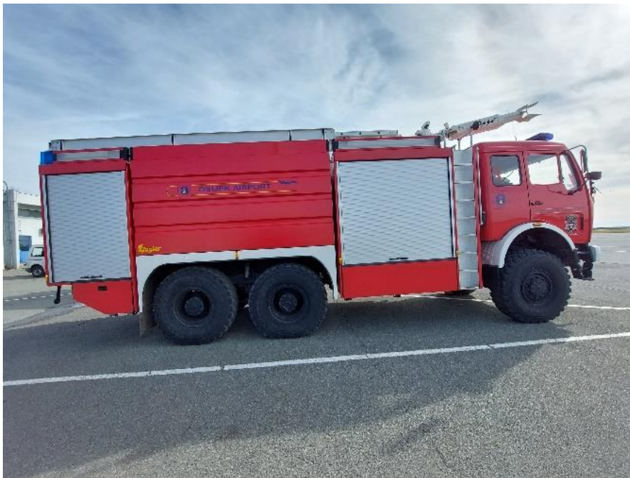
Slika 13. Mercedes FLF60/90-10

Od opreme vozilo posjeduje hidraulički alat za rezanje i razupiranje, pneumatske jastuke za podizanje, cijevi i armature za gašenje, bušilicu, kutnu brusilicu, motorna pila, škare za žicu, poluga, sjekira, lopata, čaklja, čekić, ljestve rastegače, ljestve prislanjače, termo kamera, dimovuk, čelično užo za vuču, mehaničarski alat u kutiji, izolacijski aparati sa pripadajućim rezervnim bocama, sklopiva nosila, torba za imobilizaciju, odijela za prilaz vatri i druga oprema određena pravilnikom o spasilačko-vatrogasnoj službi na aerodromu.[13]