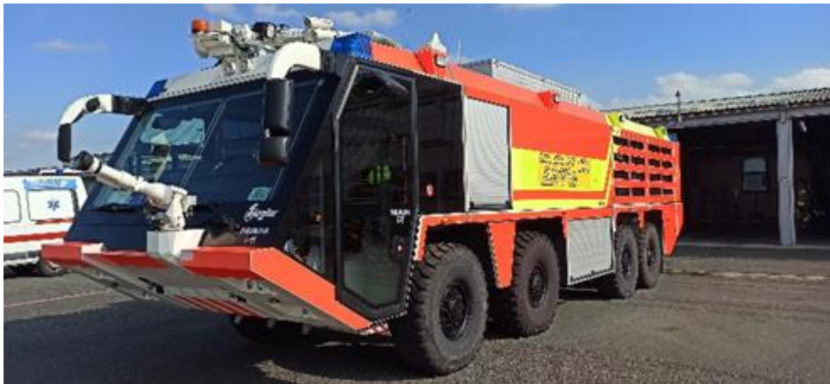
Slika 7. ODRA 5 - Ziegler FLF100/240-13+250PZ8

Od opreme vozilo posjeduje jedno visokotlačno vitlo dužine 30 m i jedno srednjetačno vitlo dužine 80 m, električni hidraulički alat za rezanje i razupiranje sa pripadajućim baterijama, izolacijske aparate sa pripadajućim rezervnim bocama, cijevi i armature za gašenje, prvu pomoć, nosila, ljestve, ventilator, kutiju sa alatom sa raznim ključevima, gedorama i drugu opremu određenu Pravilnikom o spasilačko-vatrogasnoj zaštiti na aerodromu.[13]