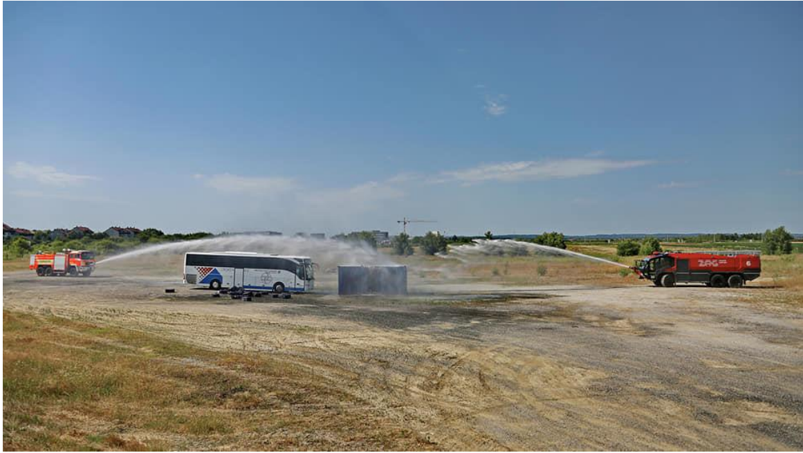
Slika 16. Simulacija mjesta nesreće