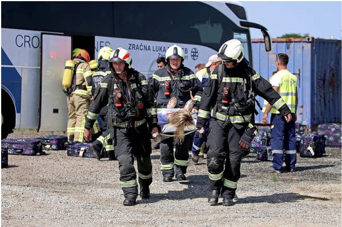
Slika 17. Spašavanje putnika iz trupa zrakoplova

Iz gore navedenog može se zaključiti da zrakoplovna nesreća predstavlja masovnu nesreću i kao takva zahtjeva podizanje većeg broja žurnih službi, kako broj vozila, tako i broj ljudi.