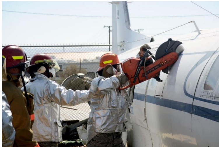
Slika 3. Korištenje rezača sa vlastitim pogonom

Oprema za pružanje prve pomoći: kutija sa prvom pomoći, automatski vanjski defibrilator, sanitetska sklopiva nosila, sanitetska deka za izvlačenje povrijeđenih osoba i oprema sa kisikom za oživljavanje. Razna oprema pod koju se razumijeva klinovi i podupirači različitih veličina, cerada, termalna kamera i eksploziometar.[14]