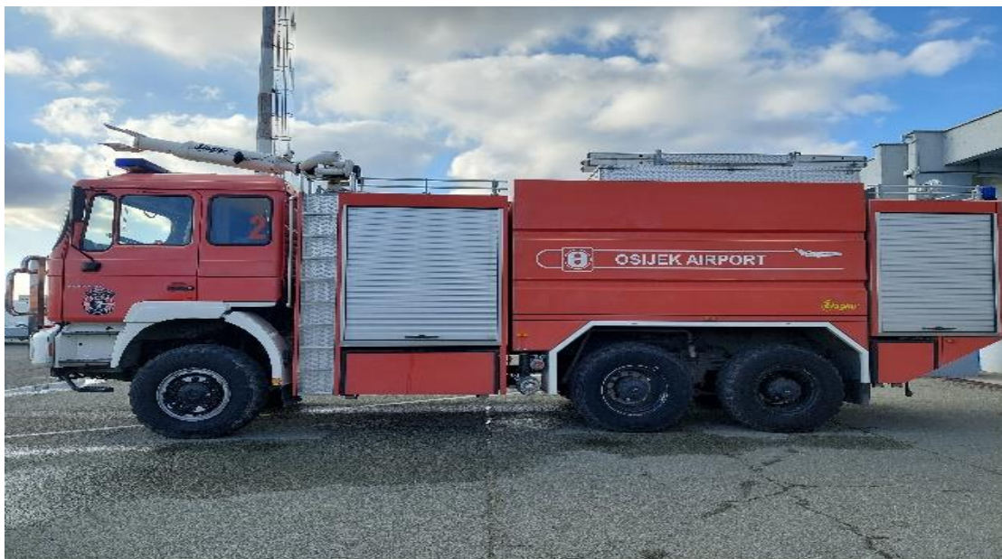
Slika 14. MAN FLF 60/90-11+250P

Od opreme vozilo posjeduje hidraulički alat za rezanje i razupiranje, cijevi i armature za gašenje, bušilicu, kutnu brusilicu, motornu brusilicu sa pripadajućim brusnim pločama za beton i željezo, mehaničarski alat u kutiji, poluga, sjekira, čaklja, štihljača, ljestve sastavljače, ljestve rastegače, izolacijske aparate, aparate za početno gašenje požara, nosila, prva pomoć i druga oprema određena Pravilnikom o spasilačko-vatrogasnoj službi na aerodromu.[13]