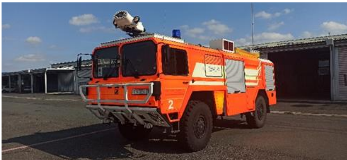
Slika 9. ODRA 2 - MAN D 2840 LF/550