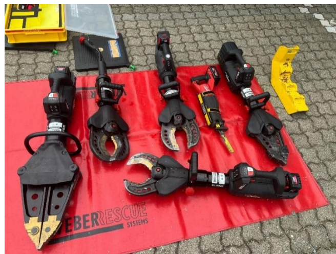
Slika 4. Weber akumulatorski hidraulički alat

Oprema koja se koristi u spasilačko-vatrogasnoj službi je ista koju koriste Javne vatrogasne postrojbe, Dobrovoljna vatrogasna društva i druge postrojbe određene Člankom 30. Zakona o vatrogastvu (NN 125/19, 114/22).[9] Jedina razlika su vozila zato što vozila spasilačko-vatrogasne službe moraju biti prilagođena kretanju po nepristupačnim terenima sa velikom količinom sredstava za gašenje i opreme za spašavanje.