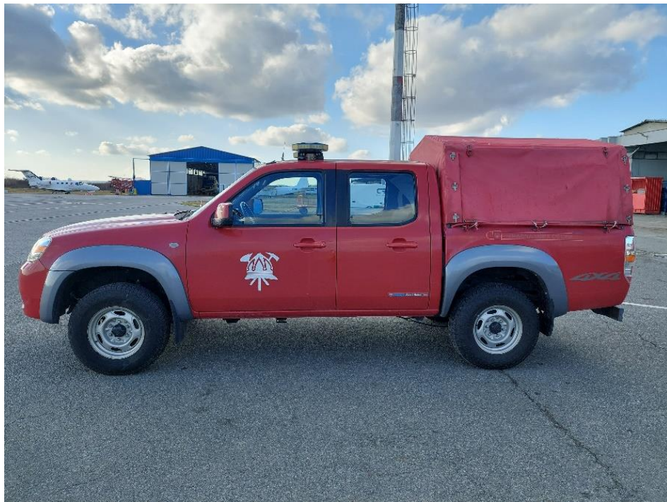
Slika 12. Zapovjedno vozilo Mazda BT-50

Od opreme vozilo posjeduje sklopiva nosila, dimovuk, detektor plinova, izolacijske aparate i pripadajuće rezervne boce izolacijskih aparata te radio stanicu.