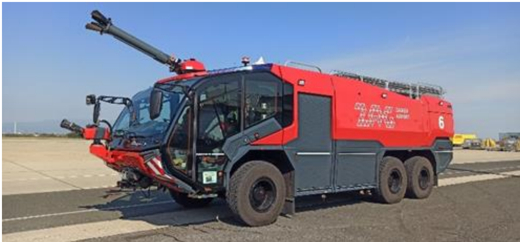
Slika 6. ODRA 6 - Rosenbauer R600 N2

Od opreme, vozilo posjeduje baterijski hidraulički alat za rezanje i razupiranje proizvođača LUKAS, cijevi i armature potrebne za gašenje, bušilica i kutna brusilica, kutiju sa sitnim alatom, jedno visokotlačno vitlo i jedno srednjetačno vitlo, izolacijski aparati sa rezervnim bocama za IA, ljestve i ostalu opremu koja je određena Pravilnikom o spasilačko-vatrogasnoj zaštiti na aerodromu.[13]