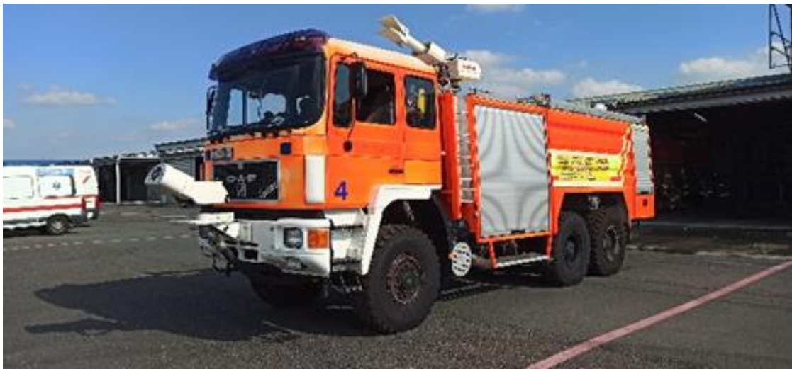
Slika 8. ODRA 4 - Rosenbauer R 600 N2

Od opreme posjeduje jedno vitlo za brzu navalu dužine 40 m, cijevi i armature za gašenje, sjekire, škare za željezo i škare za kablove, izolacijske aparate, užad, razni sitni alat kao što su kliješta, ključevi, čekić, prvu pomoć, motornu pilu i drugi alat određen Pravilnikom o spasilačko-vatrogasnoj zaštiti na aerodromu.[13]