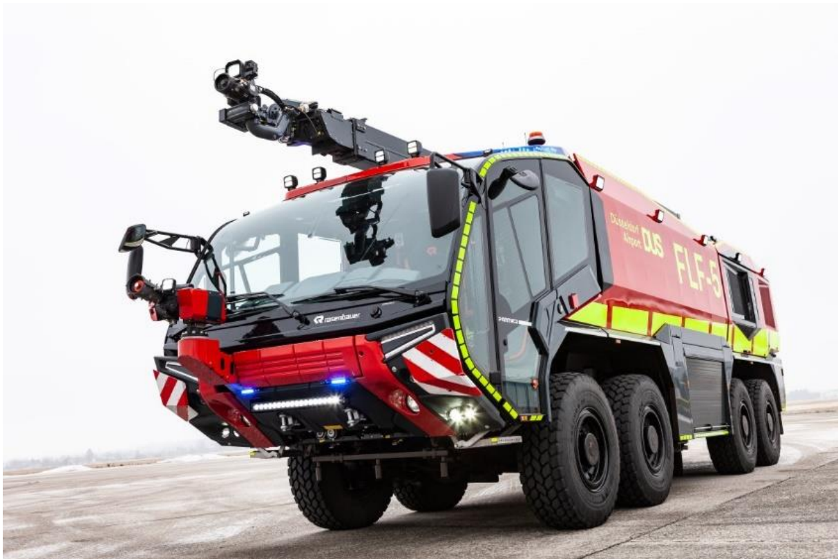
Slika 2. Rosenbauer Panther 8x8, 12500l vode/1500l pjenila/250kg praha

Na slici 2. prikazano je vozilo kapaciteta iznad 4500 l zapremnine vode proizvođača vatrogasnih vozila Rosenbauer, a koje je u spasilačko-vatrogasnoj službi zračne luke Duesseldorf u Njemačkoj. Vozilo ima pogon na svih osam kotača, spremnik vode 12500 l, 1500 l pjenila i spremnik praha za gašenje od 250 kg.[16]