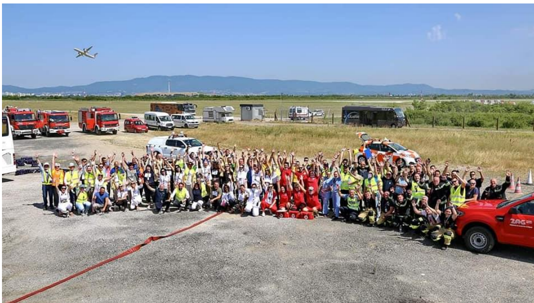
Slika 15. Sudionici vatrogasne vježbe na MZLZ

Na slici 15. prikazani su sudionici vatrogasne vježbe na Međunarodnoj zračnoj luci Zagreb iz 2021. godine.[25]