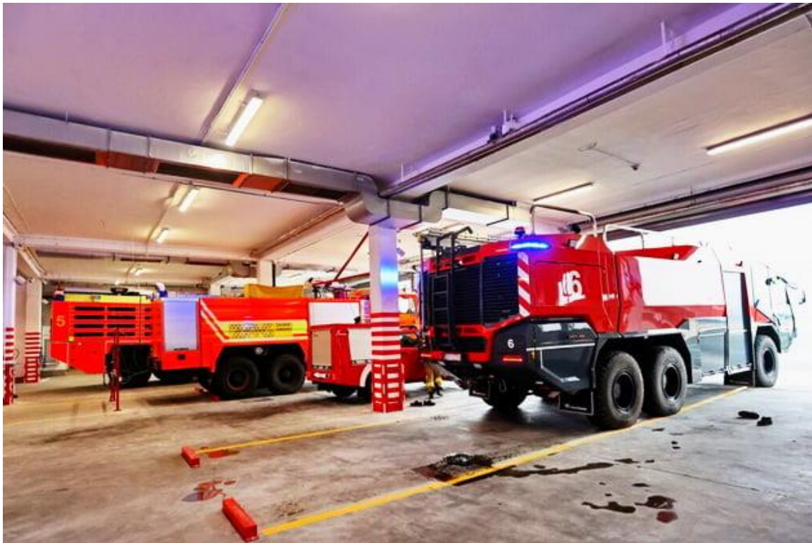
Slika 5. Vozila Spasilačko-vatrogasne službe Međunarodne zračne luke Zagreb

Međunarodna zračna luka Zagreb organizirala je vlastitu Spasilačko-vatrogasnu službu sukladno Zakonu o zračnom prometu[14], a po Pravilniku spasilačko-vatrogasne službe[13]. Prema zborniku zrakoplovnih informacija [19] Spasilačko-vatrogasna služba MZLZ pripada u devetu kategoriju što znači da na zračnu luku mogu slijetati zrakoplovi dužine 61-76 m (ne uključujući 76 m) i do 7 m široki trup zrakoplova. Upravo toj kategoriji odgovara zrakoplov Airbus A350-900 čija je dužina 66,8 m i širina trupa 5,96 m. Na slici 5. se nalaze vozila i garaža spasilačko-vatrogasne službe Međunarodne zračne luke Zagreb.[20]