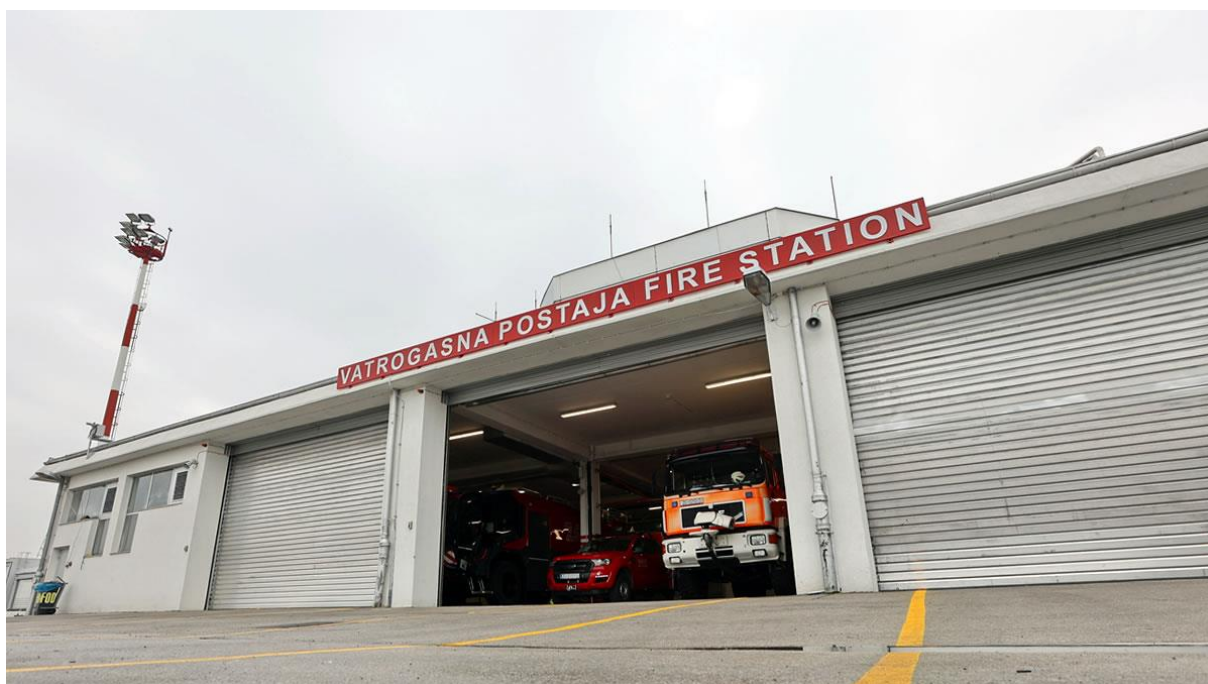
Slika 1. Spasilačko-vatrogasna služba, Vatrogasna postaja Međunarodne zračne luke Zagreb

Operator zračne luke dužan organizirati spasilačko-vatrogasnu službu, ali daje mu mogućnost da osim vlastite spasilačko-vatrogasne službe može imati djelom vlastitu i djelom druge organizacije i u cijelosti druge organizacije pod uvjetom da su zaposlenici druge organizacije osposobljeni za poslove spasilačko-vatrogasne službe.[14]