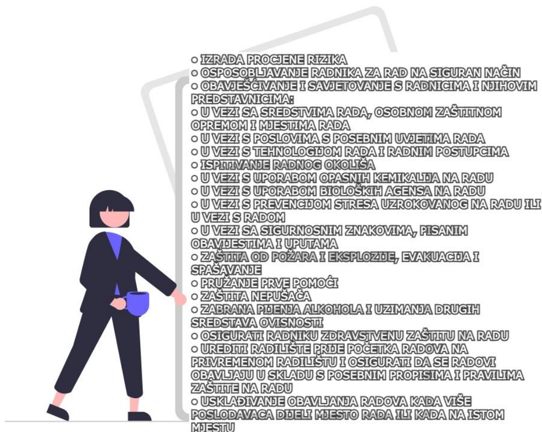
Slika 9. Osnovne obveze poslodavca u vezi sa zaštitom na radu

Poslodavac je obavezan organizirati i provoditi zaštitu na radu te se savjetovati s radnicima, odnosno njihovim predstavnicima – ovlaštenicima zaštite na radu o pitanjima zaštite na radu. Poslodavac mora osigurati da sva dokumentacija za organizaciju i provođenje zaštite na radu vezana za rizike na mjestu rada i u vezi s radom bude razumljiva i dostupna stranom radniku.