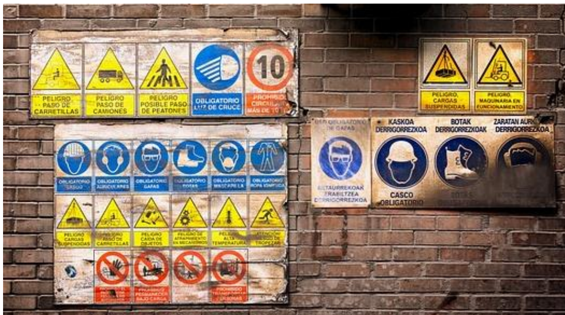
Slika 12. Znakovi opasnosti na jeziku razumljivom stranom radniku [23]

Poslodavac je obvezan radniku osigurati dostupnost: