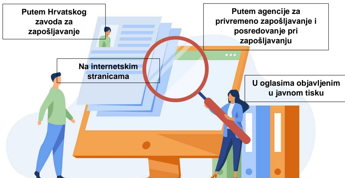
Slika 4. Načini pronalaska posla [1]

Strani radnici u RH mogu tražiti posao na više načina: (Slika 4.)