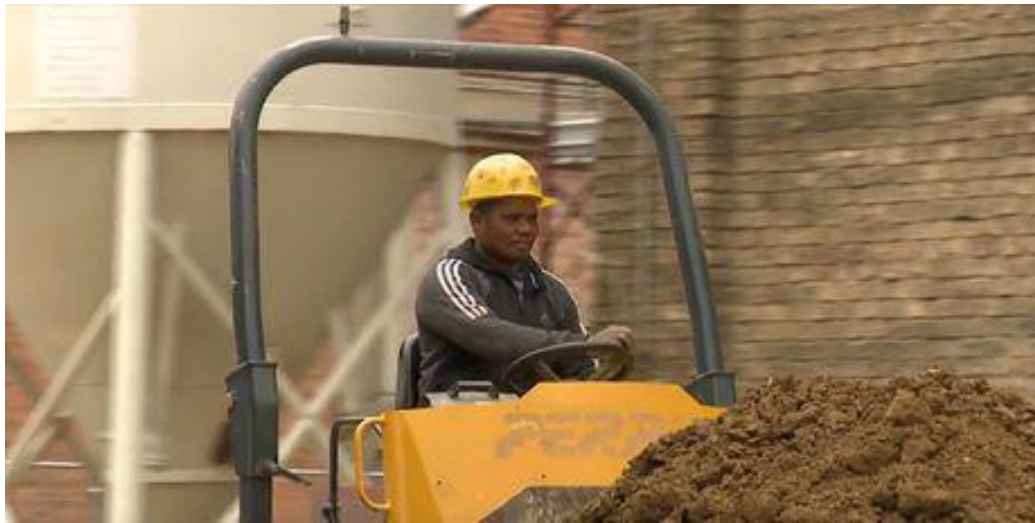
Slika 8. Strani radnik za radnim strojem [24]

dozvola za upravljanje radnim strojevima koji su svrstani u G kategoriju vozila za rukovatelja radnim strojem i dr. (Slika 8.)[22]