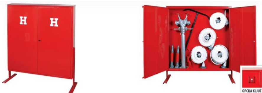
Slika 12. Hidrantski ormari za podzemni hidrant [13]