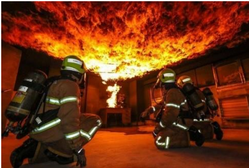
Slika 7. Flashover [11]

Flashover je istovremeno paljenje većine izravno izloženog zapaljivog materijala u zatvorenom prostora (slika 7.). Događa se kada se većina izloženih površina u prostoriji zagrije do temperature samozapaljenja i emitira zapaljive plinove. Flashover se obično događa na 500 °C ili 590 °C za obične zapaljive tvari i upadnom toplinskom toku u razini poda od 20 kilovata po kvadratnom metru (2,5 hp/sq ft).