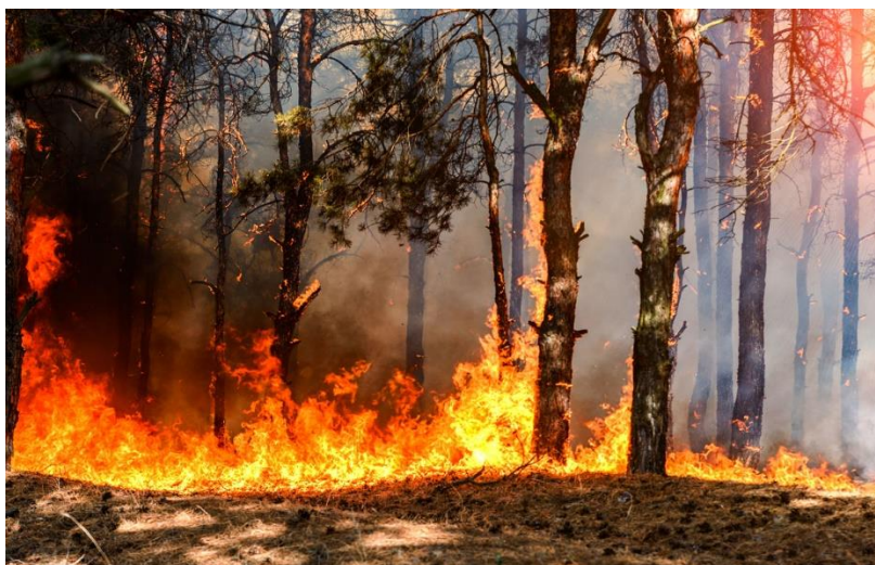
Slika 4. Vanjski požar [9]