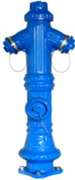
Slika 13. Nadzemni hidrant [15]