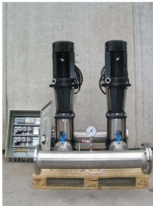
Slika 16. Hidrostanice [16]

Glavna svrha hidrostanice je opskrbljivanje dovoljnog protoka vode i pritiska za efikasno gašenje požara. Kada dođe do požara, hidrostanica pokreće pumpe koje crpe vodu iz rezervoara ili iz javnog vodovoda i pumpaju je kroz hidrantsku mrežu ili sprinkler sistem. Ovo omogućava brzo snabdjevanje vodom za gašenje požara u slučaju hitnosti. Hidrostanice mogu biti projektirane za različite namjene i kapacitete, u zavisnosti od potreba objekta ili postrojenja. Veći objekti ili industrijski kompleksi često imaju više hidrostanica postavljenih na strategijskim mjestima kako bi se osigurao adekvatan protok vode i pritisak u cijelom sistemu. Pored gašenja požara, hidrostanice također mogu služiti za vodovodnu distribuciju u objektima gdje je potrebno osigurati konstantan pritisak vode za različite svrhe, kao što su rashladni sistemi ili industrijske operacije. Ključni su dio sistema zaštite od požara.