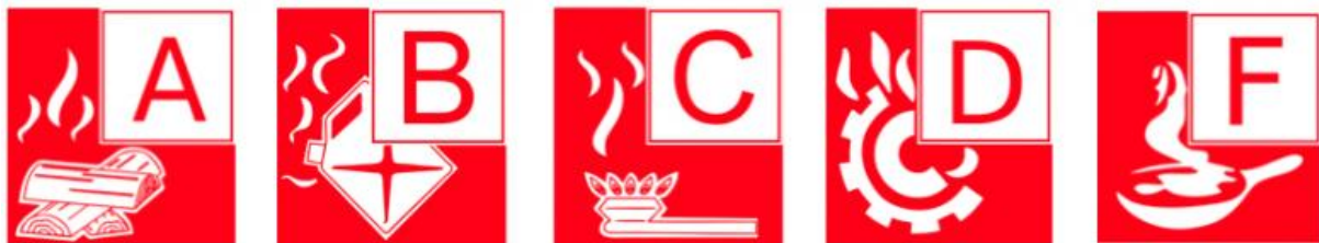
Slika 5. Klase požara [10]

Klasa F: Požari koji uključuju ulja i masti koje se koriste u kuhinjama i komercijalnim kuhinjskim aparatima.