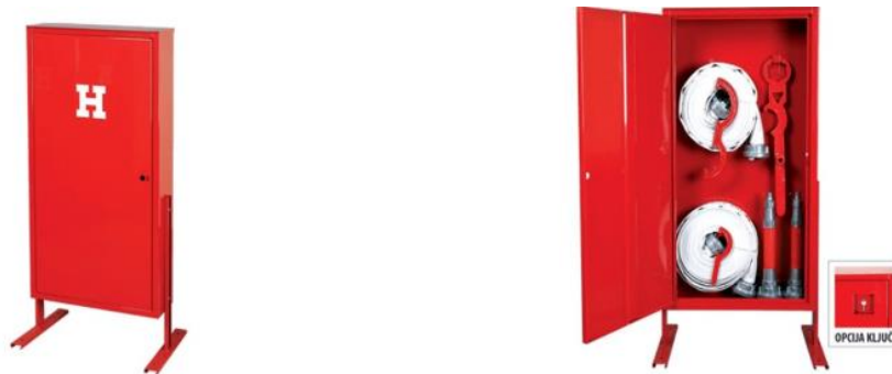
Slika 11. Hidrantski ormari za nadzemni hidrant [13]