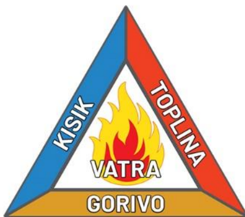
Slika 2. Trokut gorenja [8]

Tri modela koja su potrebna za gorenje, točnije kako bi požar nastao je tzv. Trokut gorenje (slika 2.), a u to spada kisik, toplina te goriva tvar. Ukoliko jednu od komponenti isključimo (toplinu; primjerice ohlađivanjem, ili kisik padne ispod 15%) sam požar u pravilu prestaje, ali s obzirom da se požar brzo i nekontrolirano širi po prostoriju, ako ne krenemo s metodama gašenja u što kraćem roku te nismo u mogućnosti pristupiti samom gašenju požara jer bi ugrozili sebe ili druge, slijedi evakuacija. Evakuacija je brzo, organizirano i kontrolirano premještanje ugroženih osoba. Prilikom evakuacija, okuplja se na zbornom mjestu gdje se zatim prebrojavaju članovi te jesu li svi evakuirani. U slučaju da nisu, pri dolasku vatrogasa potrebno im je to naglasiti. Najbitnija dužnost vatrogasaca je spašavanje ljudi iz građevina ugroženih požarom. Vatrogasci prvobitno spašavaju ljude koji se nisu uspjeli evakuirati, a tek onda kreću u gašenje samog požara. Uvijek je bitno očekivati pojava otrovnih para i plinova ili urušavanje građevina, propadanje ljudi kroz nastale otvore, nestanak struje.