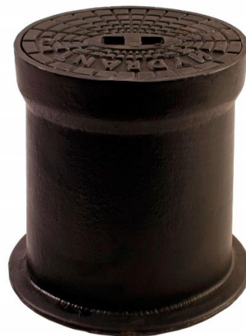
Slika 14. Podzemni hidrant [8]

Konačan izbor između bazena i gradske vodovodne mreže ovisi o različitim čimbenicima, uključujući veličinu požara, dostupnost resursa, geografsku lokaciju i lokalne propise. U mnogim slučajevima, gradske vodovodne mreže su prvi i brzi izbor za gašenje požara, dok se bazeni često koriste kao dodatni izvor vode za veće ili složenije situacije. Ova povezanost između gradske vodovodne mreže, bazena i hidrantske mreže osigurava različite izvore vode