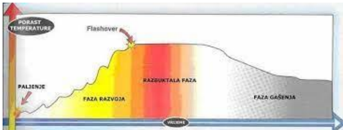
Slika 6. Faze razvoja požara [8]

Početna faza je slab intenzitet izgaranja te se vatra širi vrlo sporo. Na brzinu širenja požara bitno utječe i toplina, koja proporcionalno raste te zagrijava ozrak. Naglo povećanje temperature i količine topline u prostoru su obilježja faze razvoja. Plamen zahvaća sve više gorive tvari gdje dolazi do pucanja staklenih površina. Temperatura nije dospjela do najviše vrijednosti, ali su moguće eksplozije posuda pod tlakom. Temperatura raste gdje dolazi do razbuktale faze. Zatim imamo razbuktalu fazu koja se ističe po najvećem intenzitetu izgaranja, najvišoj temperaturi i brzini širenja požara. Dolazi i do urušavanje cijele građevine. Temperature doseže vrijednosti od 650°C pa sve do 1000°C, a gorenje je jače ukoliko uđe veća količina kisika. Vrlo je bitno da ne otvaramo prozore i vrata jer ulaskom velike količine zraka u prostoriju dolazi do flashovera. Posljednja faza požara je gašenje, smanjenjem količina gorivog materijala te s time počne padati temperatura požara. Bitno je znati koje je najefikasnije sredstvo za gašenje požara ovisno o klasi požara. Primjerice voda za klasu A, pjena i prah za klasu B. Gašenje je završeno kada se ohlade sva tinjajuća žarišta. Uvijek je potrebno provjeriti zapaljeno područje prije ulaska ljudi u prostor.