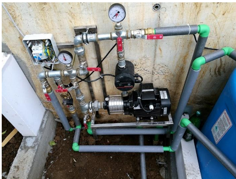
Slika 15. Uređaj za povišenje tlaka [8]

Prostorija u kojoj je smješten uređaj za povišenje tlaka (slika 15.) mora biti izgrađena kao zaseban požarni sektor s građevinskim elementima, koji dijeli tu prostoriju od ostalog djela građevine koji mora biti otporan na požar najmanje onoliko vremena koliko je najkraće predviđeno vrijeme rada hidrantske mreže.