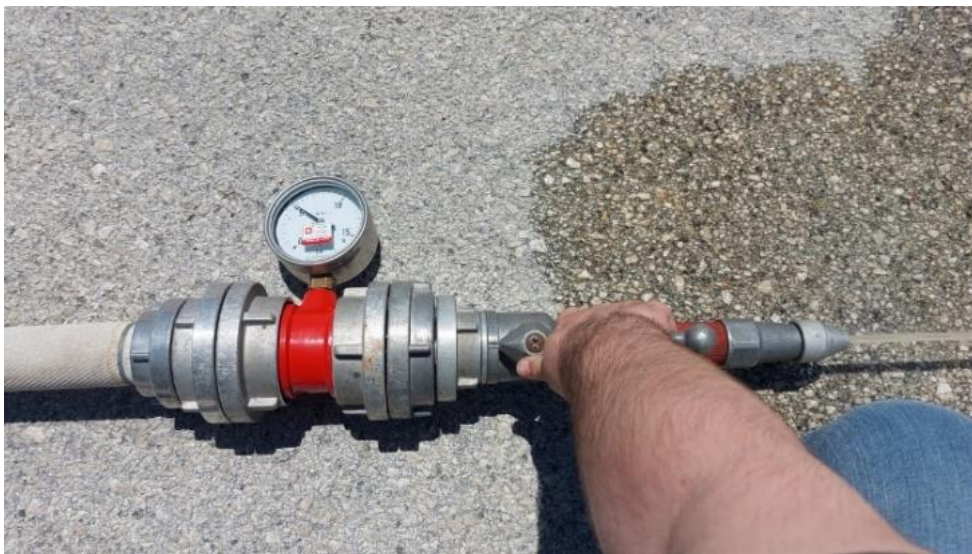
Slika 17. Ispitivanje hidrantske mreže(QH-linija) [8]

Sustavima za gašenje požara upoznala sam se kroz posao na kojem trenutno radim. Što se tiče ispitivanja hidrantske mreže potrebno je da se prije početka ispitivanja pregledava se projektna dokumentacija s čime se uspoređuje projekt sa izvedenim stanjem, pregledavaju se atesti ugrađene opreme, atest o obavljenoj tlačnoj probi hidrantske mreže. Prije početka ispitivanja se provjerava da su svi hidranti uzmeljeni (da postoji izjednačenje metalnih masa), da su pravilno označeni i da su dostupni. Prilikom ispitivanja jedan ispitivač ide na najviši kat zgrade i pušta vodu iz hidranta koji se nalazio u tome hodniku na čije crijevo se spaja manometer kako bi izmjerio statički i dinamički tlak na tome hidrantu. Za to vrijeme drugi ispitivač pušta ostale hidrante u objektu kako bi provjerili pad tlaka na ispitanom hidrantu (slika 17.), i tako smo radili za sve hidrante u zgradi. Prilikom ispitivanja hidranta smo provjeravali je li gdje dolazi do curenja vode (na ventilu, crijevima). Zbog slaboga tlaka u gradskoj vodovodnoj mreži za hidrantsku mrežu zgrade je postavljen sustav za podizanje tlaka koji je tijekom ispitivanja pravilno radio.