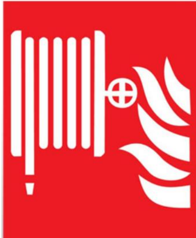
Slika 9. Oznaka za hidrantsku mrežu [8]

Oznaka za hidrantsku mrežu (slika 9.) je vizualna ili pisana identifikacija koja označava lokaciju hidrantskih priključaka, protupožarnih ventila i drugih komponenata hidrantskog sustava. Oznaka za hidrantsku mrežu u Republici Hrvatskoj označava se crvenom bojom. Ovakve oznake često sadrže informacije koje pomažu vatrogascima, hitnim službama i drugim relevantnim osobama da brzo i precizno pronađu izvore vode za gašenje požara u slučaju hitnih situacija. Vrlo je bitna vatrogascima kako bi se spriječio gubitak vremena te tako spriječila materijalna šteta. Ima ključnu ulogu u efikasnom reagiranju na požare i hitne situacije te pomaže zaštititi živote ljudi, imovinu i okoliš.