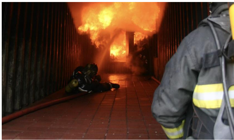
Slika 3. Unutarnji požar [9]