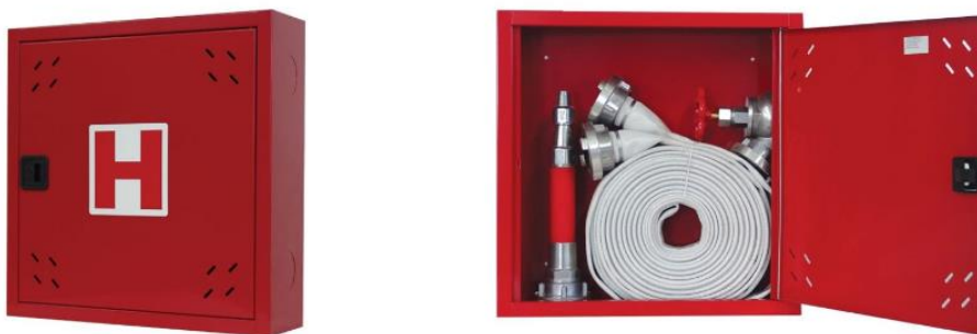
Slika 10. Zidni hidrantski ormarić [13]