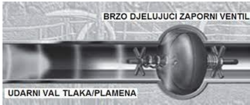
Slika 9: Primjer izoliranja eksplozije sa brzo djelujućim ventilom [7].

Postupak izoliranja eksplozije sa brzo djelujućim ventilom potrebno je prostorno ili preprekama odvojiti inkompatibilne kemikalije, kao što su zapaljive tvari od oksidansa, kiseline od lužina, tvari koje s vodom daju opasne plinove ili burno reagiraju od vode. Kemijski opasne tvari je potrebno odvojiti od procesa ili uređaja koje mogu izazvati iskru, a električne instalacije je potrebno izvesti na najsigurniji način.