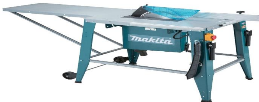
Slika 3. Stolna kružna pila

Dobra praksa preporučuje označavanje opasnog područja drugom bojom (najbolje crvenom) na radnom stolu. To područje obuhvaća 300 mm obostrano u odnosu na lista pile. Rukovateljeve ruke ne bi smjele niti u jednom trenutku biti u tom opasnom području [6].