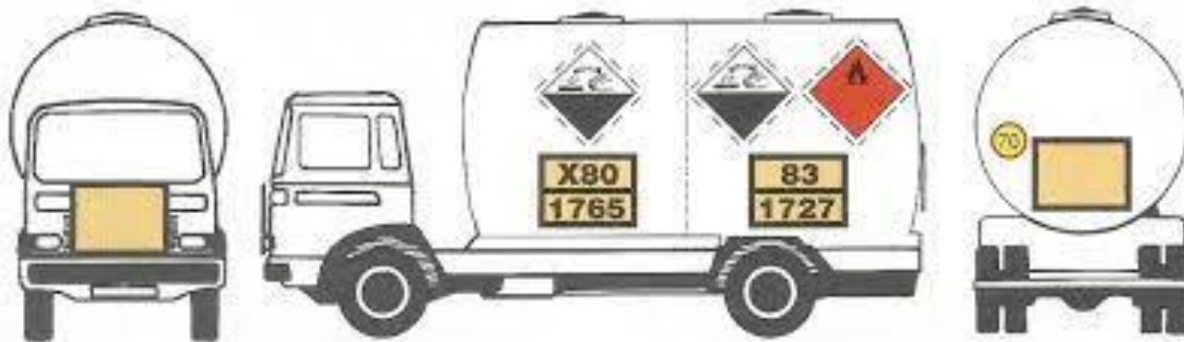
Slika 13 Položaj označavanja vozila za prijevoz