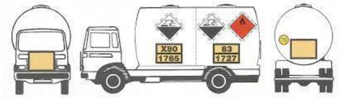
Slika 10. Položaj označavanja vozila za prijevoz