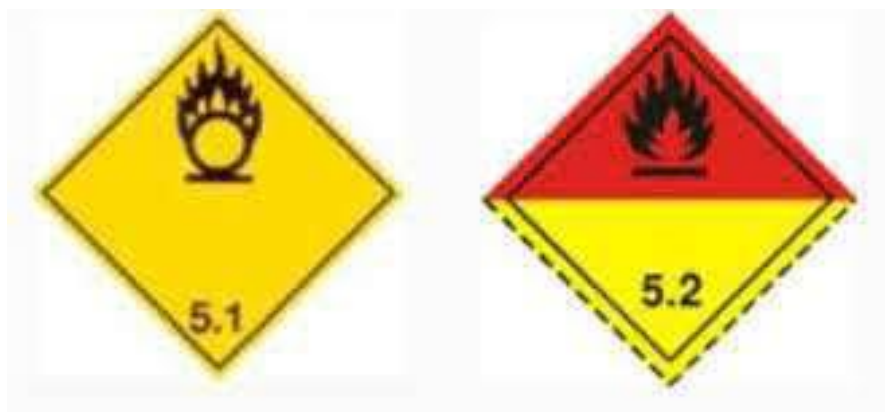
Slika 5. Listica oksidirajućih tvari

Organski peroksidi su tvari koje imaju visoki stupanj oksidacije koji potencijalno može uzrokovati štetne posljedice za zdravlje i život ljudi, te isto tako štete na materijalnim dobrima.