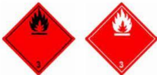
Slika 3. Listica zapaljivih tekućina

Zapaljive tekućine su tvari ili smjese tekućina koje su na temperaturi do 20°C u tekućem stanju, pri 50°C tlak pare im je do 3 bara te se prevoze na temperaturi jednakoj ili višoj od svojega plamišta. Plamište im ne prelazi 60°C.