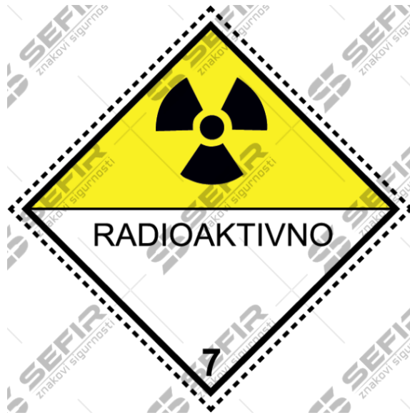
Slika 6. Znak za opasnost od radioaktivnosti