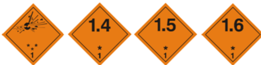
Slika 11. Listice opasnosti od eksplozivnih tvari

Listice opasnosti su razne pločice ili naljepnice u obliku romba koje služe za dopunsko označavanje pojedinih klasa opasnih tvari. Lijepje se na spremnicima na vidljivu mjestu obje bočne i stražnje strane motornog vozila, prikolice, poluprikolice i autocisterne kao i na pojedinačna i skupna pakiranja opasnih tvari.