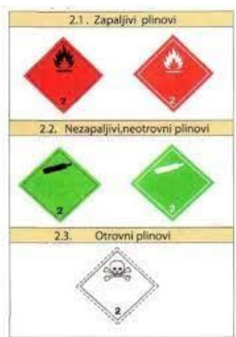
Slika 2. Listice plinova

Klasa 2 sadrži čiste plinove, smjese plinova, smjese jednog ili više plinova i ostale slične tvari. Plinovi su tvari koje na temperaturi od 50°C imaju tlak viši od 3 bara te kod 20°C i standardnog tlaka od 101,3 kPa u plinovitom stanju. Plinovi se transportiraju u sljedećim fizikalnim stanjima: komprimirani plinovi, tekući plinovi, duboko pothlađeni tekući plinovi, plinovi otopljeni pod tlakom.