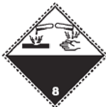
Slika 7. Listica korozivnih tvari

Korozivne ili nagrizajuće tvari su one tvari koje u dodiru s drugim tvarima i živim organizmima izazivaju njihovo oštećenje ili uništenje. Prema stupnju opasnosti korozivne tvari se dijele na teško nagrizajuće, nagrizajuće tvari i blago nagrizajuće tvari.