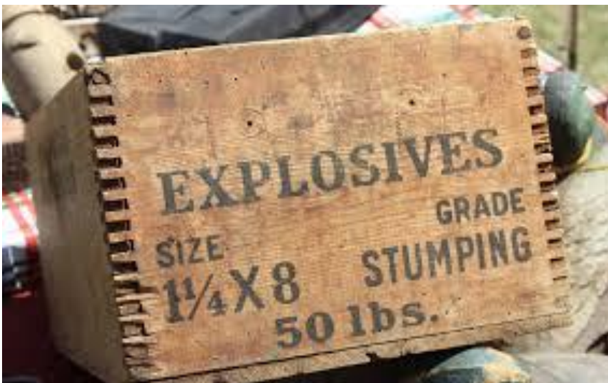
Slika 9. Kutija sa eksplozivom