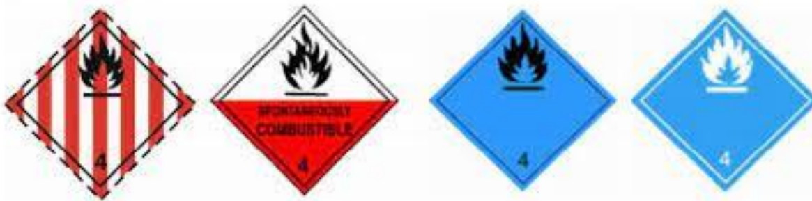
Slika 4. Listica zapaljivih krutih tvari