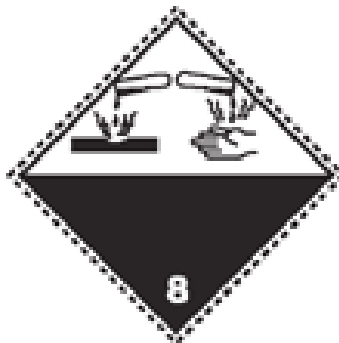
Slika 7. Listica korozivnih tvari

Korozivne ili nagrizajuće tvari su one tvari koje u dodiru s drugim tvarima i živim organizmima izazivaju njihovo oštećenje ili uništenje. Prema stupnju opasnosti korozivne tvari se dijele na teško nagrizajuće, nagrizajuće tvari i blago nagrizajuće tvari.