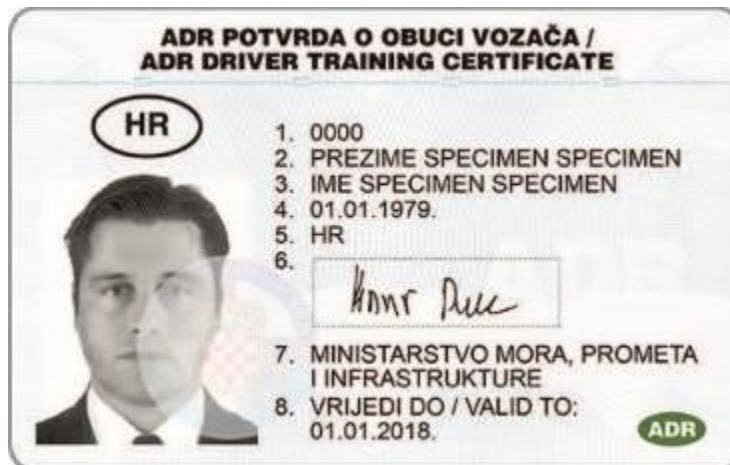
Slika 12. Potvrda o osposobljenosti vozača