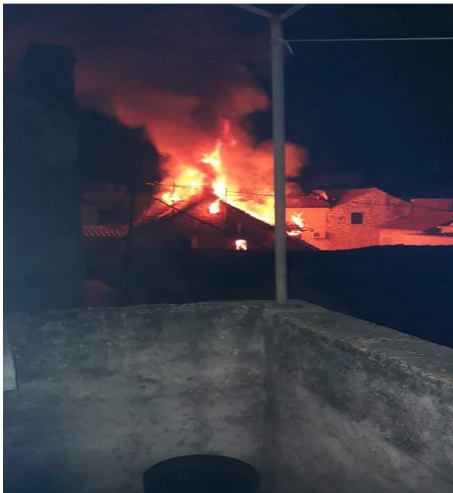
Sl.22. Požar objekta u Trogiru 19.4.2021.[4]

Tijekom idućeg dana, nakon obavljenog očevida PU Splitsko-dalmatinske, pristupilo se konačnoj sanaciji i čuvanju požarišta koji je proglašen ugašenim u 18:30 sati. Dana 22. travnja, dežurna smjena JVP Grada Trogira vršila je uklanjanje kupa i nagorenih greda objekta koje su prijetile padanjem na ulicu.