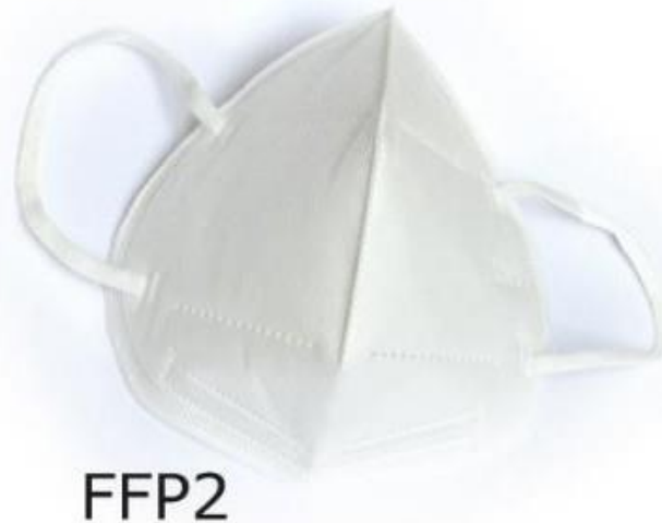
Sl.7 Zaštitna maska FFP2 [7]

Kako bi se zaštitilo dišne organe u najvećoj mogućoj mjeri, maska FFP2 ima svrhu zaštititi od ulaska virusa, prašine i ostalih štetnih čestica. Maske se izrađuju od dva sloja netkane tkanine i srednjeg sloja filtrirajuće tkanine. Princip kako maske djeluju je temeljen na srednjem sloju filtrirajućeg materijala koji ima svojstvo statičkog elektriciteta tako da može apsorbirati nečistoće i male čestice. „Budući da se fina prašina apsorbira na filterski element, a filterski element je statičan i ne može se prati vodom, samousisni filterski respirator protiv čestica treba redovito mijenjati filterski element.“ [10]