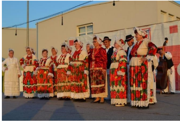
Slika 1 Kulturno umjetničko društvo "Sveti Florijan" Poljana Lekenička