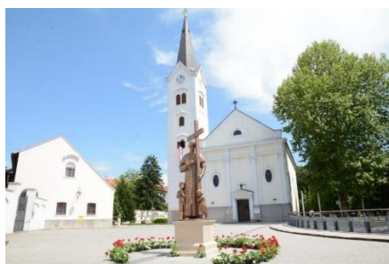
Slika 8 Katedrala u Sisku