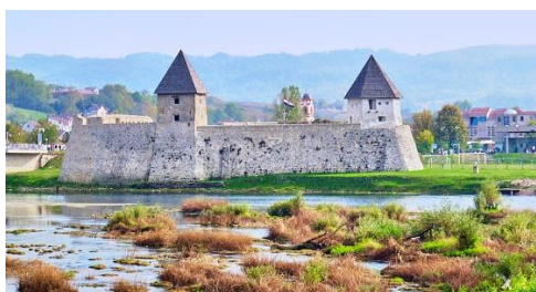
Slika 4 Stari grad Hrvatska Kostajnica