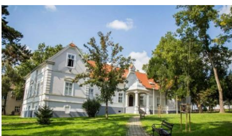
Slika 6 Muzej Moslavine