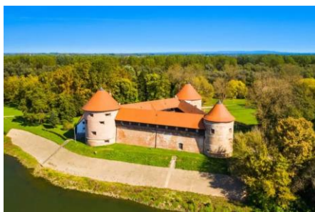
Slika 5 Stari grad Sisak