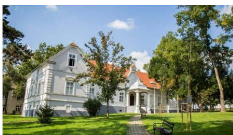
Slika 6 Muzej Moslavine

Izvor: Muzej Moslavine, https://experiences.moslavina.travel/hr/products/muzej-moslavine (1.7.2023.)