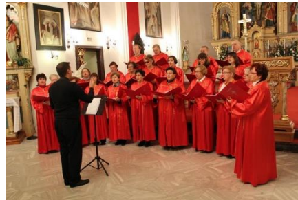
Slika 3 Katedralni pjevački zbor „Sveta Cecilija“