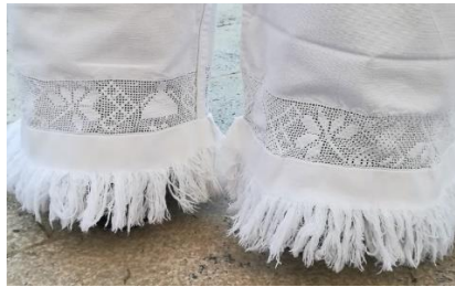
Slika 2 Vez pukan'ca