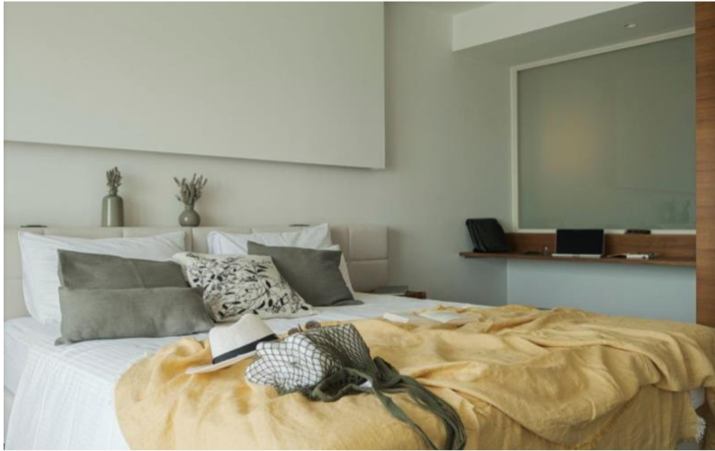
Slika 11. Superior Terrace soba

Room service Laundry service Sea view Terrace Air condition Private bathroom & toilette Hair dryer Mini bar Safe deposit box in room TV Wi-Fi Bathrobe Parking