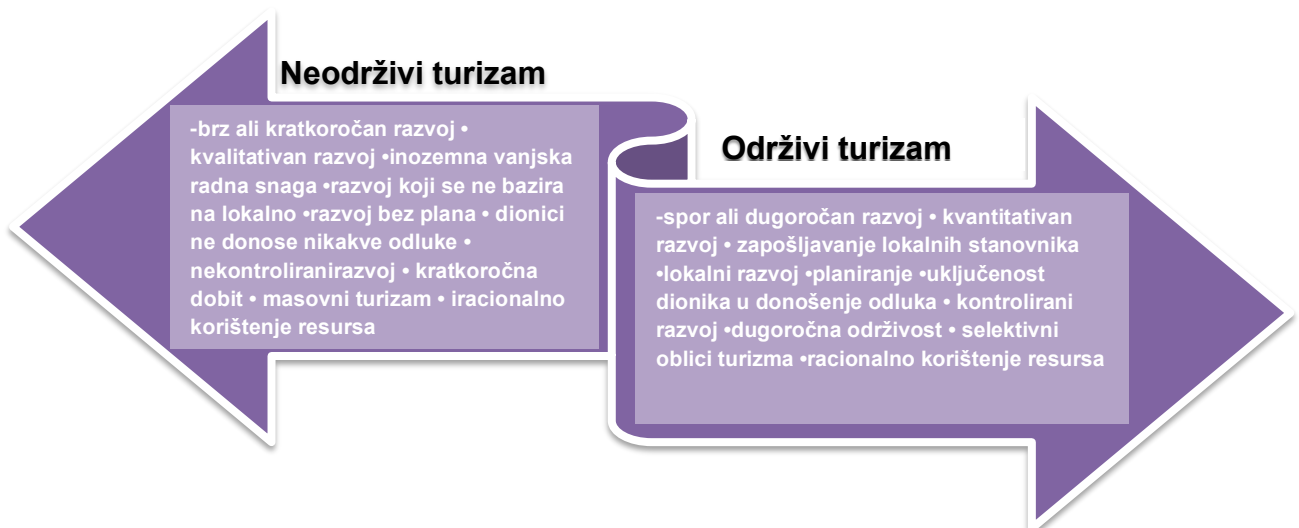
Slika 1. Usporedba održivog i neodrživog turizma

Resursi se uvelike troše iracionalno i prisutan je nemar za buduće generacije. U svome djelovanju nema detaljnog i razrađenog plana kako treba postupiti u pojedinim situacijama, plan nije fleksibilan i nije prisutna briga o zapošljavanju lokalnog stanovništva. Slika 1 prikazuje razliku održivog turizma u odnosu na neodrživi turizam.