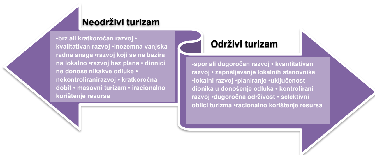
Slika 1. Usporedba održivog i neodrživog turizma

Resursi se uvelike troše iracionalno i prisutan je nemar za buduće generacije. U svome djelovanju nema detaljnog i razrađenog plana kako treba postupiti u pojedinim situacijama, plan nije fleksibilan i nije prisutna briga o zapošljavanju lokalnog stanovništva. Slika 1 prikazuje razliku održivog turizma u odnosu na neodrživi turizam.