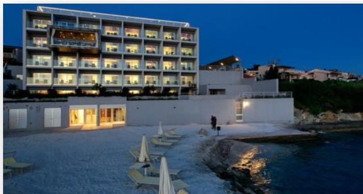
Slika 7. Hotel Split