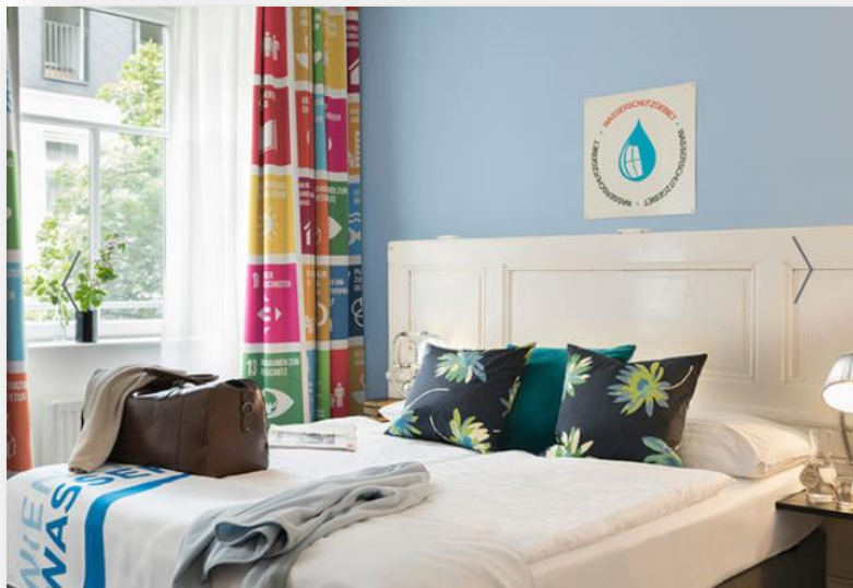
Slika 15. Standard soba