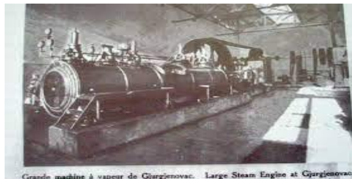
Sl.2. Pilana na parni pogon.[3]

Razvoj pilana na parni pogon se uglavnom temeljio na stranom kapitalu. Podizanje parnih pilana se najviše isplatilo u podravsko-slavonskom području zbog velikih kompleksa šuma, uz bogatstvo hrastovine koja je bila izuzetno cijenjena. Za njezinu su obradu zaslužni Francuzi koji su prvi uveli specifičnu tehniku piljenja hrastovine u Slavoniji. Svoj je kapital u podizanje triju pilana uložilo jedno francusko crkveno društvo u posljednjoj četvrtini 19. og stoljeća. Svaka je pilana imala četiri ili više vertikalnih jarmača, a najvažnija i najveća pilana je podignuta u Vrbanji, dok su druge dvije bile podignute u Normancima kod Osijeka, te u Zagrebu.[3]