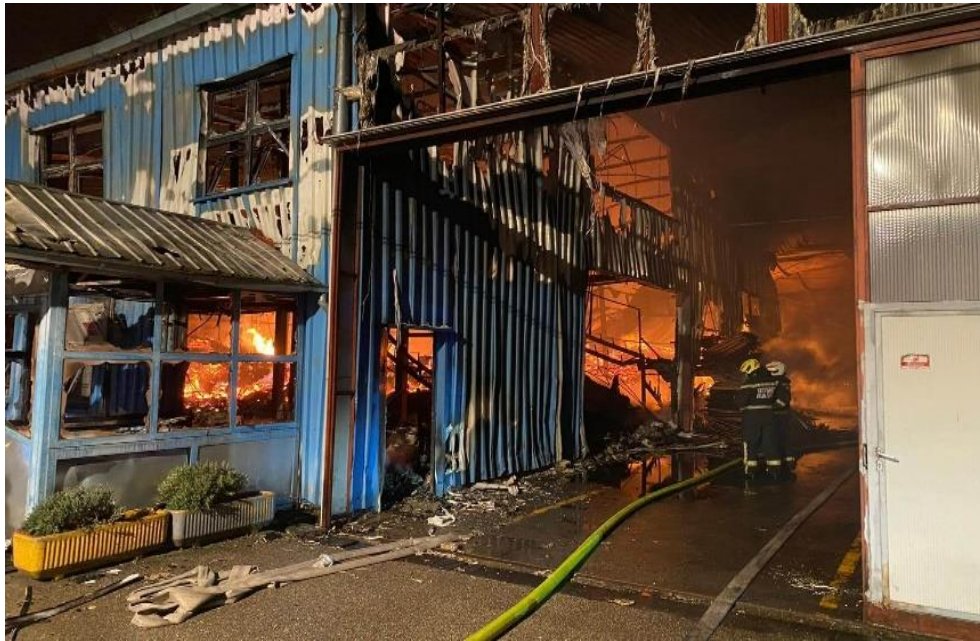
Sl.5. Požar u PPS-Galeković.[19]

Početak travnja 2023. godine, dogodio se požar u tvornici PPS-Galeković u mjestu Mraclin u Hrvatskoj. Naime, prema policijskom izvješću zapalio se pogon uslijed stvaranja eksplozivne smjese drvene prašine i zraka u prostoru oko radnog stroja. Točnije, eksploziju je pokrenula mehanička iskra, nakon čega se plamena stihija proširila na radne strojeve, drvenu masu, inventar i većinu hale. Požar se iz pogona proširio i na dio krovišta te na skladište susjednog objekta. Tijekom požara smrtno je stradao jedan radnik od posljedica opekline.[19]