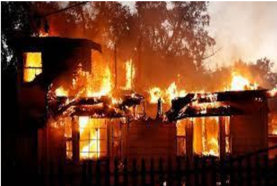
Sl.4. Požar u lakirnici Spačva.[18]

Požar u drvanoj industriji Spačva dogodio se 2016. godine. Prema policijskom izvješću, požar se dogodio i hali u kojoj se izvodi površinska obrada materijala, a koja je ujedno i skladište podnih obloga. Očevidom je utvrđeno kako je uzrok požara kvar na električnom kabelu radnog stroja. Materijalna šteta iznosi više milijuna kuna, izgorjeli su strojevi i brodski podovi, no nije bilo ozlijeđenih osoba.[18]