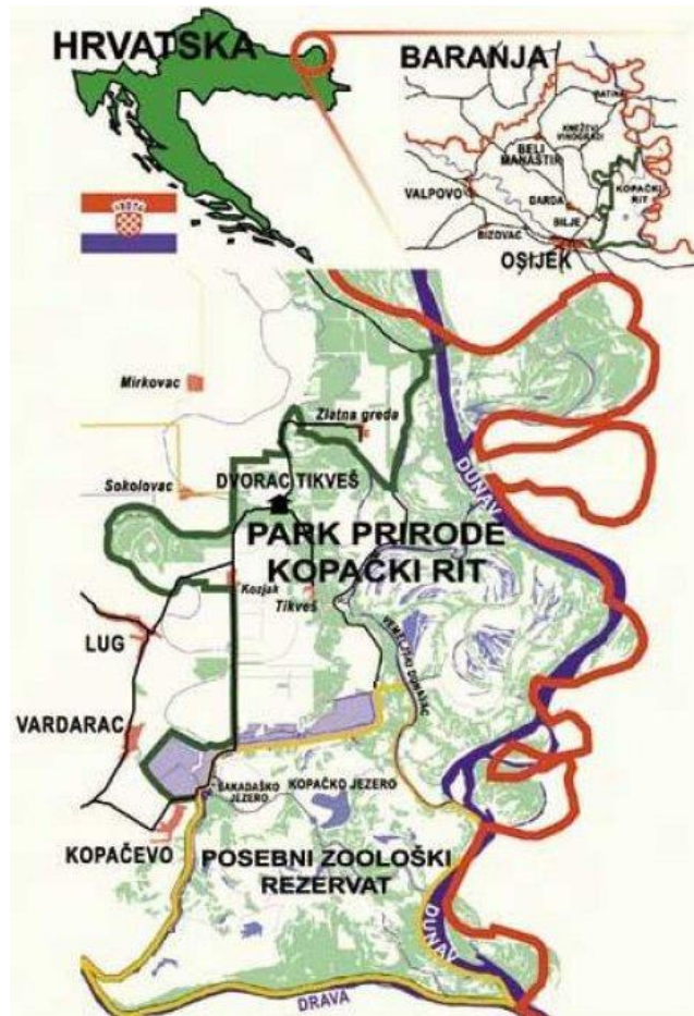
Sl. 4. Položaj Parka prirode Kopački rit [19]