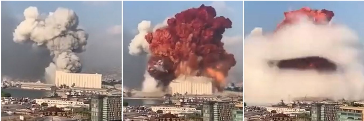
Slika 10.: Plinovi nastali u eksploziji skladišta 12 u luci Bejrut [24]

Najveći dijagnostički izazov za bolničke kliničare na svim razinama skrbi nakon katastrofe bilo je suočavanje s velikim brojem žrtava i višestrukim prodornim ozljedama. Unatoč aktiviranju bolničkog plana za slučaj katastrofe, pacijenti su dolazili u mnogo većem obimu od onoga što bolnički resursi i kapaciteti mogu primiti. Elektronički zdravstveni sustavi nisu uspjeli prihvatiti val pacijenata. Ogroman porast ozljeda spriječio je formalno dokumentiranje kartona pacijenata; mnogi ozlijeđeni i umrli nisu identificirani.