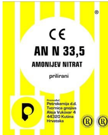
Slika 2.:Komercijalno dostupni amonijev nitrat kao gnojivo [10]

Za čisti amonijev nitrat (gnojivo) treba posebna poljoprivredna dozvola. Osim što se koristi za poljoprivredu, njegove soli se miješaju s tekućim eksplozivima i koristi se kao eksploziv. Dodaje mu se pijesak (dolomit) u obliku kalcija, i ostali spojevi, da bi se smanjila mogućnost od eksplozije. Eksplozivi na bazi amonijeva nitrata su najjeftiniji i najčešće su korišteni gospodarski eksplozivi [7]. Fizikalno-kemijska svojstva amonijevog nitrata prikazana su u Tablici 1.