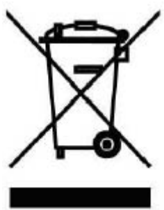
Slika 2. Oznaka o obaveznom odvojenom sakupljanju električnoga i elektroničkoga otpada koja se nalazi na takvim proizvodima [17]

se zalijepiti na ambalažu, upute i jamstveni list. Slika 2. Prikazuje kako izgleda ta oznaka [17]