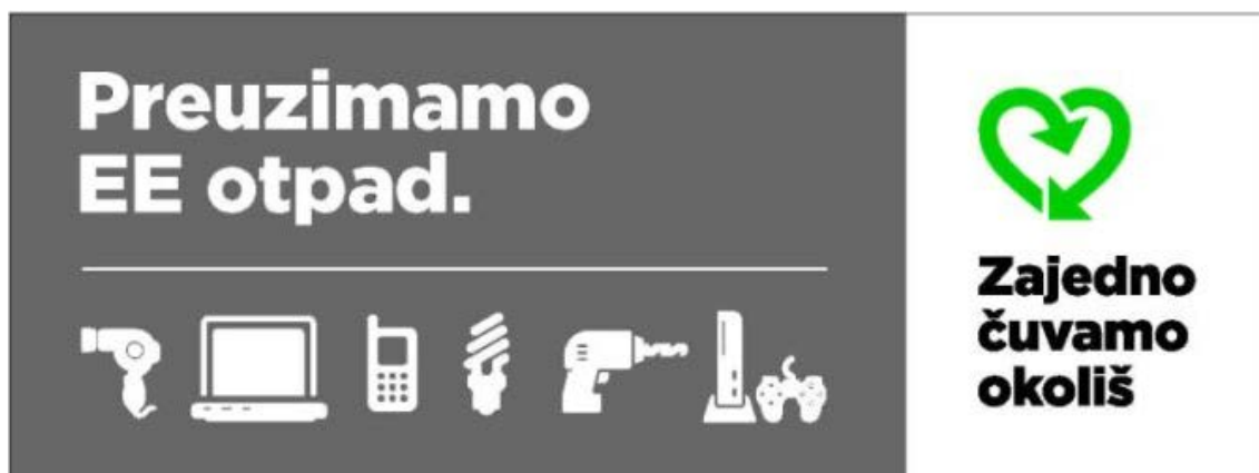
Slika 3. Naljepnica koja označava da prodavač preuzima električni i elektronički otpad [17]

Slika 3. Na sljedećoj slici može se vidjeti kako izgleda ta naljepnica. [17]