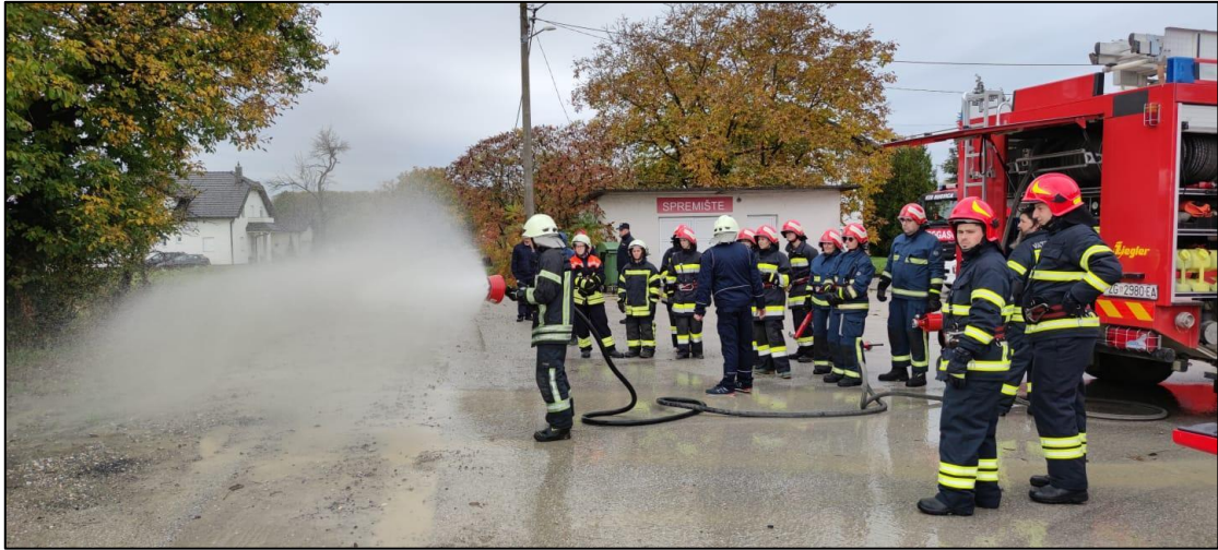
Slika 2. Predavač prezentira rad vatrogasnih sprava [15]

Odgojni zadatak polaznike usmjerava zajedništvu i timskom radu. U timu vatrogasci moraju brinuti jedni o drugima, moraju biti marljivi i pravovremeno izvršavati svoje zadatke, moraju brinuti o poštivanju etičkog kodeksa vatrogastva i o preciznosti izvršavanja svojih zadataka.