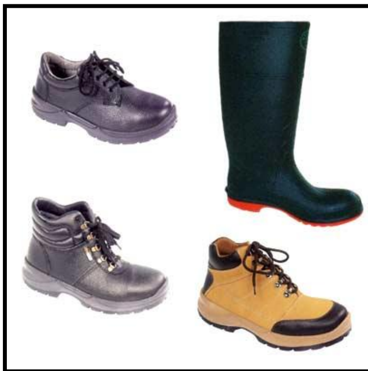
Sl. br. 29 Sredstva za zaštitu nogu

6. Sredstva za zaštitu nogu: Ovisno o opasnostima, štetnostima i naporima na pojedinom radnom mjestu poslodavac je dužan radniku omogućiti osobna zaštitna sredstva, a radnik je dužan upotrebljavati ih. Takva obuća ne smije biti teška i neudobna, odnosno mora biti oblikovana u skladu sa ergonomskim zahtjevima. Poslodavac mora utvrditi vrstu obuće koja odgovara stanju na radnom mjestu uzimajući u obzir razinu rizika, učestalost izlaganja rizicima, karakteristike radnog mjesta, okolnosti, vrijeme te uvjete u kojima ih radnik mora upotrebljavati. Takva obuća ne smije tokom rada izazvati žuljeve ili znojenje nogu.