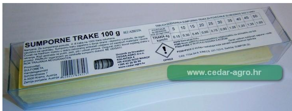
Sl. br.2 Sumporne trake

Kad se bačva osuši, ako će ostati prazna, potrebno je zapaliti sumpornu traku (1 traka na volumen od 300 l) i nakon sagorijevanja trake zatvoriti bačvu [2].