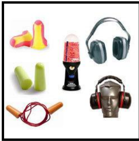
Sl. br. 25 Zaštita sluha