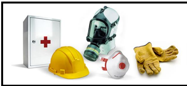
Sl. br. 20 Osobna zaštitna sredstva

Za smanjenje opasnosti i rizika od nezgoda na radu primjenjuju se osobna zaštitna sredstva . Međutim, prilikom provođenja mjera poboljšanja zaštite na radu prioritet se poklanja radnim strojevima i uređajima koji moraju udovoljiti propisanim pravilima. Tek kada se utvrdi da strojevi i uređaji ne mogu postići potrebni stupanj sigurnosti obvezna je upotreba osobnih zaštitnih sredstava. Osobna zaštitna sredstva se u nekim slučajevima moraju stalno upotrebljavati, kao naprimjer na gradilištima gdje se opasnosti od padajućih predmeta ne mogu u potpunosti ukloniti.