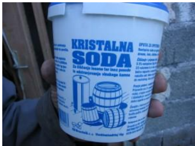
Sl. br. 3 Kristalna soda

To radimo tako da bačvu prvo napunimo hladnom vodom i ostavimo je tako napunjenu 2 - 3 dana. Nakon toga izlijemo vodu i bačvu ovinjavamo vrelom (prokuhanom) vodom u kojoj je otopljen natrijev karbonat (soda) 4 - 5 kg/100 litara. Bačvu zatvorimo i valjamo dok se voda ne ohladi. Vrlo je bitno da se voda u bačvi ohladi jer se hlađenjem vode u bačvi stvara podtlak koji iz duga izvlači tanin i druge nepoželjne tvari.