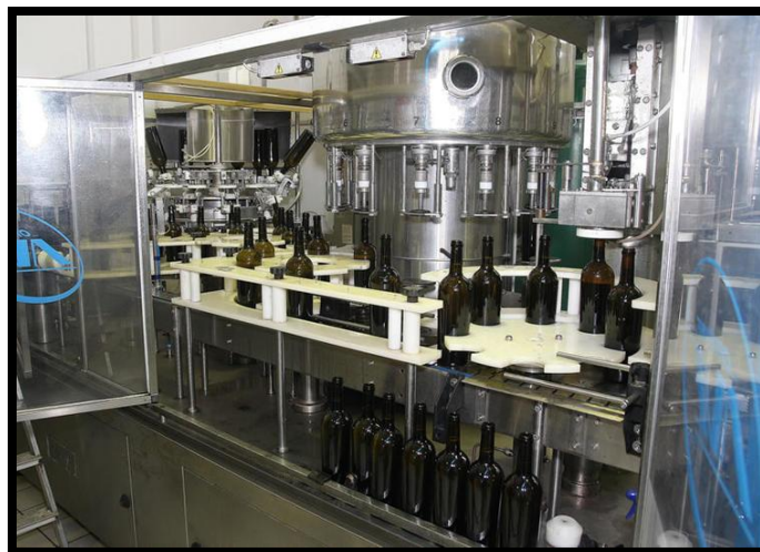
Sl. br. 19 Punjenje vina

Napunjeno vino treba čuvati u prikladnim podrmskim uvjetima, na nižim temperaturama i u mračnijim prostorima.