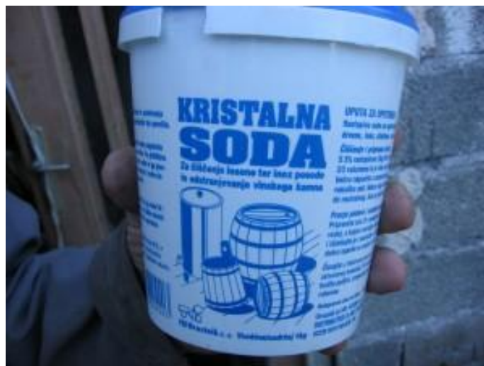
Sl. br. 3 Kristalna soda

To radimo tako da bačvu prvo napunimo hladnom vodom i ostavimo je tako napunjenu 2 - 3 dana. Nakon toga izlijemo vodu i bačvu ovinjavamo vrelom (prokuhanom) vodom u kojoj je otopljen natrijev karbonat (soda) 4 - 5 kg/100 litara. Bačvu zatvorimo i valjamo dok se voda ne ohladi. Vrlo je bitno da se voda u bačvi ohladi jer se hlađenjem vode u bačvi stvara podtlak koji iz duga izvlači tanin i druge nepoželjne tvari.