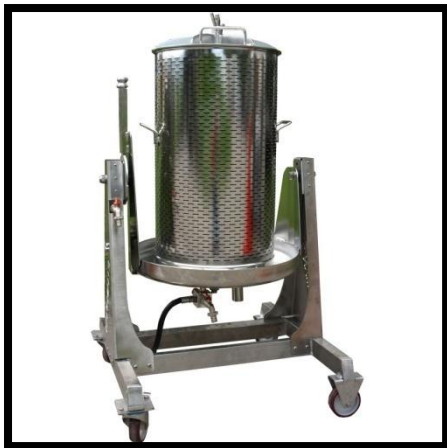
Sl. br. 14 Preša za grožđe

Čovjek je, otkad je počeo prerađivati grožđe, koristio različite načine istiskivanja soka i različite uređaje. Danas se uglavnom upotrebljavaju preše koje su u odnosu na nekadašnje mnogo manje i praktičnije, a pokreću se ručno ili strojno.