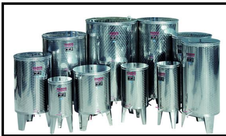
Sl. br. 6 Inox posude – bačve

Izrađuju se od plemenitog čelika. Trajnost, održavanje, manipulacija i napokon njihova cijena daju prednost ovom vinskom posuđu u odnosu na drveno.