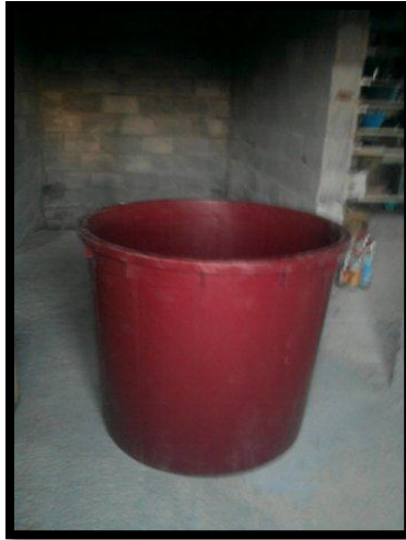
Sl. br. 5 Plastični badanj (kaca)

Nove bačve se prije korištenja napune toplom vodom te nakon par sati isperu 3% otopinom limunske kiseline. Iz već korištene bačve, kamenac koji se nalazi na unutrašnjim stijenkama najbolje se odstranjuje naizmjeničnim pranjem hladnom i vrućom vodom.