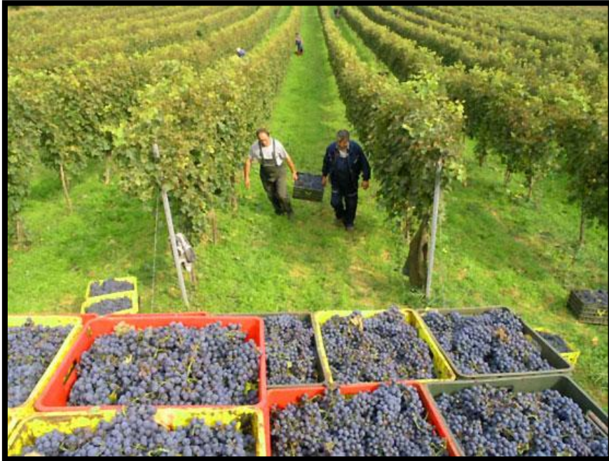
Sl. br. 7 Berba grožđa

Jedna od najznačajnijih radnji u vinogradu je berba grožđa.