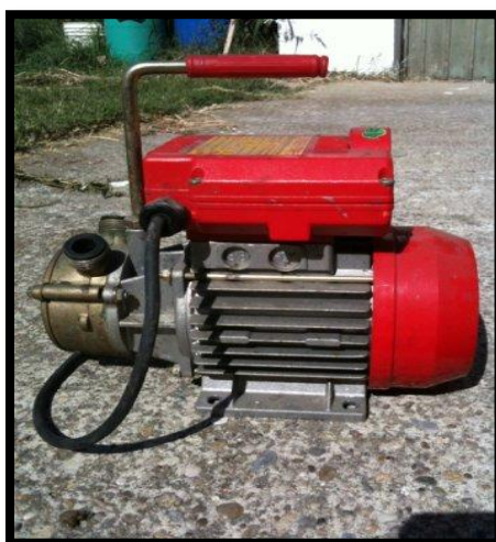
Sl. br. 17 Pumpa za pretakanje vina

Pretok može biti: otvoren (uz prisustvo zraka) ili zatvoren (bez prisustva zraka).