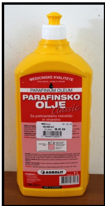
Sl. br. 16 Parafinsko enološko ulje

Po pretoku i sumporenju ovog mladog vina, ako ga držimo u inox posudi, moramo između plutajućeg poklopca i stijenke bačve doliti vazelinsko ili parafinsko enološko ulje.