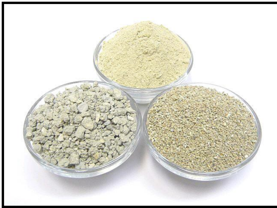
Sl. br. 33 Bentonit

Da bismo izbjegli ovu manu, vina treba bistrirati bentonitom (vrsta gline, dozacija je od 40 – 100g na 100l vina).