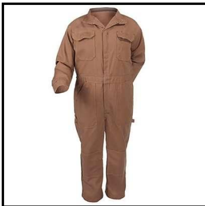
Sl. br. 30 Zaštitno odijelo

7. Sredstva za zaštitu tijela: Zaštitna sredstva za tijelo trebaju štititi radnika od prašine, vode i drugih tekućina, od nagrizajućih tvari, od plamena i užarenih čestica, od toplinskog zračenja, od nepovoljnih klimatskih uslova i od povreda. Tu spadaju različite vrste radnih odijela od različitih materijala, već prema namjeni: razne pregače, posebni štitnici za pojedine dijelove trupa (rame, trbuh, bok), kabanice i ogrtači.