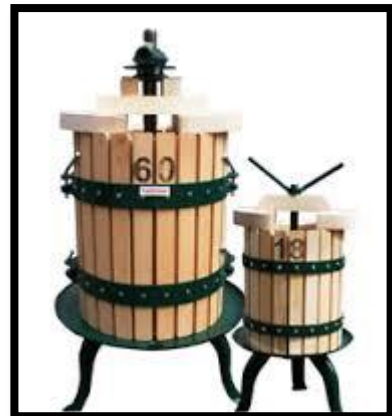
Sl. br. 15 Preša za grožđe (drvena)

Kod prešanja je važno da se pritisak na masulj u košu preše postiže polako, s prekidima, jer pri naglom prešanju brzo se sabija kom-drop, pa je otežano otjecanje mošta. Kad se kom više ne može sabiti, prešanje se prekida i kom se vadi iz koša.