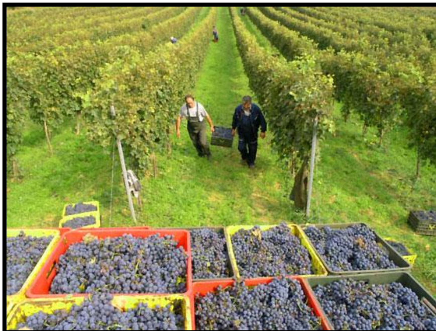
Sl. br. 7 Berba grožđa

Jedna od najznačajnijih radnji u vinogradu je berba grožđa.