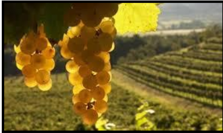
Sl. br. 11 Bijelo grožđe

Osnovna je razlika između postupaka proizvodnje bijelih i crnih vina u tome što se bijela vina NAJČEŠĆE dobivaju vrenjem mošta, a crna vrenjem masulja.