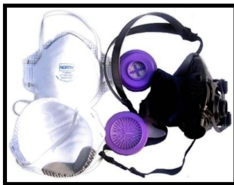
Sl. br. 26 Sredstva za zaštitu organa za disanje