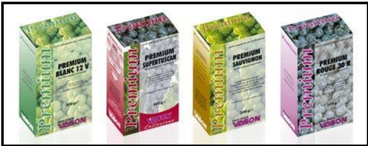
Sl. br. 10 Kvasci i druga enološka sredstva

Kvasci se prodaju pod raznim trgovačkim imenima, u većim i manjim pakiranjima, danas najčešće u suhom, vakumiranom obliku.