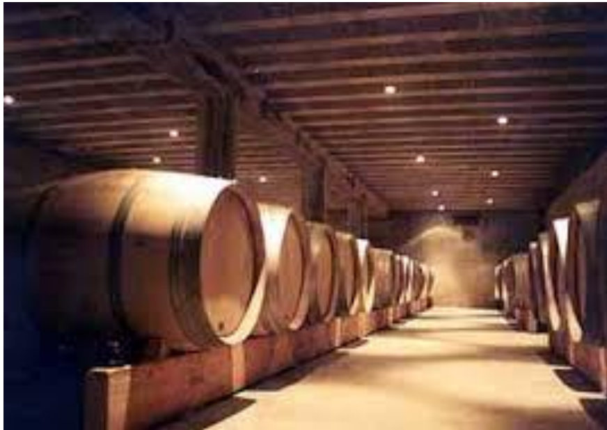
Sl. br. 1 Drvene bačve

cijevi uvodi pregrijana vodena para u bačvu. U tom slučaju bačva mora biti vranjem ( otvorom za čep ) okrenuta prema podu.