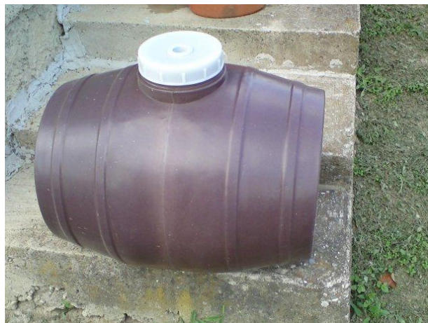
Sl. br. 4 Plastična bačva

Iako ne mogu zamijeniti kvalitetu drvenih, plastične bačve su dosta zahvalne radi rukovanja i održavanja.