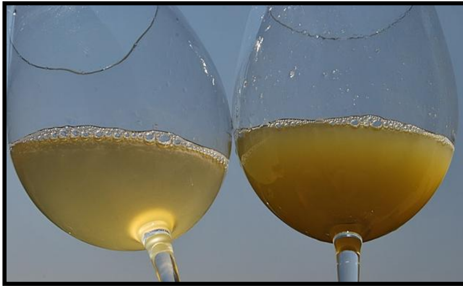
Sl. br. 31 Sluzavost vina

Vino se pretače uz prisustvo kisika, pri čemu je bitno da se mlaz što više rasprši i razbija. U ovu svrhu može poslužiti sito ili metla koja mora biti čista i nekorištena u druge svrhe.