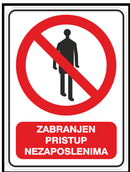
Sl. br. 21 Znak opasnosti

Procjena rizika izrađuje se u skladu s priznatim metodama te služi za utvrđivanje postojanja opasnosti, vrste opasnosti te opseg opasnosti. Nakon provedene analize daju se prijedlozi mjera za umanj enje opasnosti i kontrolu provođenja utvrđenih mjera.