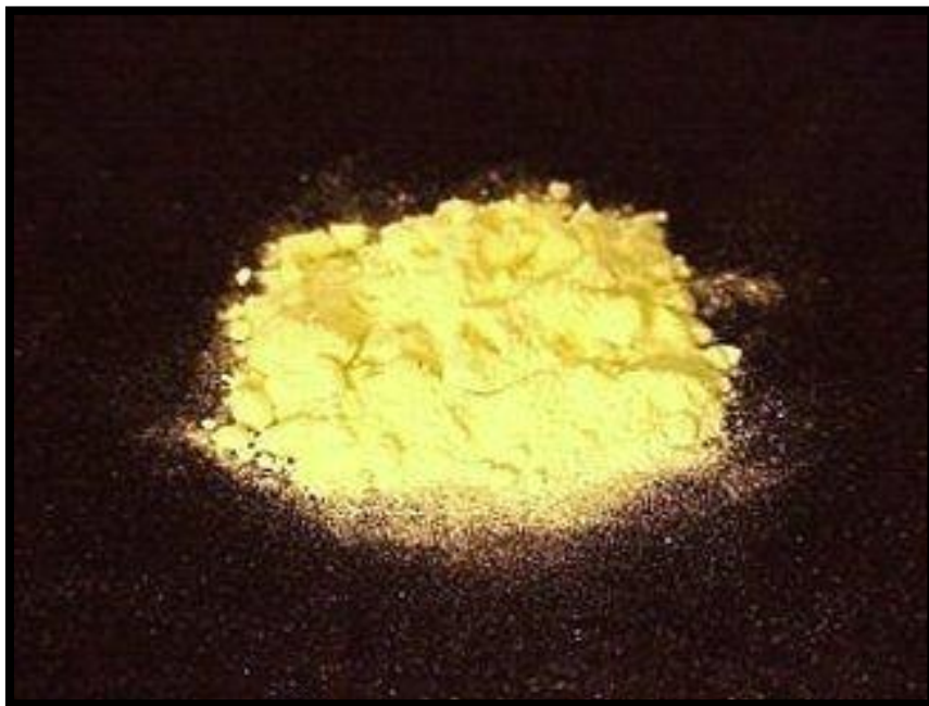
Sl. br. 9 Sumpor u prahu

Kod pojedinih proizvođača vina još uvijek postoji pristup da je sumpor štetan i otrovan i da oni mogu proizvesti dobro vino bez upotrebe sumpora.