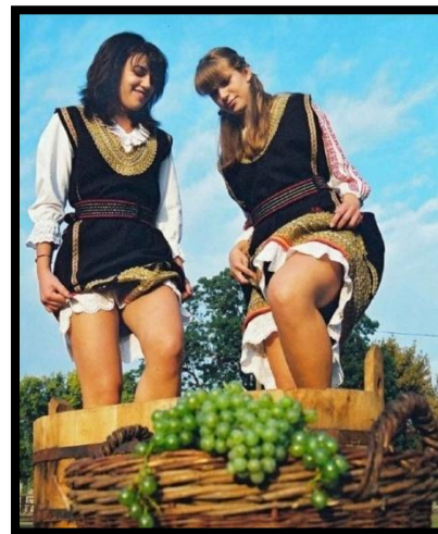
Sl. br. 13 Gaženje grožđa

Muljanjem se grožđe gnječi, a preporuča se muljača koja odvaja peteljku, zbog toga što peteljka sadrži tanine koji vinu daju trpak i gorak okus, pogotovo ako peteljka prevrije s masuljem.