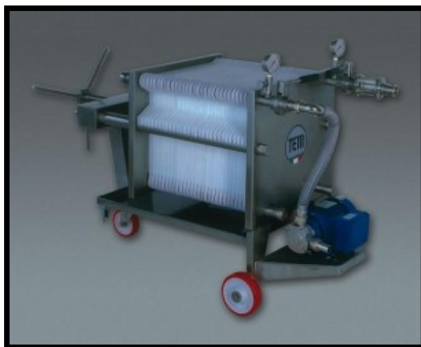
Sl. br. 18 Filter za filtriranje vina

Treba naglasiti da filtriranje znatno poskupljuje cijenu vina, jer ploče (platna) su dosta skupa.