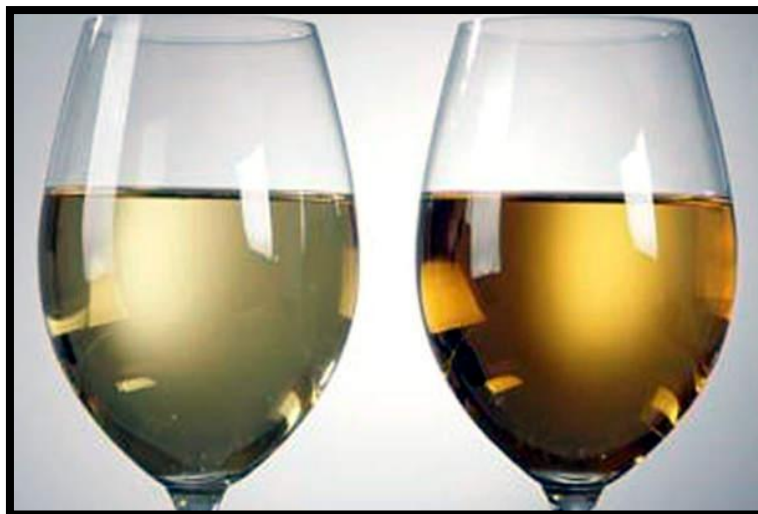
Sl. br. 32 Oksidacija vina

Treba poduzeti sve mjere da do ove pojave ne dođe.