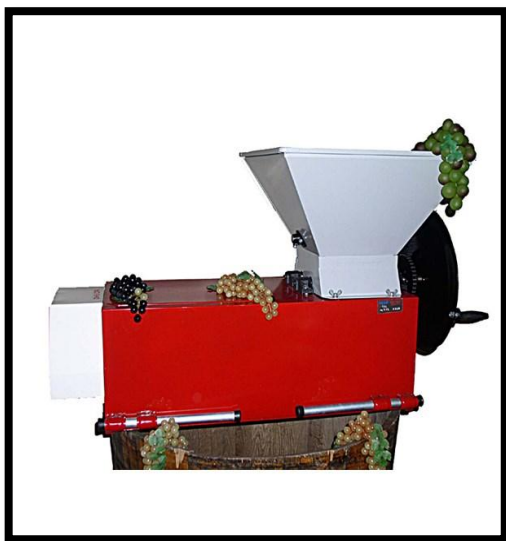
Sl. br. 12 Motorna ruljača