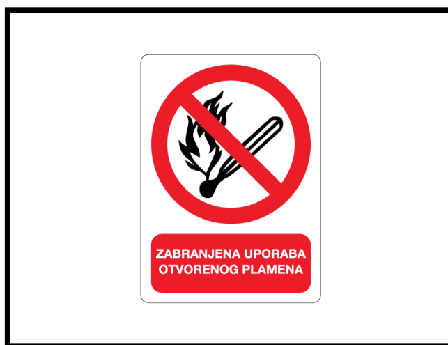
Sl. br. 22 Znak opasnosti

Da bi se zaštita na radu uspješno provodila nužno je shvatiti njena pravila , a to su: