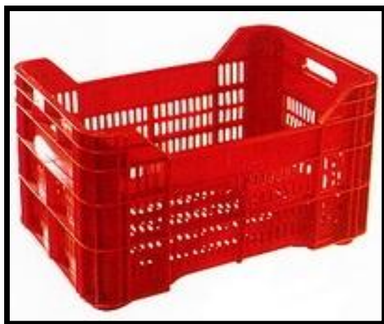
Sl. br. 8 Plastična gajba za branje grožđa

Prilikom berbe svakako treba odvajati zdravo grožđe od bolesnog. Ubrano grožđe je potrebno što prije preraditi. Bilo bi najbolje da se prerada grožđa obavi u istom danu kad je obavljena berba.