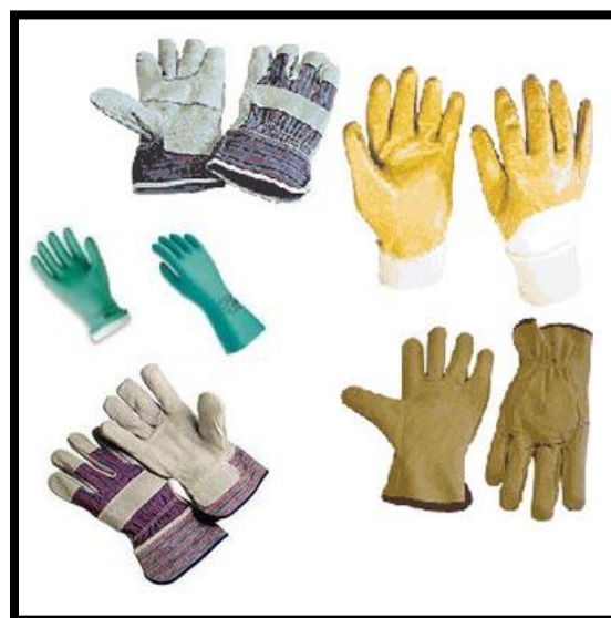
Sl. br. 28 Sredstva za zaštitu ruku