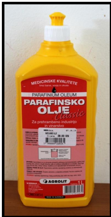
Sl. br. 16 Parafinsko enološko ulje

Po pretoku i sumporenju ovog mladog vina, ako ga držimo u inox posudi, moramo između plutajućeg poklopca i stijenke bačve doliti vazelinsko ili parafinsko enološko ulje.