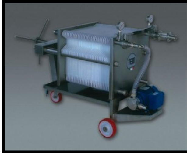
Sl. br. 18 Filter za filtriranje vina

Treba naglasiti da filtriranje znatno poskupljuje cijenu vina, jer ploče (platna) su dosta skupa.