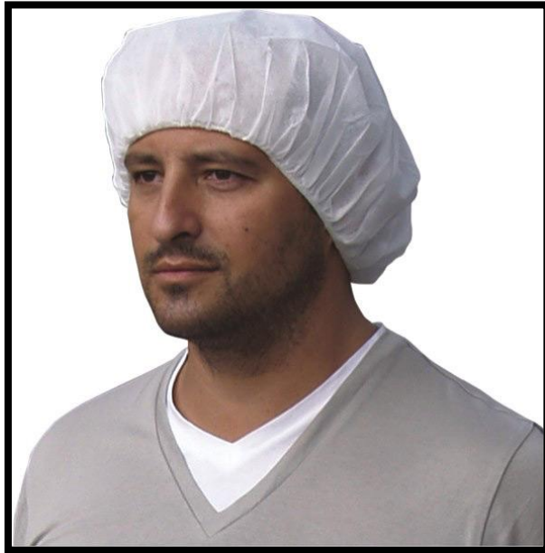
Sl. br. 23 Zaštitna kapa

koja ima mogućnost podešavanja po veličini s razmakom od kape između 2 i 4 centimetra.