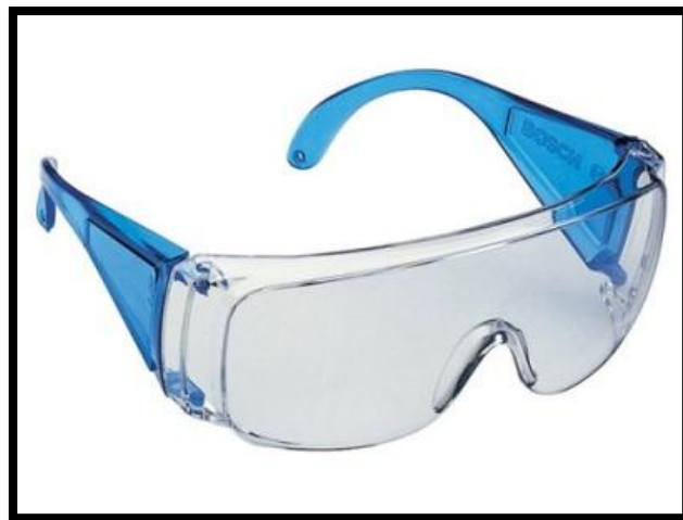
Sl. br. 24 Zaštitne naočale