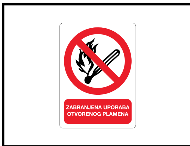
Sl. br. 22 Znak opasnosti

Da bi se zaštita na radu uspješno provodila nužno je shvatiti njena pravila , a to su: