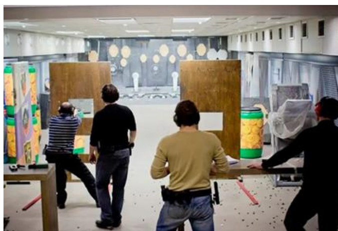
Slika 8 Trening gađanja iz pištolja [22]

korištenje pištolja će biti sigurnije. Navedeno nije dovoljno za poznavanje uporabe pištolja. U cilju prevencije bitno je da se pištolj nosi na pojasu na način koji će omogućiti da se može upotrijebiti na lak i brz način kao i pričuvni spremnici. Da bi osoba uvježbala praktičnu uporabu pištolja, potrebna je volja i trud za ponavljanjem radnji. Preporučuju se treninzi na suho i vježbe instinktivnog gađanja meta. Konačni produkt ovih treninga su psihička i fizička priprema za uporabu oružja. Uporaba vatrenog oružja je u stvarnosti jako stresno iskustvo. Uvježbavanjem taj se stres smanjuje i veća je vjerojatnost pravilnog postupanja u stvarnoj situaciji. [11]