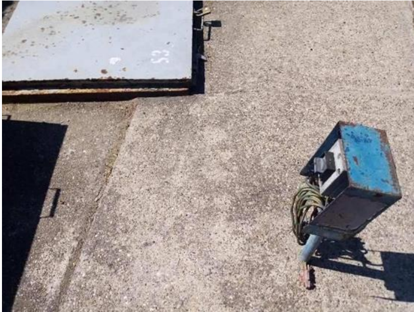
Slika 7. Kabal za uzemljenje cisterne

Nakon što je cisterna spojena na uzemljenje i ograđena ili udaljena na sigurnu udaljenost od prolaznika (min 2m ovisno o vrsti goriva). Kada se istaču benzinska goriva autocisterna mora imati dodatnu mogućnost ozračivanja, što se obavlja spojem dodatnog crijeva na ulaz spremnika.