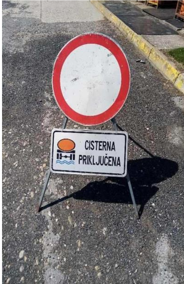
Slika 3. Znak za zaštitu autocisterne

Kada se spremnik nalazi na pisti benzinske postaje cijela traka piste mora biti zatvorena za upotrebu potrošačima, jer to osigurava sigurnu udaljenost od mjesta istakanja. Na ovaj način osigurava se sigurna udaljenost potrošača i prolaznika. Na slici 4. prikazuje se kako to izgleda ispod površine; spremnik za gorivo autocisterna i smještaj agregata za tankiranje automobila.