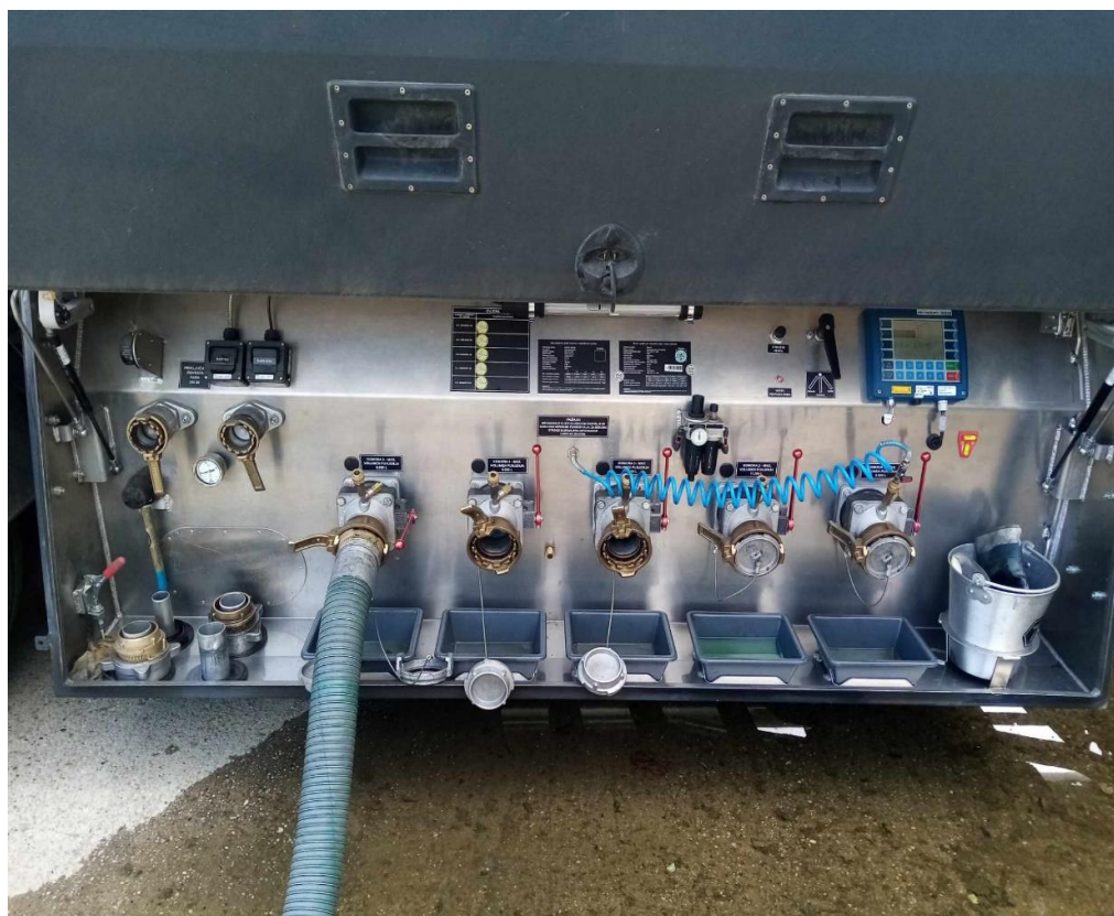
Slika 8. Priključci za istakanje na autocisterni

Autocisterna može imati odnosno najčešće ima više komora u kojima se nalaze različite vrste goriva. Isto tako može imati, više istaknih priključaka (što je u novije vrijeme pravilo, rijetke su autocisterne starijih generacija koje imaju jedan istakni priključak). Na sljedećoj slici, slici 8, prikazani su priključci za istakanje na autocisterni. U istom trenutku moguće je istakati više vrsta goriva, uz uvjet da se spremnici u koje se pretače nalaze u blizini jedan drugome, zbog sigurnosnih mjera.