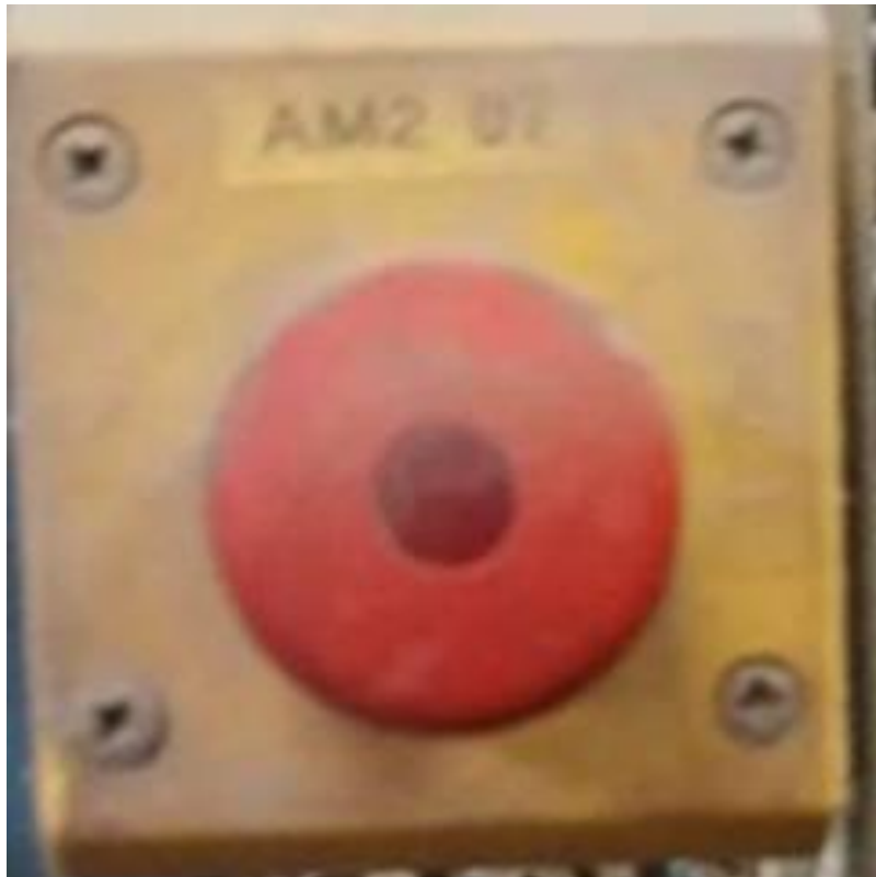
Slika 11. Tipkalo za isključenje struje u cijelom objektu

Tipkalo je potrebno pritisnuti u slučaju kada dođe do požara, razlijevanja veće količine goriva ili ako se osjeti curenje plina; da bi se spriječilo nanošenje dodatne štete od struje i opasnosti od eksplozije.