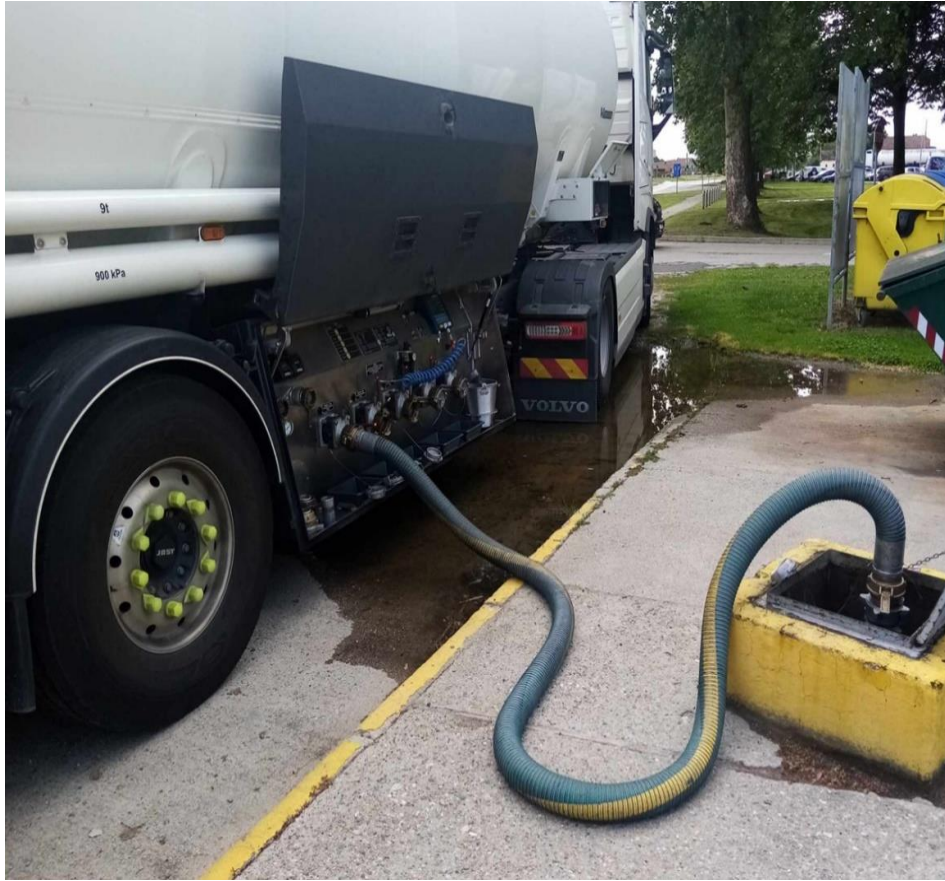
Slika 2. Autocisterna istovar goriva

Pri parkiranju smještanju autocisterne, ona se ograđuje znakovima upozorenja o zabrani približavanja, koji mogu biti različiti kao stupićima i lancem, čunjevima, te se s znakovima upozorenja koji se postavljaju u krug oko autocisterne upozorava na opasnost. Na slici 2 prikazuje se postupak istakanja goriva, dok je na slici 3. prikazan znak upozorenja kojim se ograđuje autocisterna.