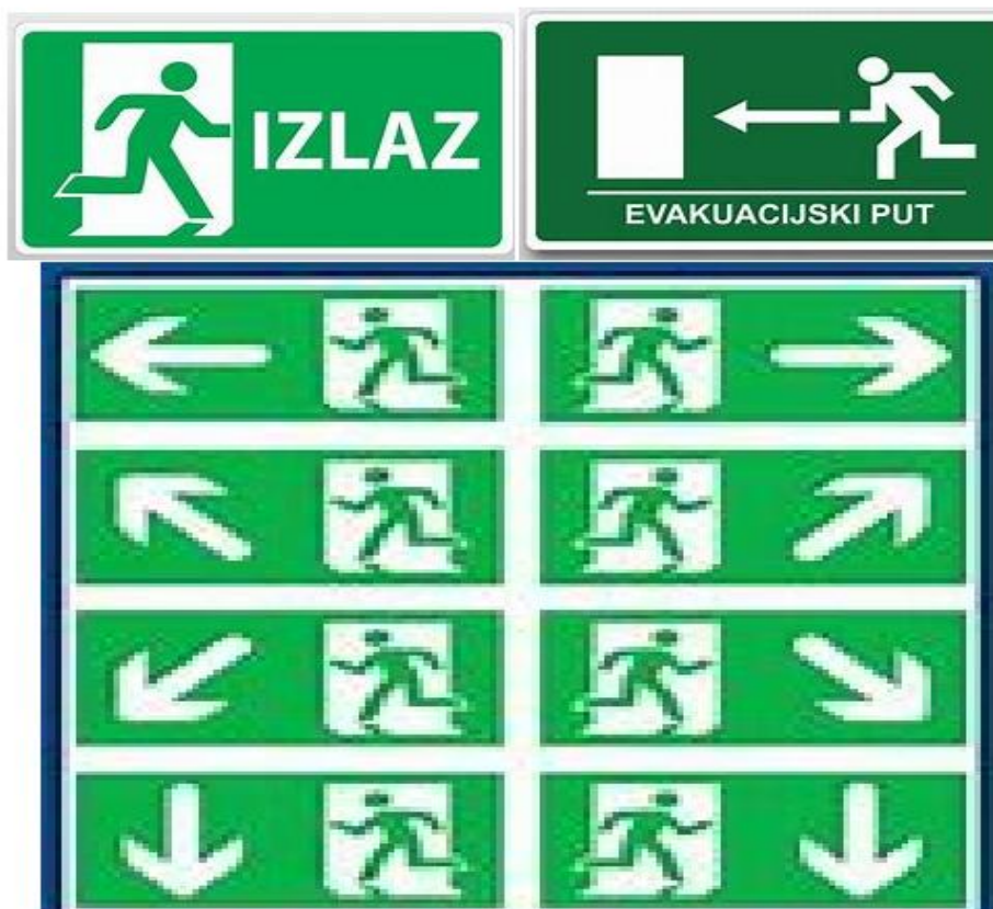
Slika 12. Oznake evakuacijskog puta

Kod rada na benzinskoj postaji moraju se poštivati znakovi upozorenja, u restriktivnom području ili kod određenih poslova; znakovi su prikazani na sljedećoj slici, slika 13. Također radnici moraju nosi radnu odjeću i obuću, koju poslodavac osigurava, radnu odjeću koja ima antistatička svojstva, da bi se spriječilo izazivanje statičkog elektriciteta koji bi mogao potencijalno izazvati požar ili eksploziju.