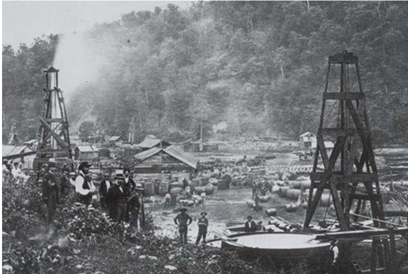
Slika 1. Prvo nalazište nafte u Titusvilleu (Pennsylvania)

Nafta je postala glavni izvor energije početkom 20. stoljeća, posebno zbog unutarnjeg izgaranja u automobilima. Njena važnost za svjetsku ekonomiju je ogromna, s obzirom na to da je proizvodnja nafte ključna za međunarodne odnose i vanjsku politiku mnogih zemalja. Iako će uporaba nafte kao glavnog izvora energije trajati samo nekoliko stoljeća, njen utjecaj na svjetsku industrijalizaciju je neizmjeran [1].