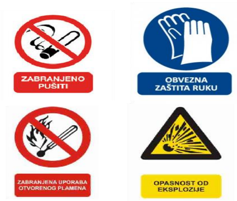
Slika 13. Znakovi upozorenja

Navedeni znakovi upozorenja o otvorenom plamenu i pušenju odnose se na područja oko agregata, okna za zaprimanje goriva i svog prostora u kojem bi se moglo zateći plinovi iz ispušne cijevi podzemnog rezervoara. Opasnost od eksplozije ponajviše se odnosi na UNP i okolicu kaveza ili utakališta UNP-a. Zaštitne rukavice i zaštitne naočale potrebno je nositi pri punjenju spremnika automobila UNP-om.