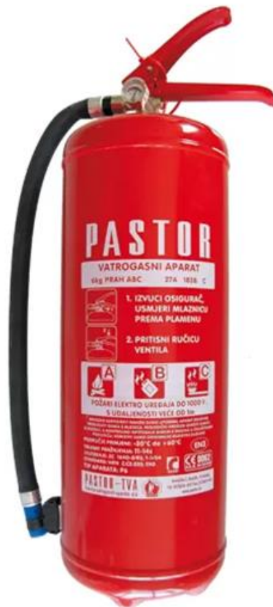
Slika 10. Vatrogasni aparat S30

Na benzinskoj postaji kraj svakog agregata za gorivo, kraj plinskog kaveza, u svakoj unutrašnjoj prostoriji mora se nalaziti vatrogasni aparat, S30 kakav je prikazan na slici u nastavku, slika 10.