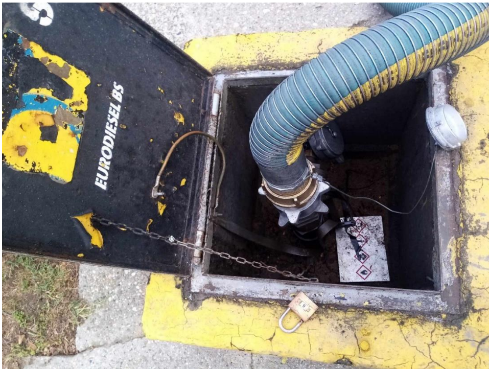
Slika 9. Šaht za istakanje goriva (oko spremnika)

Šahta spremnika goriva na benzinskoj postaji je prihvatno mjesto na kojem se priključuje crijevo za istakanje goriva. Šaht je zatvoren limenim poklopcem i uobičajeno zaključan lokotom. Osoba ovlaštene za otvaranje spremnika je ista osoba koja preuzima gorivo i vodi cijeli postupak preuzimanja, prilikom isporuke goriva. Svi radnici mogu izvoditi radnje održavanja šahta. Na sljedećoj slici, slici 9, prikazuje se izgled otvorene šahte za istakanje goriva.