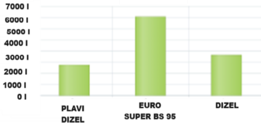
Slika 5. Izgled sonde u programu koji prati stanje spremnika

Pri izradi ispisa sonde na agregatima ne smije nitko točiti gorivo jer bi moglo doći do netočnog očitavanja. Otvaranje spremnika za istakanje goriva vrši siti zaposlenik koji je zaprimio papire, nakon provođenja aktivnosti u programu vezanih uz primku goriva. Otvaranje spremnika vrši se izuzetno oprezno da ne bi došlo do degradacije goriva, koja bi izazvala materijalnu štetu i široki niz mjera provjera kvalitete, ili čišćenja ovisi o vrsti degradacije. Nakon otvaranja spremnika za preuzimanje goriva i kontrolira se vozača cisterne koje gorivo spaja iz kojih komora u autocisterni, da bi sve odgovaralo papirologiji koja je prethodno navedene i provjerena.