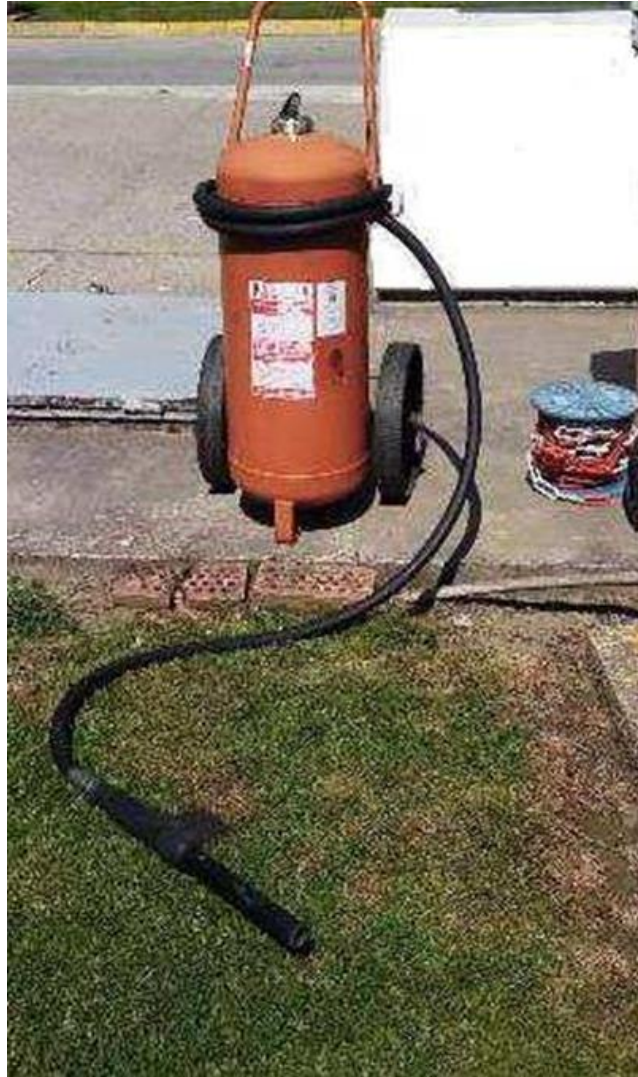
Slika 6. Vatrogasni aparat S50

(Vatrogasna oprema redovito se servisira te se kontinuirano vodi briga o ispravnosti i vijeku trajanja iste). Autocisterna se spaja na uzemljenje, što se obavlja kablom koji se nalazi u blizini svih spremnika za istakanje goriva i kao takav je obavezna mjera zaštite. Slika 7. prikazuje stup s kablom za uzemljenje koji se mora nalaziti u blizini svih mjesta za zaprimanje goriva, za punjenje rezervoara agregata.