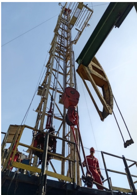
Slika 21. Rad djelatnika na radnom podištu RP NAT-3 [3]

sigurno penjanje, spuštanje i kretanje po radnom podištu. Rad na radnom podištu prikazan je na slici 21.