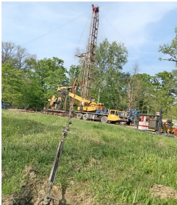
Slika 16. Sidrena užad RP NAT-3 [3]

pregleda ravnina tornja. Nakon toga potrebno se uvjeriti da sve noge leže čvrsto na potporama. Zatim se postavi vjetrena užad, krune tornja i platforme tornjaša prema preporukama tipa vjetrene užadi. Zategnutost se podesi tako da progib bude 152,40-254 mm. Usidren toranj je vidljiv na slikama 16. i 17.