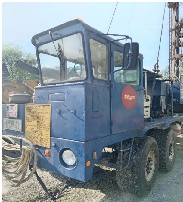
Slika 17. Sidrenje prednjeg kraja RP NAT-3 [3]