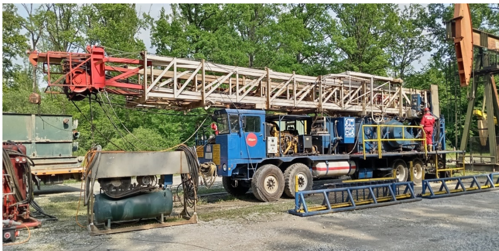
Slika 12. RP NAT-3 navezeno na ušće bušotine [3]

Slika broj 12. prikazuje navezeno RP NAT-3 na ušće bušotine.