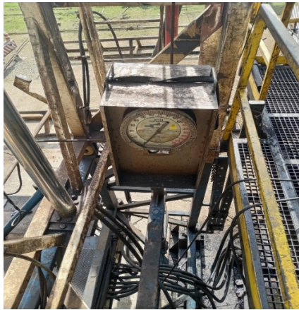
Slika 20. Indikator težine na RP NAT-3 [3]

Kvaliteta radnog užeta i briga o radnom užetu (poglavlje 3.9.) je s toga od iznimne važnosti. Osim radnog užeta druga dva najbitnija segmenta opreme prilikom rada koja ne smiju zakazati su indikator težine tereta (tip Atlas Clipper) i hidraulički sistem preko kojeg se izvršavaju komande na komandnoj ploči. Indikator težine se redovno kontrolira i servisira kod ovlaštenog servisera. Prikazan je na slici 20.