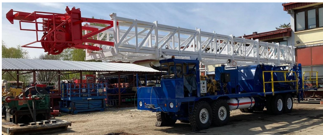
Slika 9. Remontno postrojenje NAT-3 nakon servisa [3]