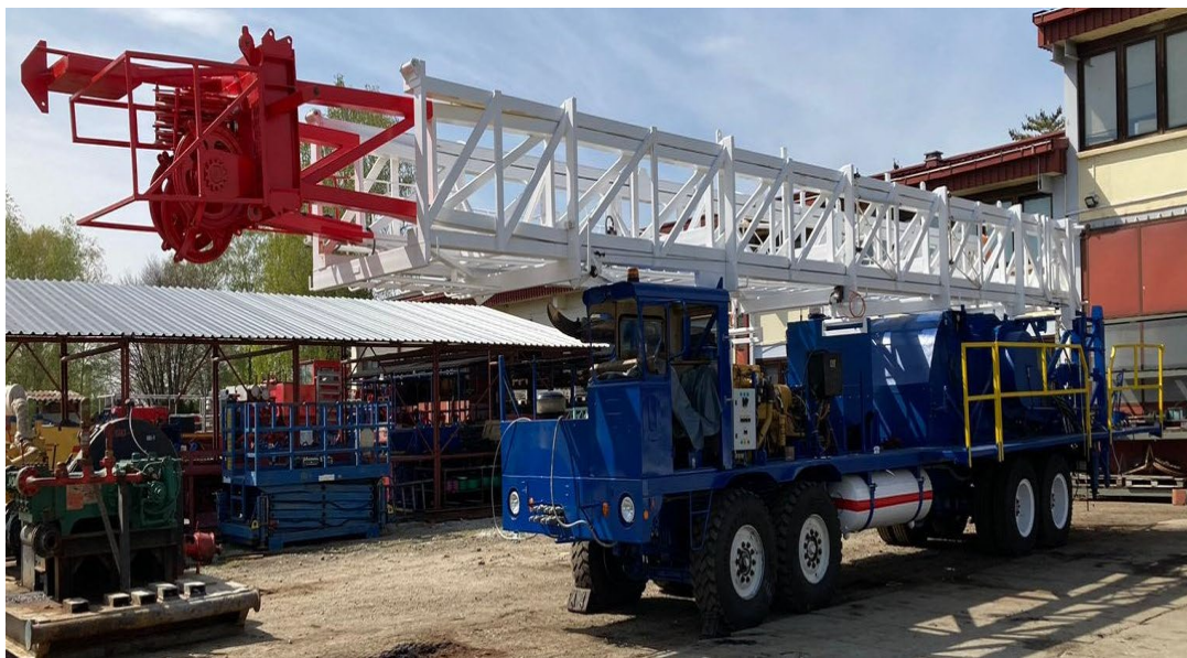
Slika 1. Remontno postrojenje NAT-3 [3]

Remontno postrojenje National-3 spada u klasu vozila radni stroj (Slika 1. prikazuje RP NAT-3). Proizvedeno je 1985. god. od strane kompanije Armco National suplay company (Houston, Texas, SAD). Dizalica postrojenja je model 450 sa dva bubnja. Postrojenje je dugačko 17,494 m, široko 2,8448 m, visoko 4,185 m. Težina postrojenja je 38,646 tona. Nosivost tornja na nepomičnom koloturju 102,15 tona. Maksimalno dopuštena sila na bubnju je 18 tona. U praksi se RP NAT-3 koristi kao 80 tonsko postrojenje (najveća dopuštena težina tereta na indikatoru težine) i spada u grupu 2 remontnih postrojenja kao dio flote kompanije Crosco. Snaga pogonskog motora iznosi N= 261 kW. Nazivna visina tornja (od nivo zemlje do podnožja nepomičnog koloturja) u uspravnom položaju je 29,26 m [2].