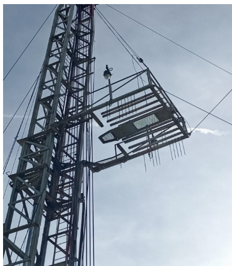
Slika 22. Finger na RP NAT-3 [3]

Finger je dio RP NAT-3 koji se koristi samo u slučaju uvlačenja radnog niza (tubinga ili BŠ) u finger. Da bi se niz cijevi mogao staviti u finger na fingeru tj. u tornjaškoj kućici se mora nalaziti radnik na poziciji tornjaša. Tornjaš mora biti osposobljen za rad na visini i mora znati kako u slučaju havarije (pada tornja) reagirati i koristiti sigurnosnu sajlju po kojoj će se brzinski spustiti na tlo. Slika 22. prikazuje finger RP NAT-3.