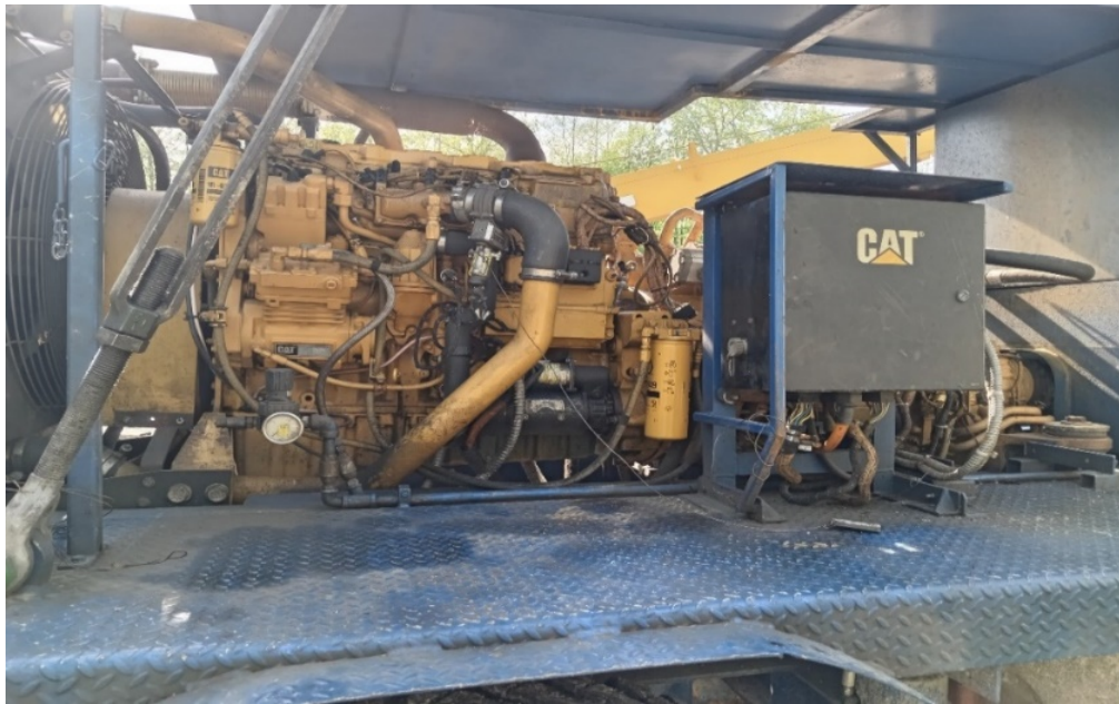
Slika 5. Motor RP NAT-3 [5]

Postrojenje ima motor Caterpillar model C9. Dijelovi motora su: motor, mjenjač, kutni reduktor. Motor je opremljen sa filterima goriva, usisnog zraka i motornog ulja. Motor se pokreće pomoću hidrostartera. Ispušni sistemi su opremljeni sa iskrolovcima [2]. Slika 5. prikazuju motor RP NAT-3.