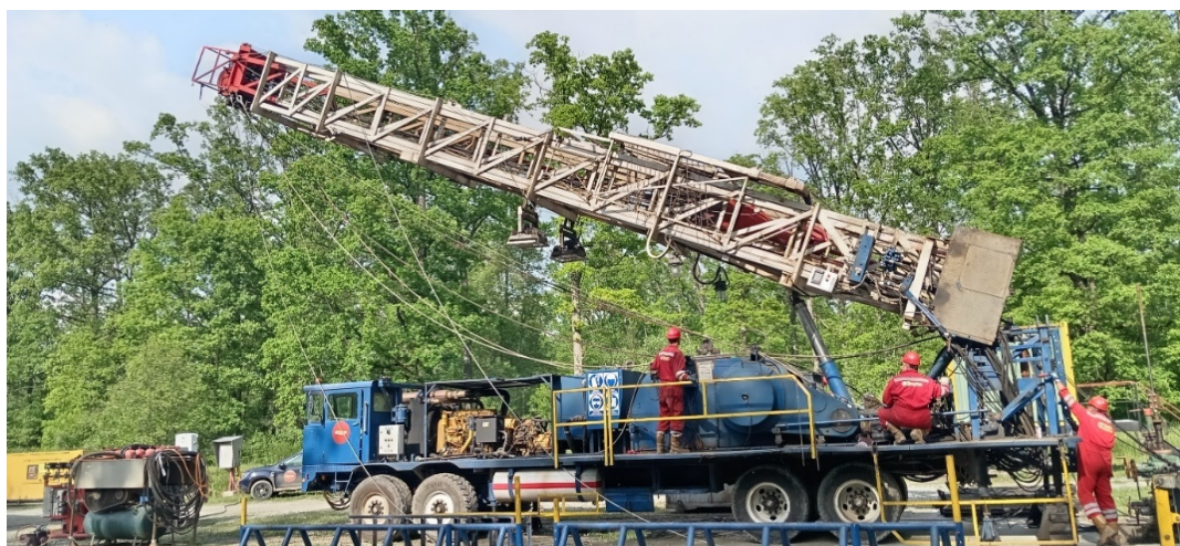
Slika 14. Podizanje prve sekcije tornja RP NAT-3 [3]

Na kraju operacije obavezno isključiti pumpu i rasteretiti tlak u hidrauličnom sistemu na način da se nekoliko puta ručica za podizanje tornja postavi u gornju poziciju za dizanje i u donju poziciju za spuštanje.