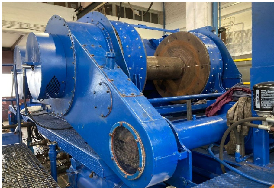
Slika 2. Dizalica [4]

Dizalica se sastoji od dva bubnja model 450. Osnovni dijelovi dizalice su: glavni bubanj, kočnice glavnog bubnja, tarne obloge pojasne kočnice, kočioni mehanizam pojasne kočnice, spojka glavnog bubnja, bubanj za klipovanje, kočnica bubnja za klipovanje, spojka bubnja za klipovanje, pogon bubnjeva. Slika 2. prikazuje dizalicu RP NAT-3 [2].