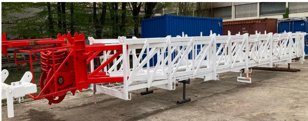
Slika 8. Toranj nakon servisa [3]

Na slikama 8. i 9. prikazan je toranj su toranj RP i samo RP NAT-3 nakon 5-godišnjeg servisa.