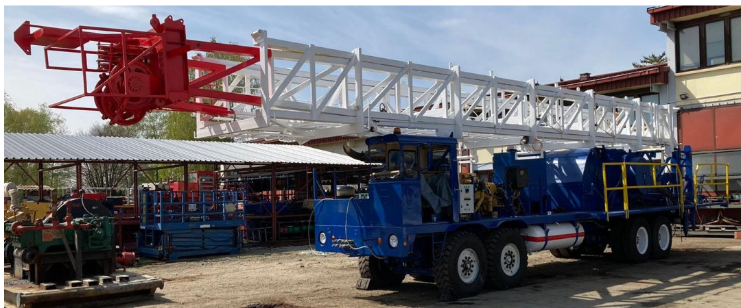
Slika 9. Remontno postrojenje NAT-3 nakon servisa [3]