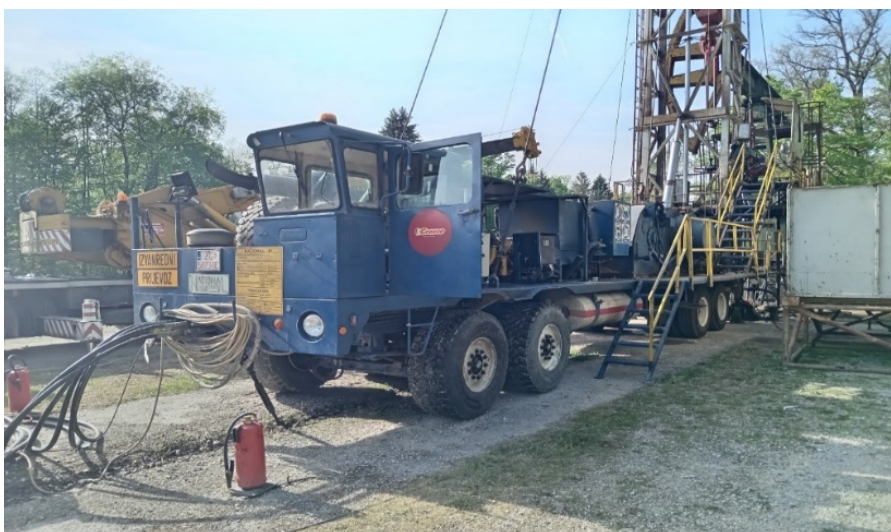
Slika 4. Vozilo [5]

Vozilo je E kategorije (radni stroj). Dijelovi vozila su: šasija, kabina, osovinski slog, hidrauličke potporne noge, servisno hidrauličko vitlo, rezervoari za gorivo, kutija za alat, osvjetljenje vozila, hidraulički rezervoar, rezervoar za rashladnu vodu kočnica, rezervoar za hidrodinamičku pomoćnu kočnicu Parmac 122, hidrodinamička pomoćna kočnica Parmac 122 [2]. Slika 4. prikazuje vozilo.