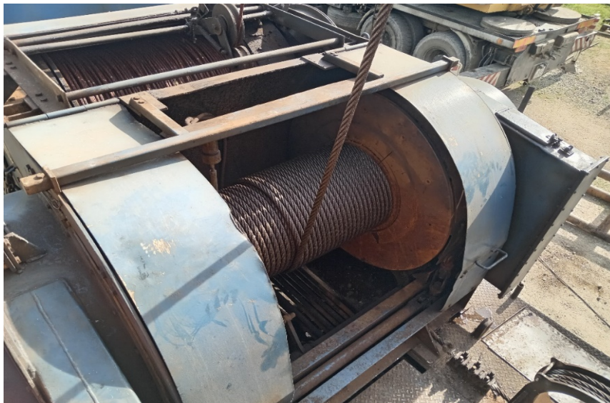
Slika 6. Radni bubanj, radno uže i kočione obloge radnog bubnja [5]

To su: filter za ulje, filter za gorivo, radno uže, uže za klipovanje, kočione obloge radnog bubnja, kočione obloge bubnja za klipovanje, klinasto remenje (ventilator, kompresor, alternator) [2]. Slika 6. prikazuje radni bubanj, radno uže i kočione obloge radnog bubnja.