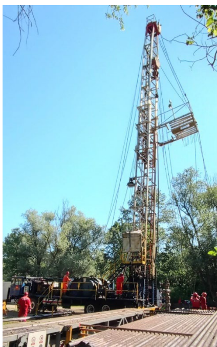
Slika 15. Podizanje gornje sekcije tornja RP NAT-3 [3]

Provjeriti da li je sva užad (od platforme tornjaša i platforme za klipne šipke) slobodna. Nakon toga treba otpustiti odzračni ventil (1 komad) na teleskopu za podizanje gornje sekcije, ručicu za podizanje gornje sekcije staviti u položaj - "dizanje" - kada procuri ulje bez zraka na odzračnom ventilu staviti ručicu u neutralni položaj i zategnuti odzračni ventil. Zatim se podigne poluga uvlačenja klinova, da se klinovi uvuku. Ručica se postavi u položaj "izvlačenje gornje sekcije", gornja sekcija toranja se polako izvlači dok se paralelno odmotava radno uže. Potrebno je obaviti Provjeru da li se stabilizator cilindra podižu na pravo mjesto. Podizanje gornje sekcije tornja je vidljivo na slici 15. Prilikom podizanja gornje sekcije kontrolirati tlak hidrauličkog sistema i paziti na užad i opremu. Kad se gornja sekcija približi vrhu, potrebno je djelomično spustiti ručicu "izvlačenje gornje sekcije". Treba provjeriti da li je toranj dovoljno visok i dali su klinovi za uklinjenje gornje sekcije izbačeni. Zatim se Pažljivo spušta ručica "izvlačenje gornje sekcije" dok klinovi za uklinjenje ne dođu u sjedišta. Vizualno se provjeri da li su sva četiri klina potpuno izbačena i pravilno smještena [2]. Na kraju operacije potrebno je obavezno isključiti pumpu i rasteretiti tlak u hidrauličnom sistemu na način da se nekoliko puta ručica za spuštanje i dizanje gornje sekcije nekoliko puta spusti u poziciju za spuštanje gornje sekcije.