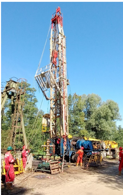
Slika 23. Spuštanje tornja na RP NAT-3 [3]

Kod operacije spuštanja tornja (prikazano na slici 23.) potreban je jednak oprez kao i kod operacije dizanja tornja. Svi radnici moraju zauzeti svoje pozicije, pratiti i komunicirati kako bi se uspješno izvela operacija. Slijed radnji je ubiti obrnut od radnji kod dizanja tornja. Uvijek se prvo otpušta sidrena užad koja se zatim demontira. Kod spuštanja tornja prvo je potrebno otpustiti odzračne ventile (2 komada) na teleskopu za prekret tornja, ručicu za prekret tornja staviti u položaj "dizanje". Kada procuri ulje bez zraka na odzračnom ventilu staviti ručicu u neutralni položaj i zategnuti odzračni ventil na kojem je procurilo ulje. Nakon toga gurnuti ručicu u položaj "spuštanje" i kada procuri ulje bez zraka na odzračnom ventilu, staviti ručicu u neutralni položaj i zategni odzračni ventil.