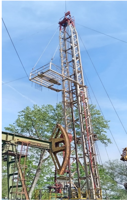
Slika 3. Toranj [5]