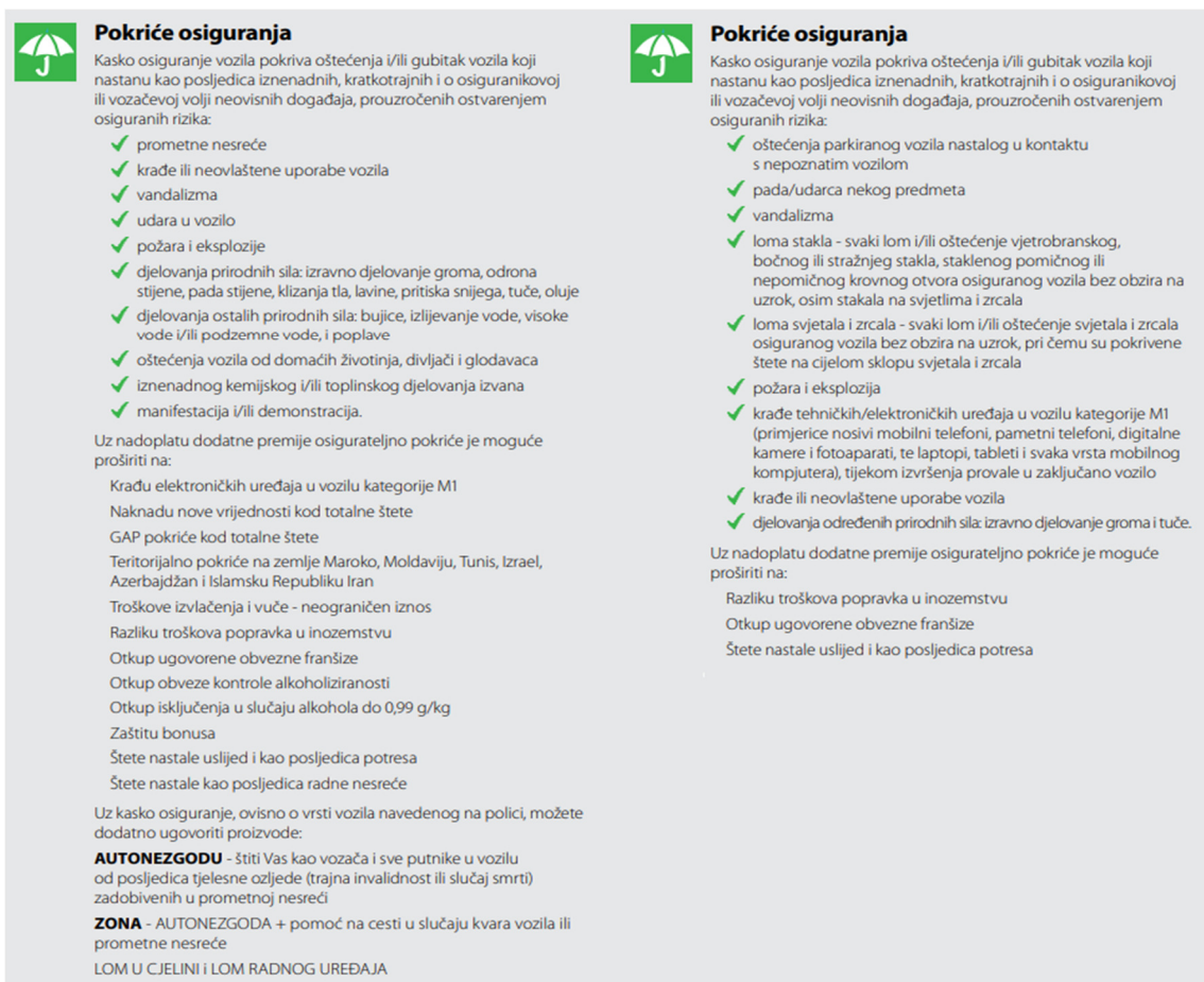
Slika 3: Osigurateljno pokrća Euroherc osiguranja puno i djelomično kasko osiguranje [14]

Prema odredbama Uvjeta o osiguranju osiguravajućeg društva Euroherc osiguranje d.d. moguće je ugovoriti puno i djelomično kasko osiguranje vozila. [14] Važno je spomenuti kako se može proširiti osigurateljno pokrća na dodatne rizike koji su isključeni iz pokrća, na način da se ugovori dodatno pokrća uz obveznu nadoplatu premije osiguranja.