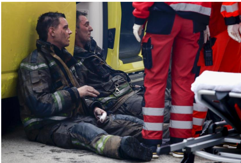
Slika 4. Vatrogasci nakon gašenja strukturnog požara [5]

Engleska vatrogasna zajednica financirala je istraživanje koje je provelo Sveučilište Lancashire s ciljem detaljnijeg uvida u opasnosti koje predstavlja zaštitna oprema vatrogasaca. Istraživanje je provedeno na 10.000 vatrogasaca s ukupno prikupljenih 1000 uzoraka zaštitne opreme vatrogasnih postrojbi iz cijele Engleske. Glavni zaključci istraživanja su da vatrogasci imaju i do četiri puta veću šansu od razvijanja nekog oblika karcinoma u odnosu na opću populaciju. Veliki dio unosa produkata gorenja u organizam dolazi upravo iz apsorpcije kroz kožu te faktor apsorpcije kože, porastom temperature, može doseći i do 400% normalne vrijednosti. Znanstvenici koji su proveli istraživanje kao rješenje navode pravilno i često održavanje, odnosno obaveznu dekontaminaciju zaštitne opreme nakon svake izloženosti produktima gorenja. Kontaminirana zaštitna oprema predstavlja veliku opasnost, osobito kod ponovnog izlaganja povišenim temperaturama, zbog povećanja faktora apsorpcije kože koji može doseći spomenutih 400% i tako unijeti u organizam veće koncentracije opasnih štetnih spojeva. Slika 4. u nastavku teksta prikazuje izgled vatrogasaca i njihove opreme nakon gašenja strukturnog požara. [30]