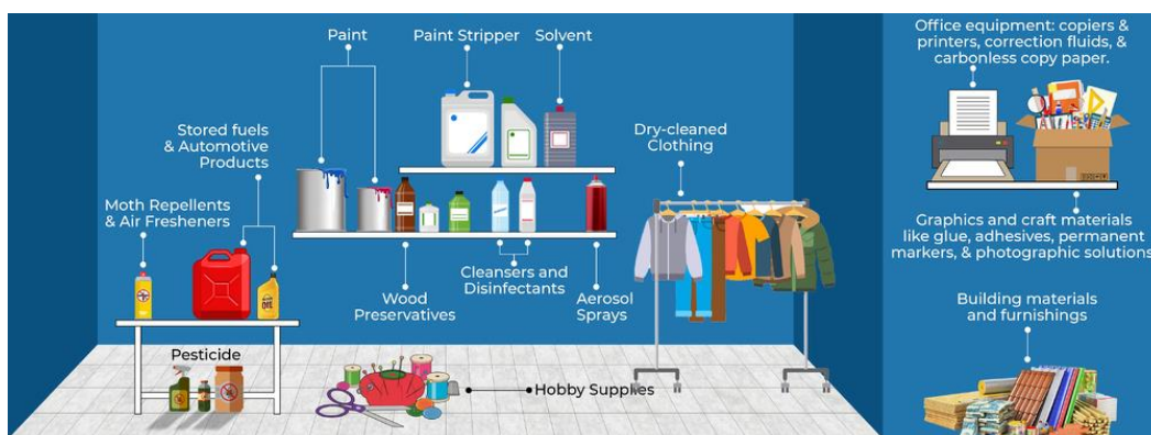
Slika 2 Hlapljivi organski spojevi u blizini čovjeka. [22]

Slika 2. u nastavku prikazuje ilustraciju izvora hlapljivih organskih spojeva u blizini čovjeka.