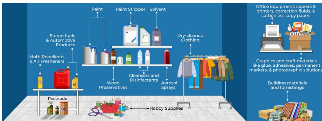
Slika 2 Hlapljivi organski spojevi u blizini čovjeka. [22]

Slika 2. u nastavku prikazuje ilustraciju izvora hlapljivih organskih spojeva u blizini čovjeka.