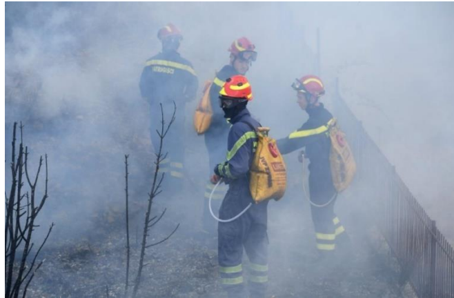
Slika 3. Vatrogasci na gašenju šumskih požara [29]