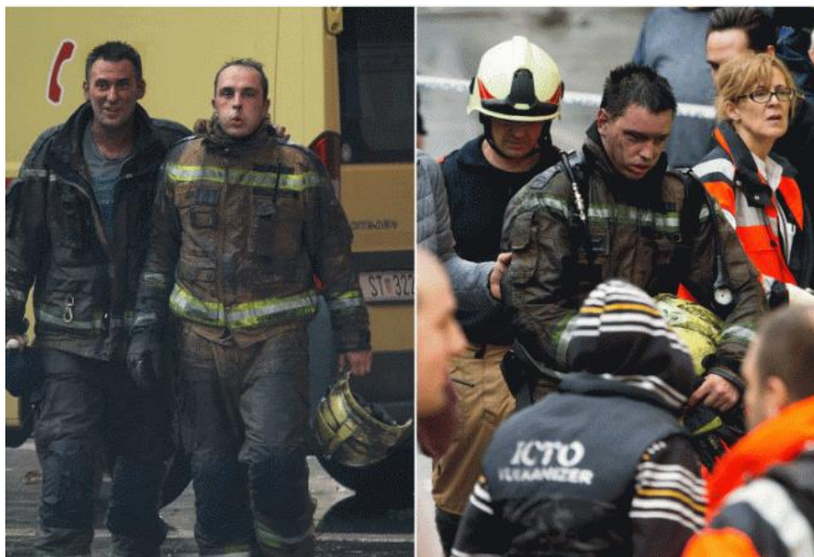
Slika 1. Čađa na zaštitnoj odjeći vatrogasaca. [5]

otpornosti u okolišu, spojevi koji sačinjavaju čađu talože se i vežu za zaštitnu odjeću i opremu koju vatrogasci koriste tijekom rada na intervencijama gašenja požara. Ako se zaštitna oprema i odjeća redovno ne održava i čisti, nakupljeni kemijski spojevi čađe apsorbacijom kroz kožu ulaze u organizam vatrogasaca te tako narušavaju njihovo zdravlje. [3] Slika 1. u nastavku prikazuje količinu čađe koja se zadržava na odjeći vatrogasaca tijekom jedne intervencije.