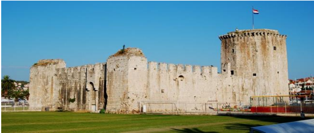
Slika 1. Tvrđava Kamerlengo