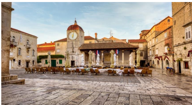
Slika 3. Gradska loža