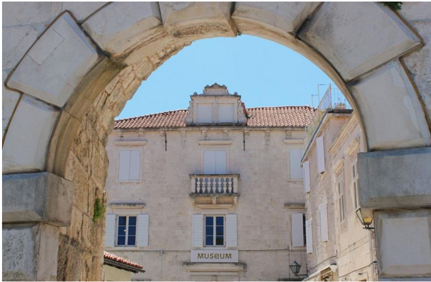
Slika 4. Gradski muzej