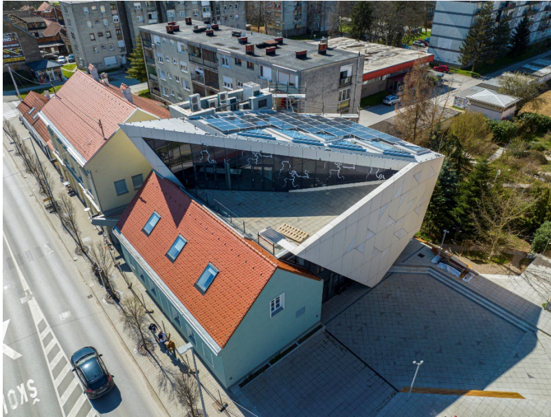
Slika 5. Nikola Tesla Experience Center