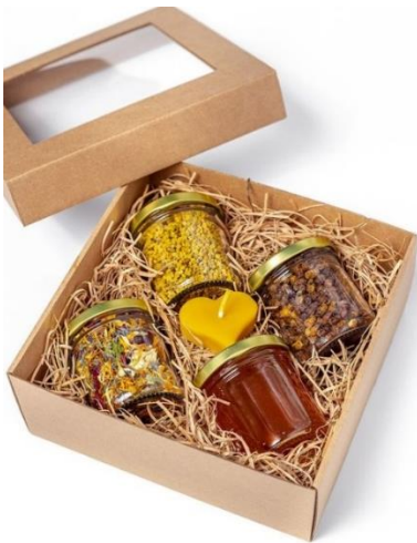
Slika 15. Kutija sa papirnatim punjenjem