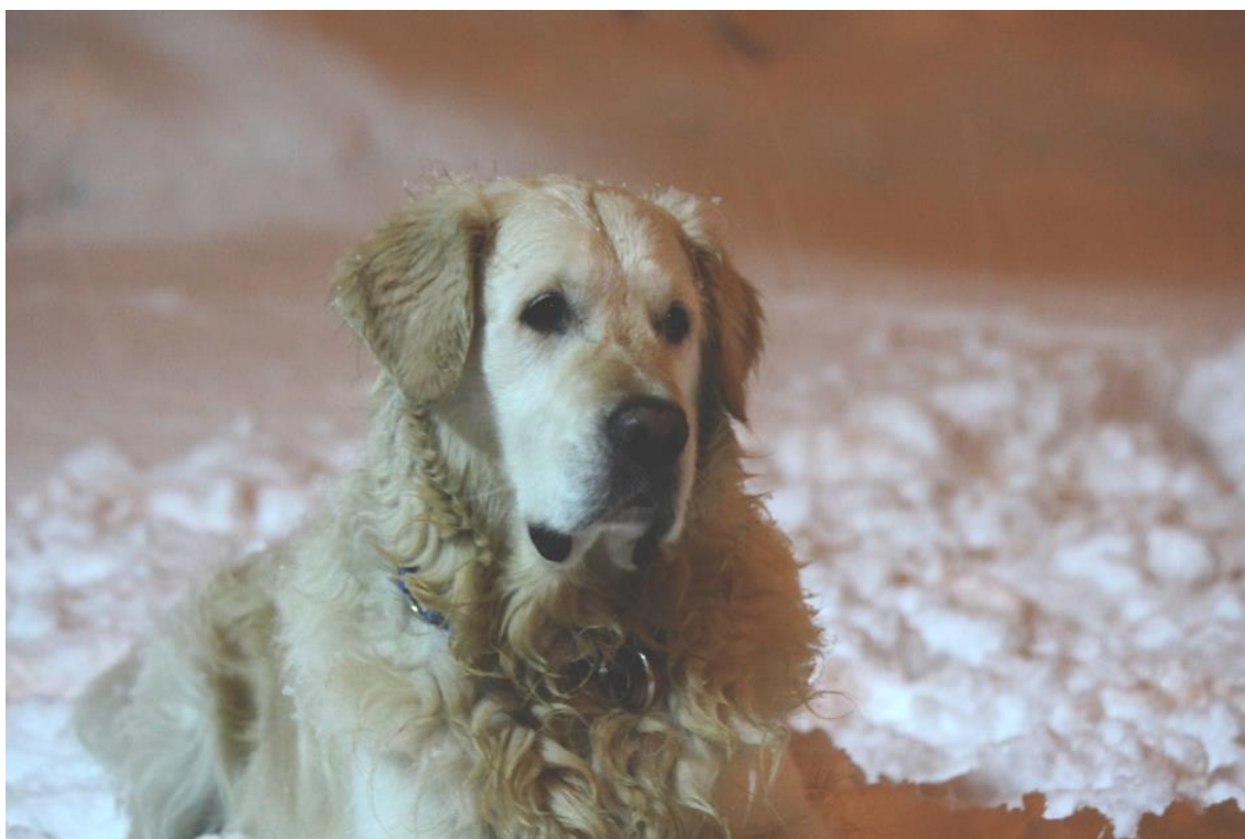
Slika 1 Primjerak zlatnog retrivera

Pasmina uravnoteženog karaktera s velikim fokusom na ljude pogotovo svog vlasnika. Uz pravilan odgoj i brigu ovu pasminu se može oblikovati u veoma stabilnog i veoma privrženog pratioca kroz život (MALLOY, 2003). Svojom inteligencijom, privrženošću i svojom prilagodljivošću kod promatrača znaju ostaviti utisak kao da čita želje svom vlasniku iz očiju, a ustvari to je pasmina koja ima potrebu „ugađati“ svome vlasniku.