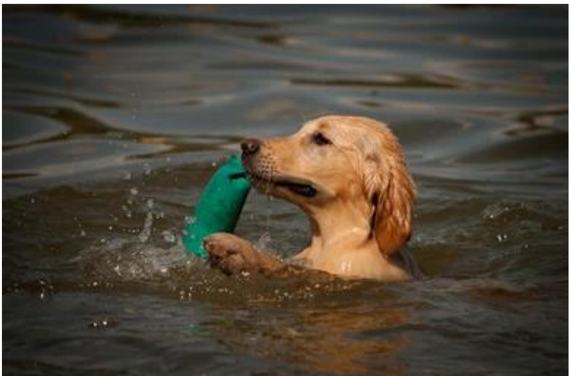
Slika 9 Štene retrivera u vodi - trening aporta sa igračkom