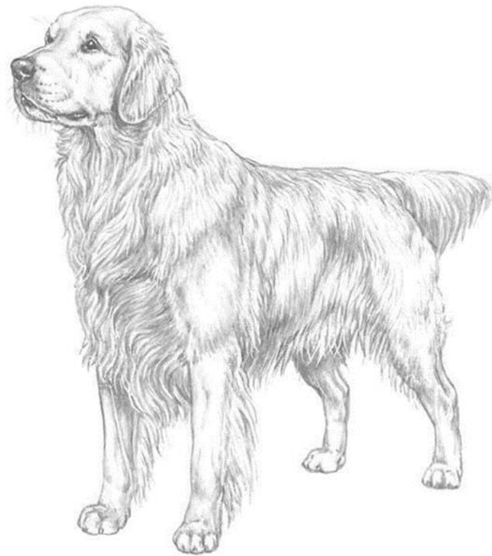
Slika 3 Ilustracija zlatnog retrivera (izvor: ©M.Davidson, ilustr. NKU Picture Library)

i zbog toga imaju potrebu ugađati svojim vlasnicima te uživaju u obavljanjima posla kao što je donošenje stvar, pomaganje, pratnje ili bilo kakve interakcije s ljudima.