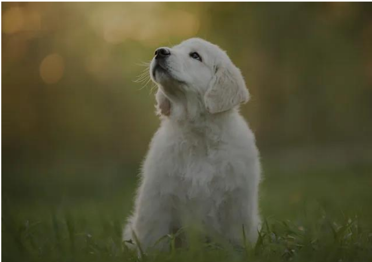
Slika 5 Štene zlatnog retrivera

Kada štene dođe u novi dom, novi vlasnik postaje odgovoran pobrinuti se da se štenetov odgoj nastavi. Prvi tjedni štenetovog života oblikuju njegov karakter i veći dio njegove osobnosti (MALLOY, 2003). Nakon dolaska u novi dom, novi vlasnik trebao bi se posvetiti odgoju, socijalizaciji i dresuri šteneta. Dresura psa je mentalna i fizička vještina koja se uči (MALLOY, 2003). Dresuru štenaca može se započeti u vlastitom domu te se može odrađivati grupnim treninzima u školicama poslušnosti. Važna činjenica je da vlasnici pasa moraju biti ustrajni u treninzima. Pohađanje grupnog treninga samo je početak, ono što se tamo nauči mora se vježbati kod kuće. Treninzi kod kuće trebali bi se obavljati svakodnevno, ne trebaju biti dugi, bolje neka budu kratki, pet do deset minuta (MALLOY, 2003). I obavezno je način nagrađivanja šteneta, kako bi štene bolje i sa voljom učilo.