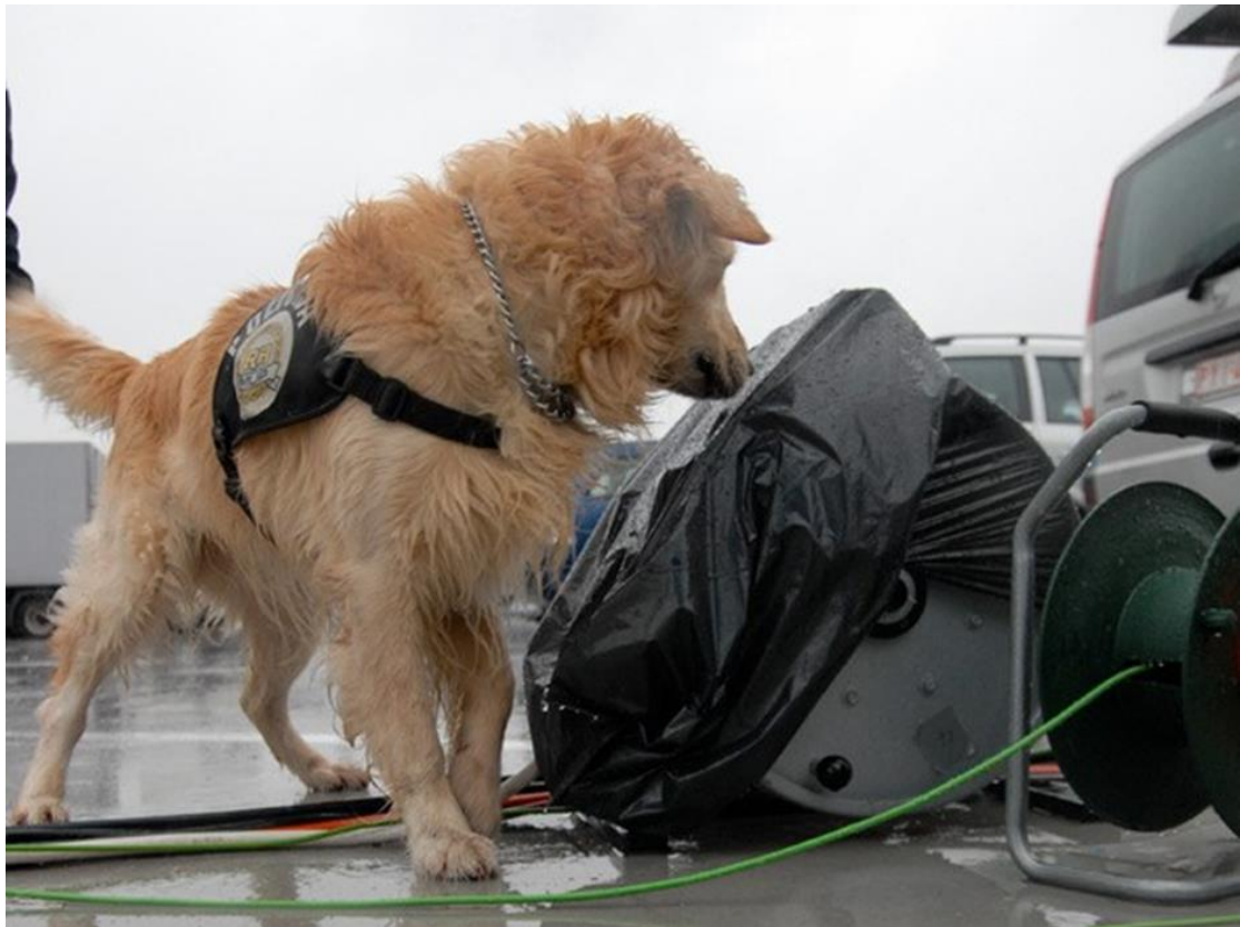
Slika 8 Zlatni retriver u potrazi za eksplozivom