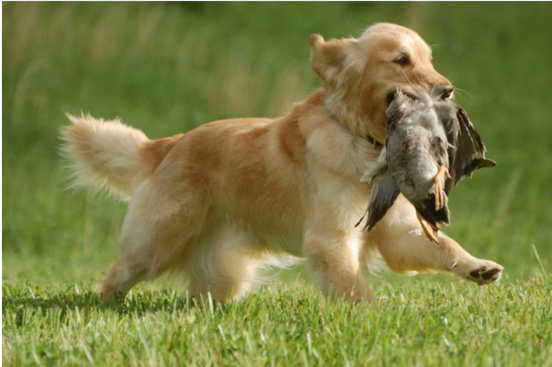
Slika 6 Zlatni retriver u aportu