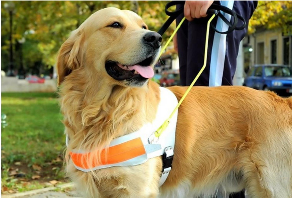
Slika 7 Zlatni retriver pomoćnik osobama sa invaliditetom