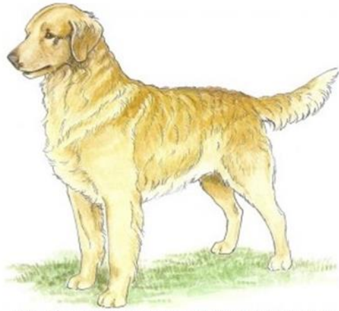
Belle, Tweedmouth Water Spaniel as depicted by Marcia Schlehr