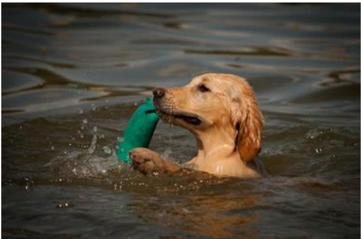
Slika 9 Štene retrivera u vodi - trening apporta sa igračkom