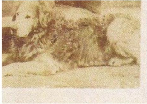
Nous, Wavy Coated Retriever

Slika 4 Slika roditelja prvog legla zlatnih retrivera, Bella i Nous