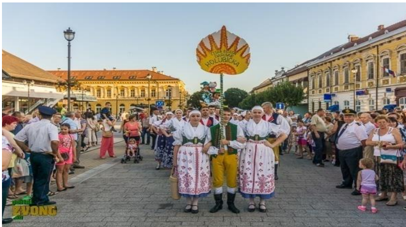
Slika 1: Dožinky, žetvene svečanosti Češke nacionalne manjine u Daruvaru

Žetvene svečanosti „Dožinky“ najveće je događanje češke manjine u Hrvatskoj. Svečanost se slavi još od 1925. godine, a obuhvaća bogati plesni, glazbeni, i folklorni program, povorku u narodnim nošnjama, alegorijska kola, povijesne etnografske i likovne izložbe, tradicionalni češki sajam starih obrta s kušanjem čeških jela (ANONYMUS, 2010).