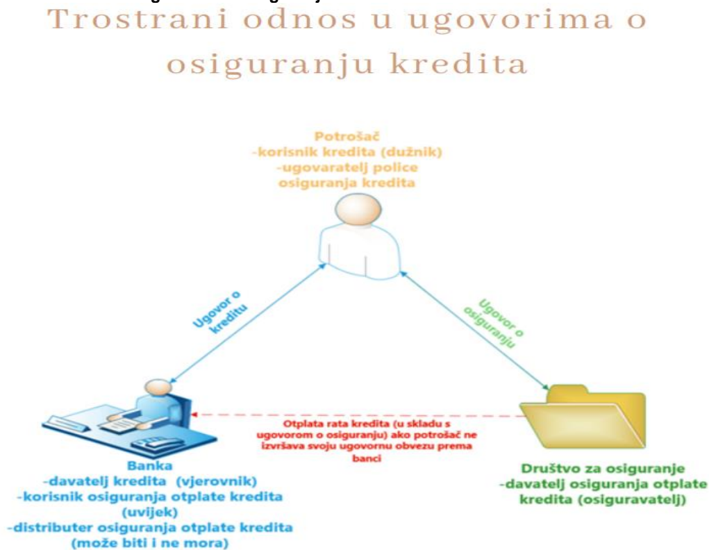
Slika 3 - Prikaz odnosa u ugovorima o osiguranju kredita