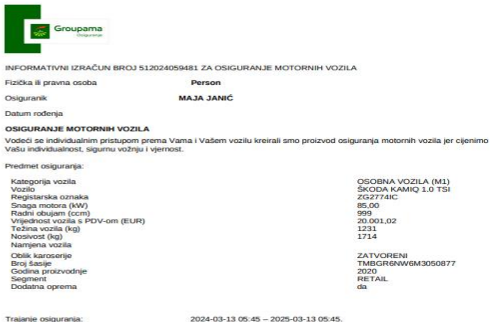
Slika 6 - Informativni izračun police za osiguranje motornih vozila – Groupama osiguranje

Groupama osiguranje nudi policu kasko osiguranja koja uključuje franšizu, što znači da osiguranik snosi dio troškova štete na vozilu prije nego što osiguravajuće društvo preuzme preostali iznos. Ova polica osigurava osnovnu zaštitu od automobilske odgovornosti, kao i pokriće štete na vlastitom vozilu, uključujući i krađu. Uz osnovnu kasu pokriva, dostupne su i dodatne opcije poput osiguranja od nesretnog slučaja, zaštite bonusa i asistencije na cesti, čime se osigurava sveobuhvatna zaštita koja pokriva sve ključne aspekte sigurnosti.