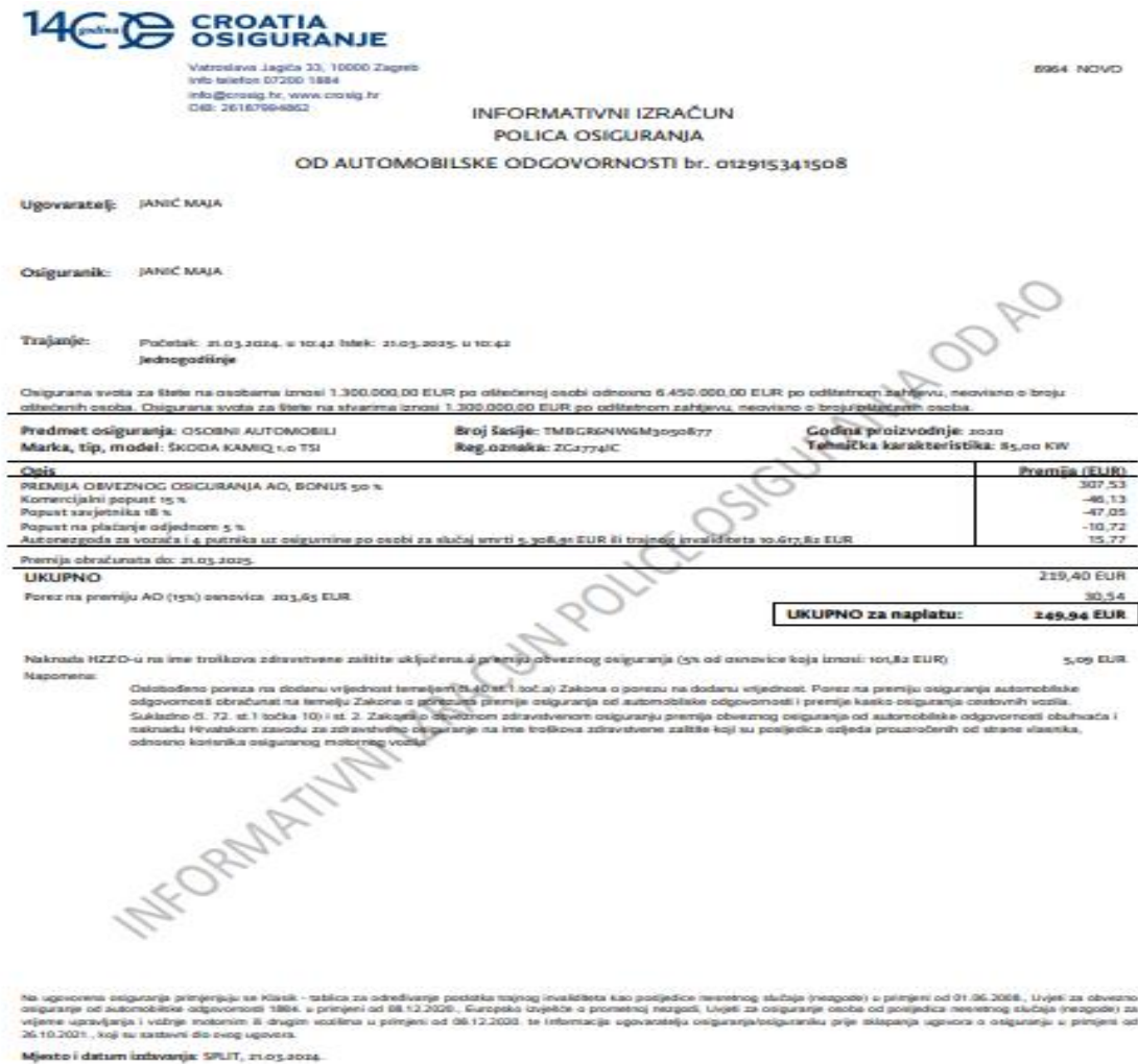
Slika 7- Informativni izračun police osiguranja od automobilske odgovornosti – Croatia osiguranje