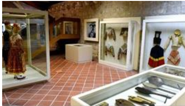
Slika 4. Ekspozicije Etnografskog muzeja (narodne nošnje i instrumenti)