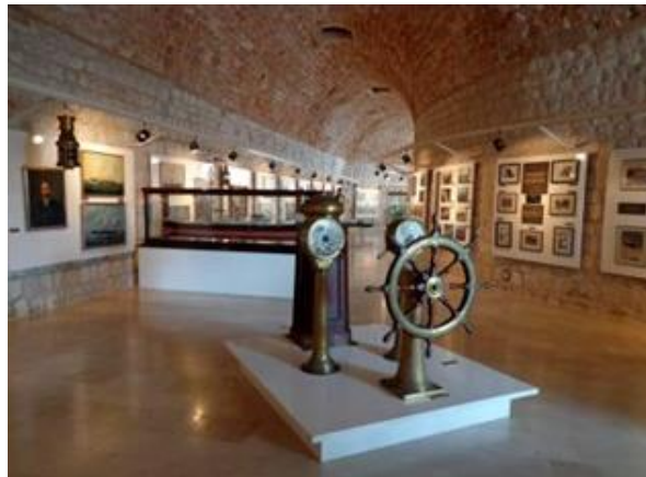
Slika 2. Ekspozicije Pomorskog muzeja