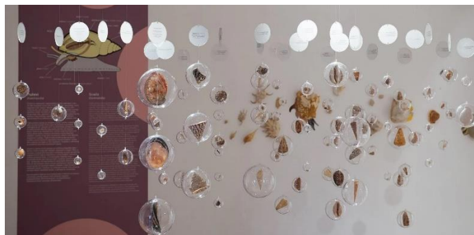
Slika 6. Ekspozicija Prirodoslovnog muzeja