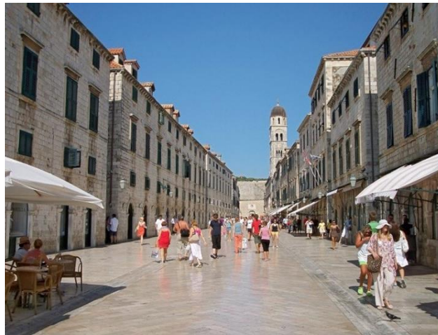
Slika 22. Stradun