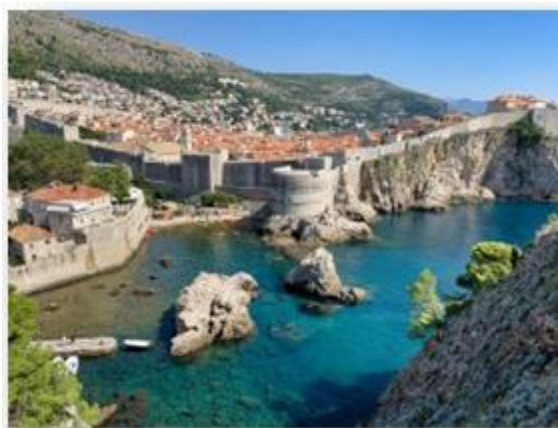
Slika 12. Dubrovačke zidine