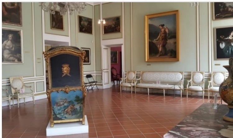
Slika 1. Ekspozicije Kulturno-povijesnog muzeja