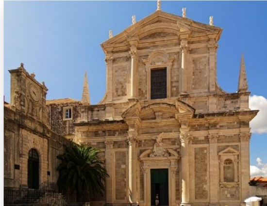
Slika 19. Crkva Svetog Ignacija