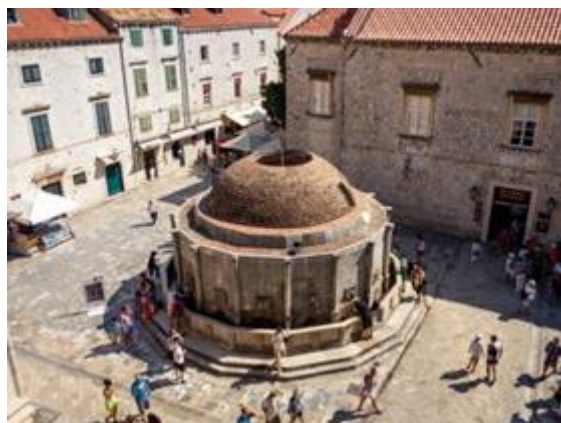
Slika 20. Velika Onforijeva česma