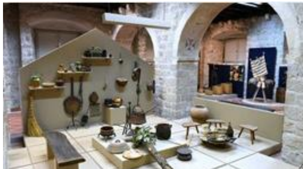
Slika 3. Ekspozicije Etnografskog muzeja (stari predmeti)