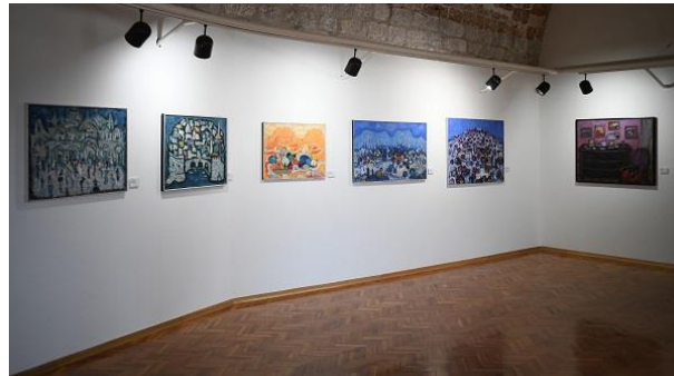
Slika 10. Ekspoziti atelijera Pulitika