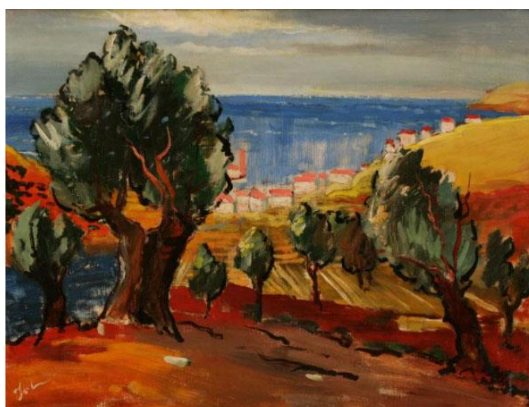
Slika 9. Ekspонат galerije Dulčić Masle Punitika