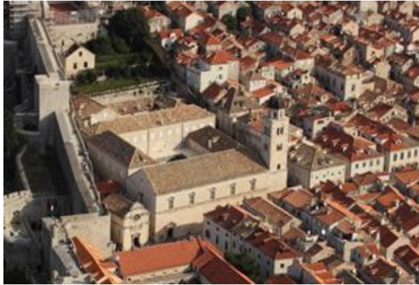
Slika 18. Franjevački samostan