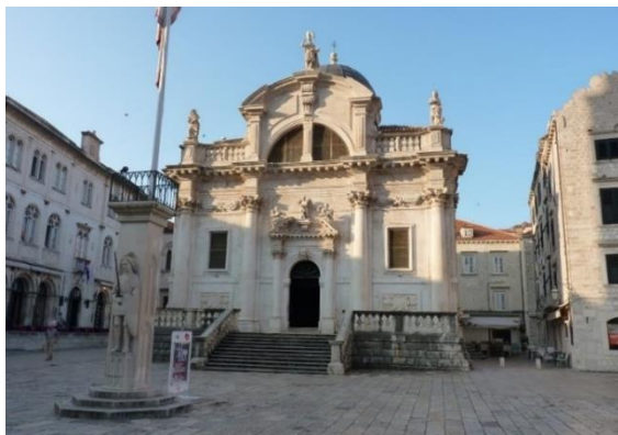
Slika 16. Crkva Svetog Vlaha