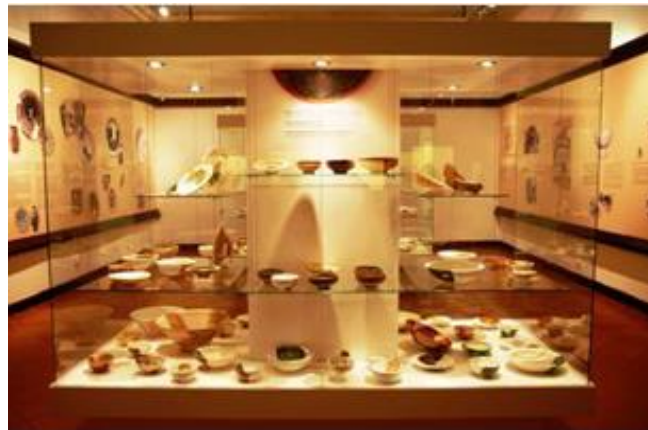
Slika 5. Eksponati Arheološkog muzeja