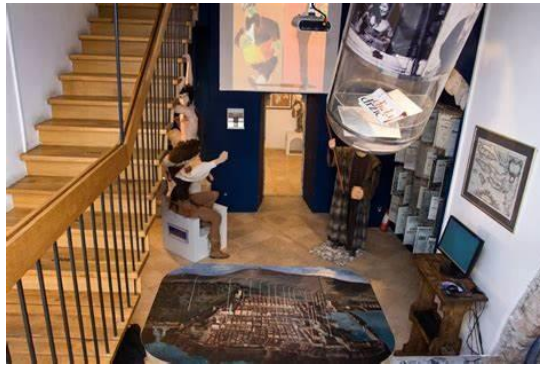
Slika 11. Ekspoziti doma Marina Držića