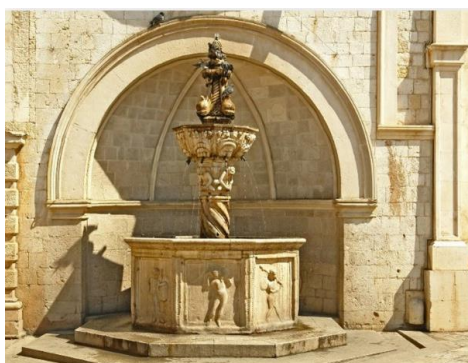
Slika 21. Mala Onforijeva česma