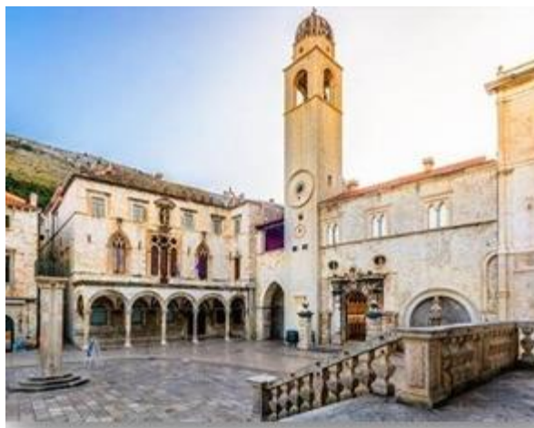
Slika 14. Palača Sponza