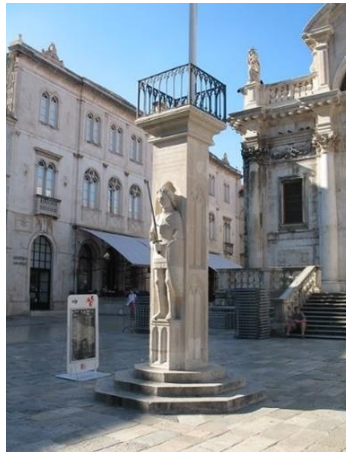
Slika 15. Orlandov stup