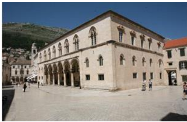
Slika 13. Knežev dvor