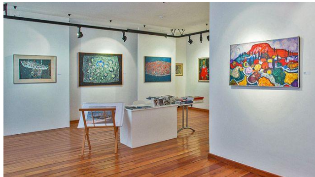
Slika 8. Ekspoziti Umjetničke galerije Dubrovnik