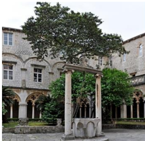
Slika 17. Dominikanski samostan