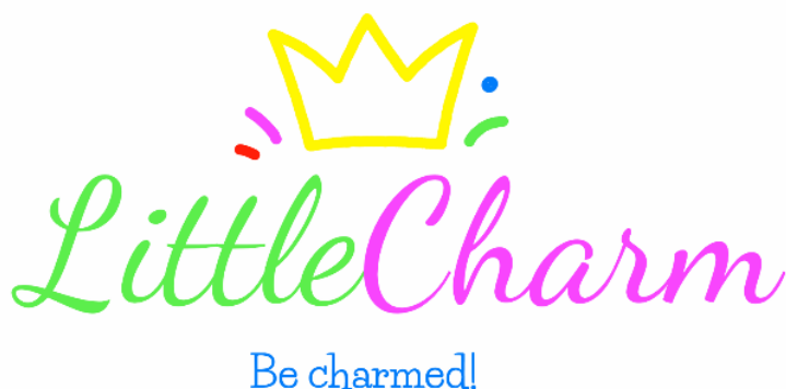
Ilustracija 10. Logotip LittleCharm

Ime poslovanja LittleCharm je u prijevodu mala srećonoša, mali šarm. Usprkos tome što su influenceri nametnuli “beige mom“ trend neutralnih boja dječjih proizvoda i trgovina, ipak većina roditelja preferira proizvode jarkih boja jer su i djeci zanimljiviji. Upravo zbog toga su boje brenda LittleCharm vesele, a font je nježan, rukopisan.