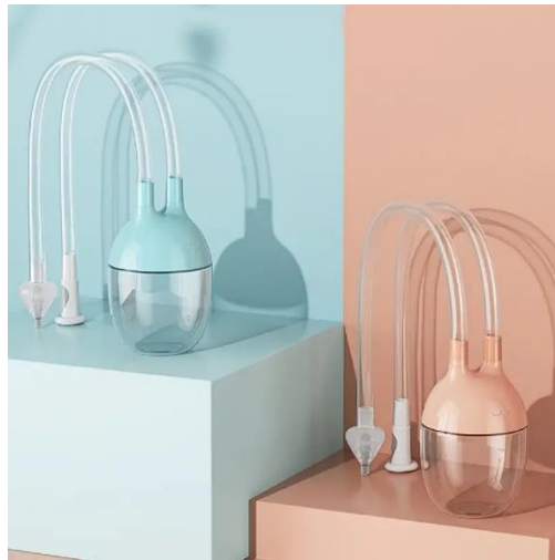
Ilustracija 9. Aspirator za nos