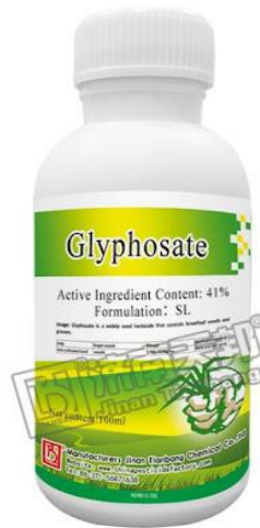
Slika 2. Pakiranje glifosata za primjenu u poljoprivredi

Do danas javnost zna za 41. vrstu kod koje je potvrđena otpornost (Ostojić i sur., 2018).