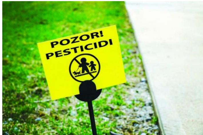
Slika 13. Znak koji pokazuje zagađenost tla pesticidima, izvor; (Ješić-Drinković, 2022).

Glifosat je bio predmet redovitih procjena nacionalnih i međunarodnih regulatornih agencija. Utvrđeno je da glifosat ima relativno nisku toksičnost kod sisavaca (Tarazona i sur., 2017). U ožujku 2015. Svjetska organizacija za istraživanje karcinoma (IARC) objavljuje Monografiju o toksikologiji 5 organofosfornih insekticida i o glifosatu, kojom ga se klasificira (skupina A2) kao tvar koja „vjerojatno uzrokuje karcinom kod ljudi“.