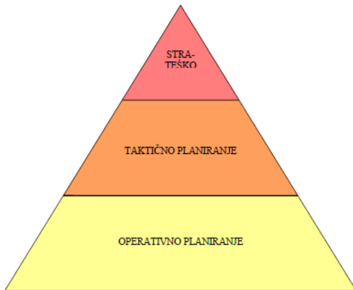
Slika 2. Razine planiranja