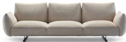
Slika 2: Unutarnja Buffa garnitura [6]

Prostorja d.o.o. u svojoj bogatoj ponudi nudi vanjske i unutarnje garniture, fotelje, taburee, naslonjače, stolice, stolove, stoliće i klupe, unutarnje garniture na razvlačenje, barske stolice, police i dodatke te ležaljke. [5]