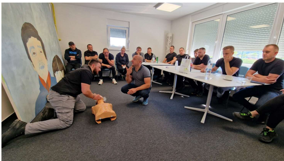
Slika 3: Tečaj prve pomoći

kojem su rizici svedeni na minimum, a radnici osposobljeni za pravilno pružanje prve pomoći u slučaju nesreće.