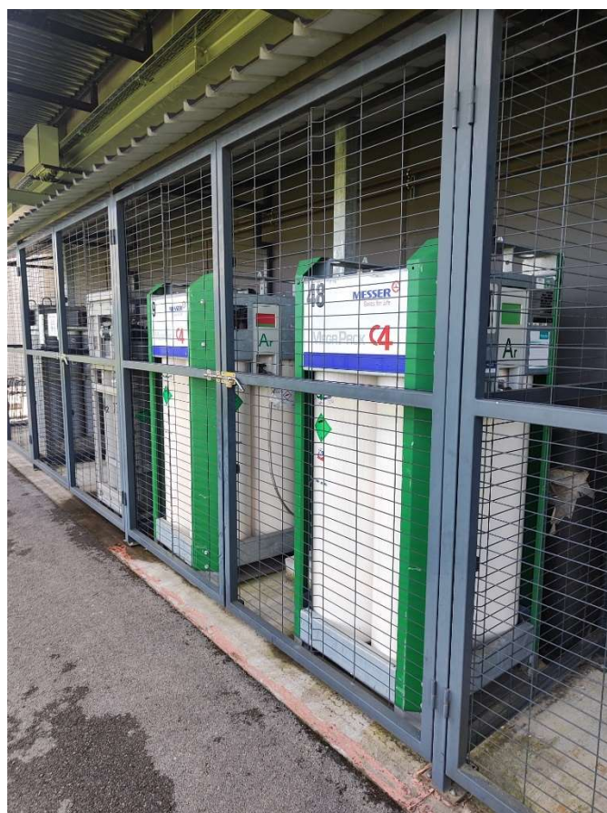
Slika 7: Boce pod tlakom za CO2 zavarivanje

Boce pod tlakom koje se koriste kod CO2 zavarivanja, također su propisano skladištene i osigurane.