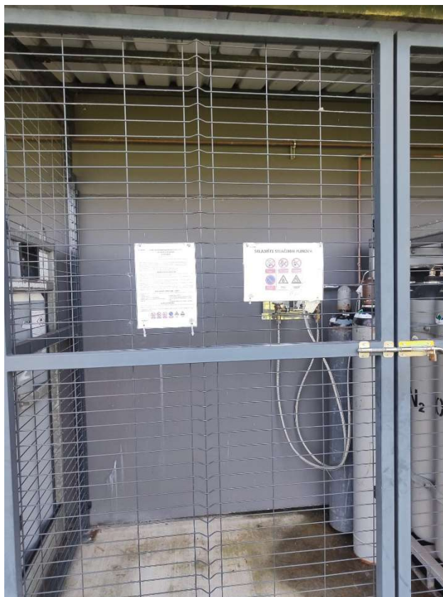
Slika 8: Upute za siguran rad

zabranjenog pušenja, zabranjene uporabe otvorenog plina, zabranjene uporabe alata koji iskri, zabrane parkiranja, opasnosti od požara te opasnost od eksplozije.