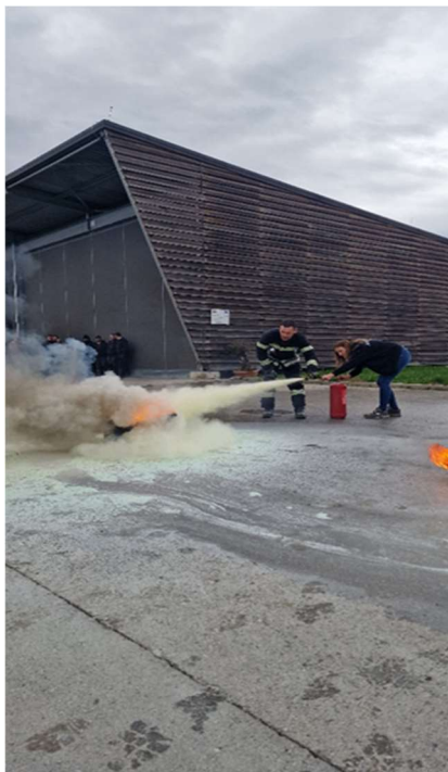
Slika 11: Praktični dio vatrogasne vježbe

Poznavanje osnovnih pojmova koje su povezane s praktičnom primjenom pomaže zaposlenicima da brže i učinkovitije reaguju u hitnim situacijama. Ovo razumijevanje omogućava zaposlenima da pravilno koriste vatrogasnu opremu, pravilno primjenjuju tehnike gašenja požara i slijede postupke evakuacije, čime se značajno smanjuje rizik od ozljeda i materijalne štete.