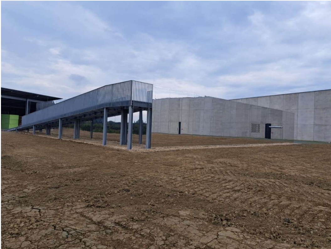
Slika 16: Sprinkler stanica