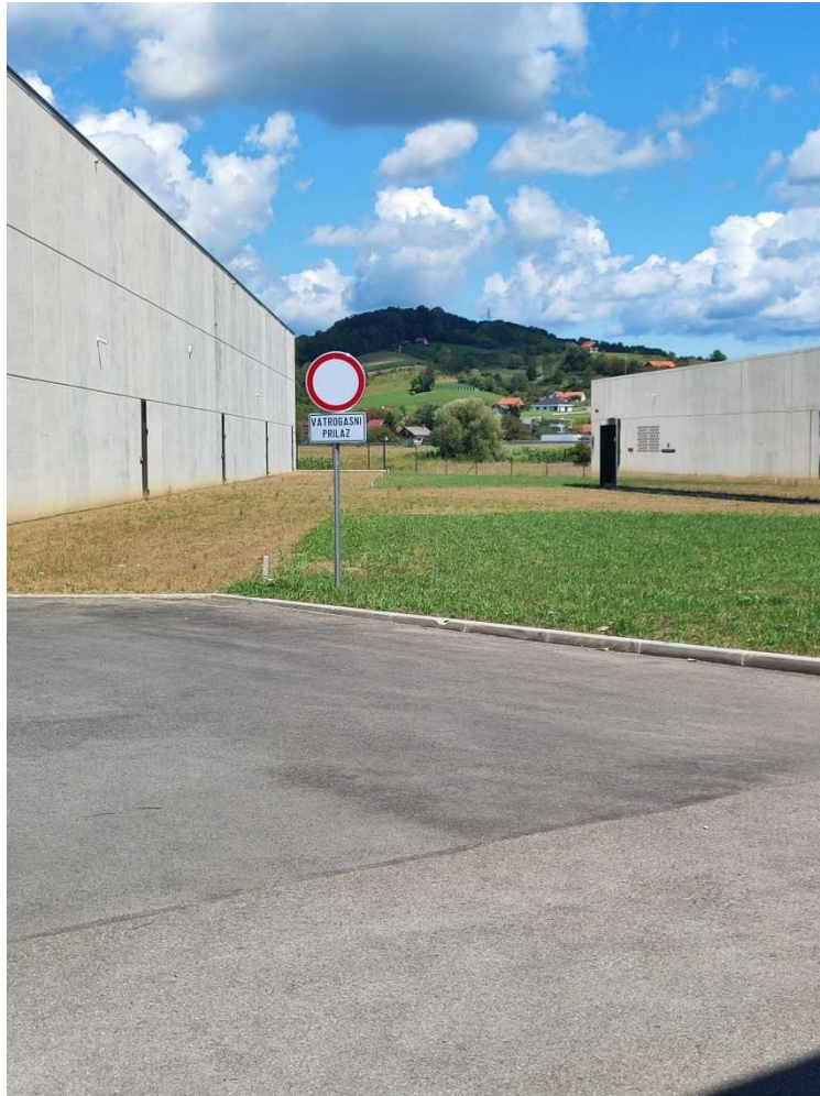
Slika 15: Vatrogasni pristup