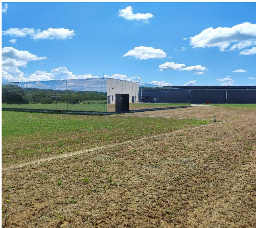
Slika 17: Ulaz u Sprikler stanicu