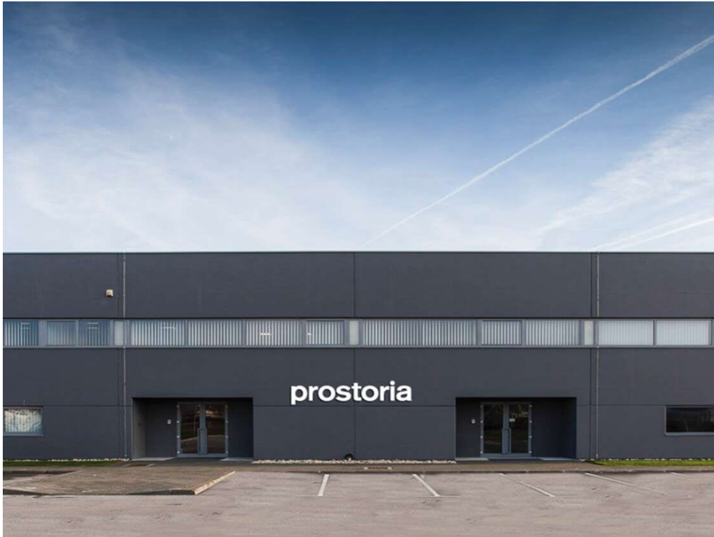
Slika 1: Prikaz poduzeća Prostorja d.o.o. [4]

Prostorja d.o.o. u svojoj bogatoj ponudi nudi vanjske i unutarnje garniture, fotelje, taburee, naslonjače, stolice, stolove, stoliće i klupe, unutarnje garniture na razvlačenje, barske stolice, police i dodatke te ležaljke. [5]