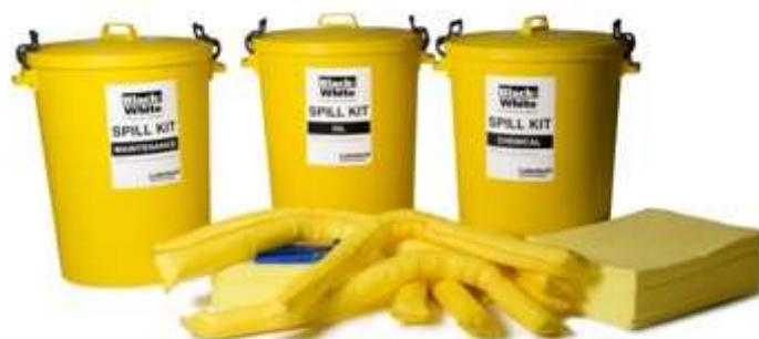
Slika 5: Eko set [7]

Postavljanjem ovih eko setova, osigurava se dodatna razina zaštite i sigurnosti u radu s kemikalijama, doprinosi se zaštiti okoliša i očuvanju zdravlja zaposlenika.