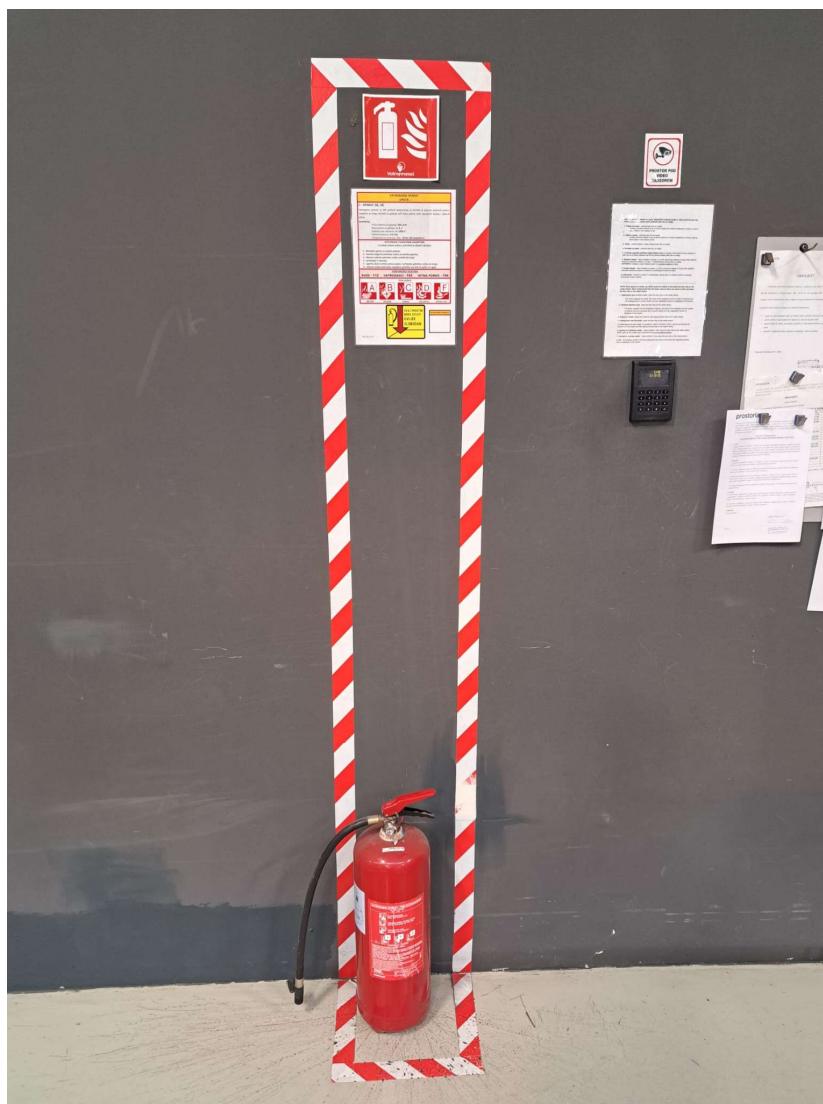
Slika 12: Požarni sektor opremljen aparatom za početno gašenje požara i uputama za korištenje

Hidrantska mreža predstavlja sustav cjevovoda, uređaja i opreme koji omogućava dovod vode od sigurnog izvora do zaštićenog prostora i građevina radi gašenja požara. Zaštita objekata uključuje projektiranje i izvođenje vanjskih i unutarnjih hidrantskih mreža. Vanjske hidrantske mreže sastoje se od nadzemnih ili podzemnih hidranata, dok unutarnje hidrantske mreže moraju biti dizajnirane tako da osiguraju potpuno pokrivanje prostora s najmanje jednim mlazom vode. Hidrantska mreža sadrži unutarnju i vanjsku hidrantsku mrežu. Unutarnja hidrantska mreža su zidni hidranti i pripadajuća oprema koja je