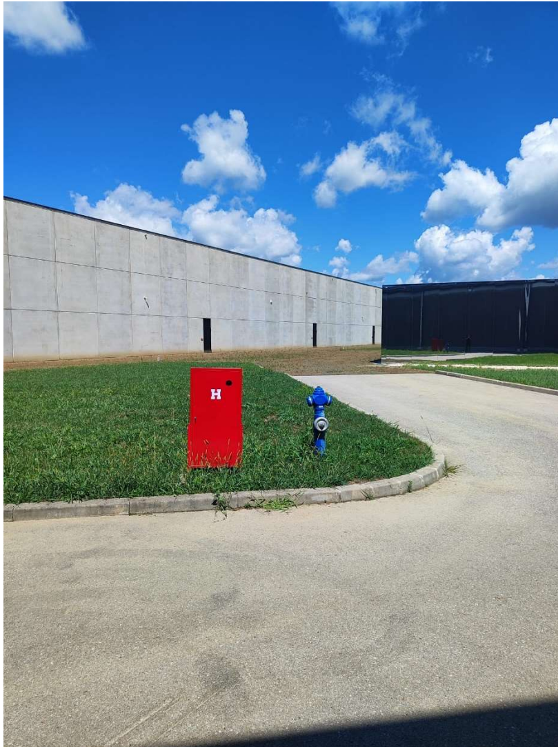
Slika 14: Vanjski hidranti

S obzirom na veličinu poduzeća, Prostorja d.o.o. ima osiguran i asfaltni pristup vatrogasnih vozila u slučaju požara. Vozilima vatrogasne jedinice moguć je prilaz svim prometnim površinama, a smjer kretanja vatrogasnih vozila moguć je svim prometnim površinama preko parkirališta, te sa bočne strane, s manipulativnog prostora. Intervencijski ulazi za vatrogasne i druge spasilačke ekipe u samu građevinu mogući su kroz sve ulaze odnosno izlaze za evakuaciju koji se nalaze na razini pristupnih površina.