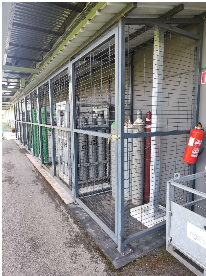
Slika 6: Boce sa stlačenim plinom

Prilikom rukovanja bocama, zbog njihovog oblika, glatke površine i težine, boce se ne smiju nositi ručno. Umjesto toga, mogu se kotrljati samo po donjem dijelu, držeći poklopac ventila. Ventil boce treba se otvarati polako, a zatvoriti ako rad prestaje na dulje od nekoliko minuta ili ako je boca prazna. Boce s plinom trebaju biti udaljene od izvora iskrica, otvorenog plamena i drugih potencijalnih opasnosti. Zabranjeno je pušenje i nošenje masne odjeće ili izlaganje nezaštićenih dijelova u blizini boca s plinom. Ulja i masti mogu se zapaliti zbog visokog tlaka kisika iz boce, stoga treba paziti da cilindri i spojnice budu udaljeni od izvora onečišćenja poput cijevi za ulje i zapaljivih materijala. Ako se boca acetilena pregrije i dođe do povrata plamena zbog neispravne opreme, potrebno je odmah zatvoriti ventil odvojiti regulator i druge dijelove, iznijeti bocu na vanjski prostor daleko od izvora paljenja, hladiti bocu vodom i nastaviti s hlađenjem dok