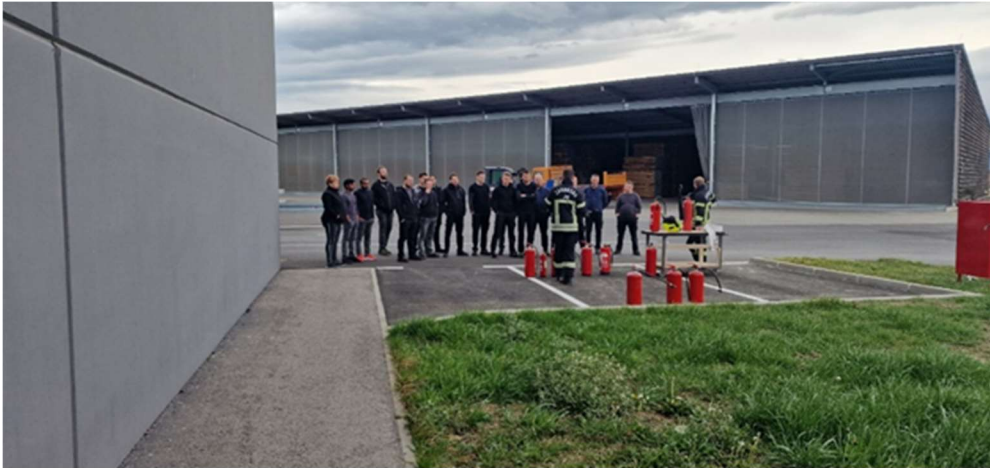
Slika 10: Teorijski dio vatrogasne vježbe

Praktični dio vatrogasnih vježbi uključuje rukovanje nekolicine zaposlenika s vatrogasnim aparatima i vatrogasnim crijevom s mlaznicom.