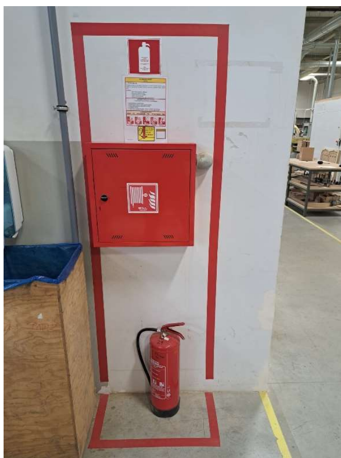
Slika 13: Aparat za početno gašenje požara i hidrantski ormarić

smještena u hidrantske ormariće koji su razmješteni po požarnim sektorima, a omogućuju sigurno i učinkovito rukovanje i uporabu. Vanjska hidrantska mreža pokriva cjelokupni objekt s tri vanjska nadzemna hidranta kako bi se postigla ravnomjerna pokrivenost objekta, a sve prema važećem Pravilniku o hidrantskoj mreži za gašenje požara. Nadzemni hidranti omogućuju sigurno i efikasno rukovanje i upotrebu u slučaju nastanka požara. Unutar poduzeća raspoređeno je 13 hidranata, 11 u prizemlju i 2 na katu. [11, 12]