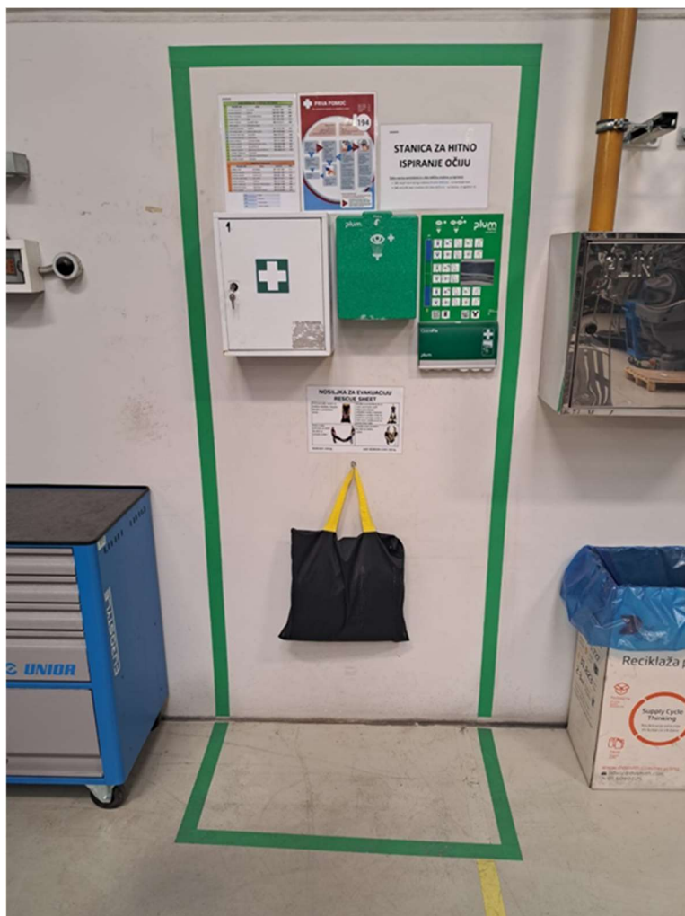
Slika 4: Stanica za hitno ispiranje očiju

funkcionalnost i dostupnost u svakom trenutku smanjujući rizik od kvarova ili nedostupnosti opreme u najkritičnijim situacijama.