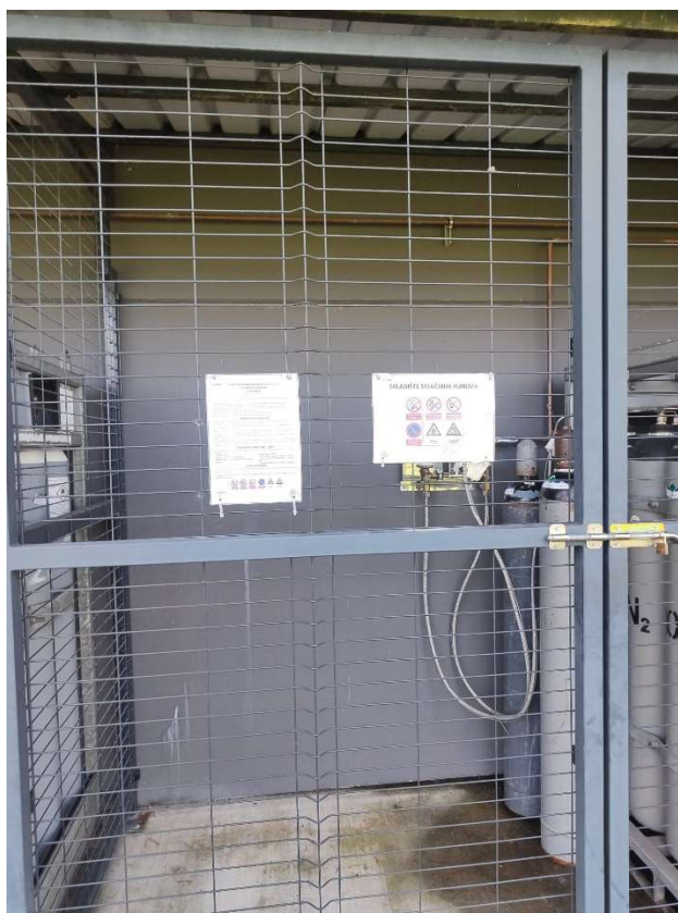
Slika 8: Upute za siguran rad

zabranjenog pušenja, zabranjene uporabe otvorenog plina, zabranjene uporabe alata koji iskri, zabrane parkiranja, opasnosti od požara te opasnost od eksplozije.