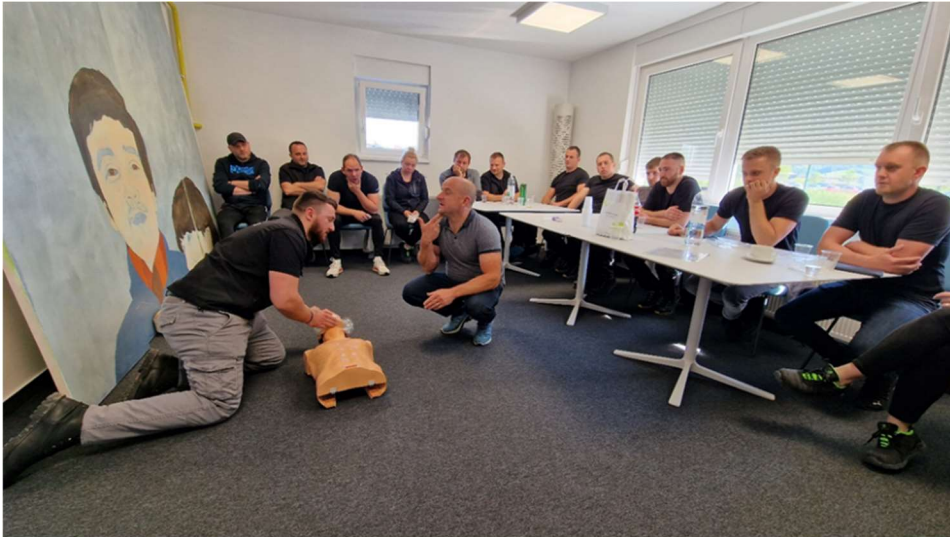
Slika 3: Tečaj prve pomoći

kojem su rizici svedeni na minimum, a radnici osposobljeni za pravilno pružanje prve pomoći u slučaju nesreće.