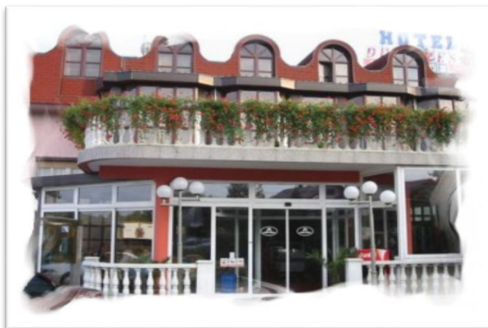
Slika 2: Hotel Duga Resa