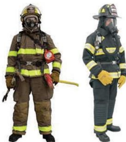
Slika 6. Odjeća za zaštitu od topline i plamena [16]

Normom HRN EN ISO 14116:2015 (Zaštitna odjeća - Zaštita od plamena - Materijali, kombinacije materijala i odjeća ograničena širenja plamena) zadani su zahtjevi vezani za materijale, dizajn te način označavanja odjeće za zaštitu od topline i plamena.