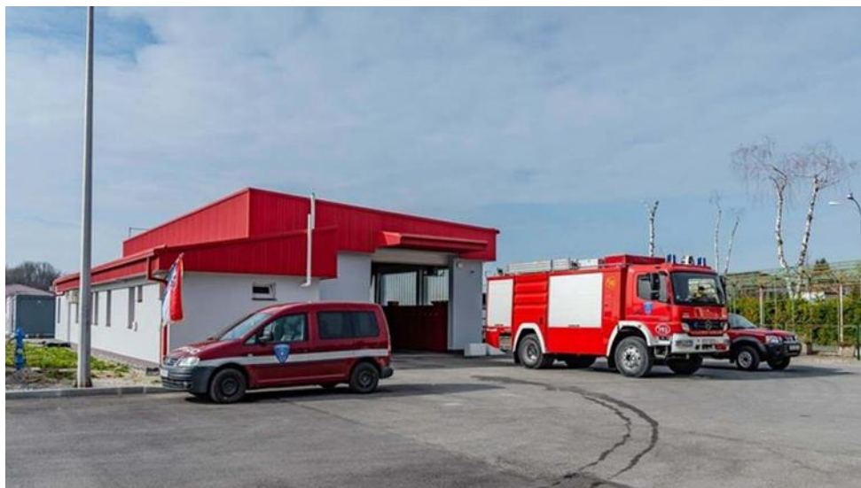
Slika 4. JVP Čazma [10]

Trenutno JVP Čazma zapošljava 17 stalno zaposlenih djelatnika od kojih je 16 operativnih djelatnika – profesionalnih vatrogasaca, te jedna djelatnica koja obavlja administrativne poslove. U nastavku slijedi tablica 4. u kojoj je prikazana kadrovska popunjenost unutar JVP Čazma prema dostupnim podacima.