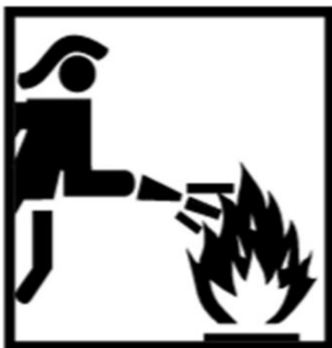
Slika 7. Piktogram vatrogasne intervencijske odjeće [16]