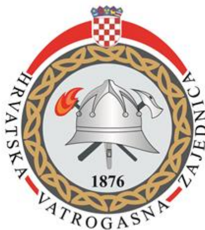
Slika 1. Grb Hrvatske vatrogasne zajednice [3]

U razdoblju Domovinskog rata (1991. – 1995.) vatrogasna organizacija je, kao i ostala udruženja i organizacije na području Hrvatske, primila teške udarce i prolazila kroz iznimno teško razdoblje. Velik broj članova vatrogasnih organizacija izgubilo je život, uništena je i otuđena oprema, uništeni i razoreni vatrogasni domovi i spremišta. Ime "Hrvatska vatrogasna zajednica" vraćeno je 1993. godine, a po završetku rata počela je obnova vatrogastva. Na slici 1. prikazan je grb Hrvatske vatrogasne zajednice. [2]