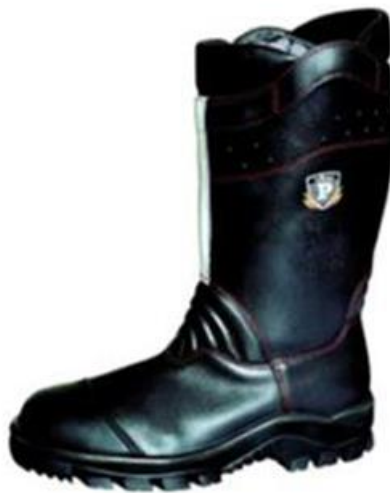
Slika 5. Vatrogasne kožne čizme [16]

Osobnu zaštitnu opremu nosi svaki vatrogasac pri intervencijama gašenja požara, spašavanju osoba i imovine, zaštitu okoliša i u drugim intervencijama u kojima se susreću s opasnosti za svoju sigurnost i zdravlje. Osim navedenog, osobna zaštitna oprema koristi se i za vrijeme praktičnih vježbi tijekom školovanja, osposobljavanja, usavršavanja te rada u vatrogasnim postrojbama. Zaštitna odjeća za vatrogasce koristi se prilikom gašenja požara ili sličnih aktivnosti gdje postoji opasnost od visokog stupnja opterećenja i izravnog plamena. Obzirom da vatrogasci obavljaju posao u različitim uvjetima gdje se mogu pojaviti različiti vanjski utjecaji prilikom akcidenata nastanka i širenja požara, radna odjeća vatrogasca mora zadovoljavati i zaštitu od ostalih uvjeta kao što su: zaštita od topline i plamena (Slika 6.), kemijskih, bioloških i radioaktivnih ugroza. Opća norma za zaštitnu odjeću koja se primjenjuje kao hrvatska norma je HRN EN ISO 13688:2013. Temeljni zahtjevi za zaštitnu odjeću su: neškodljivost, dizajn, udobnost, održavanje, ergonomija te označavanje odjeće. [15]