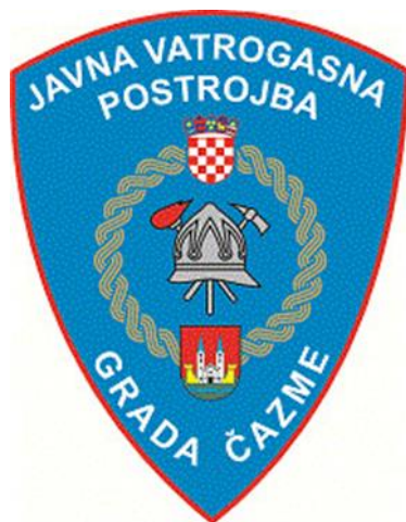
Slika 3. Grb JVP Grada Čazme [9]